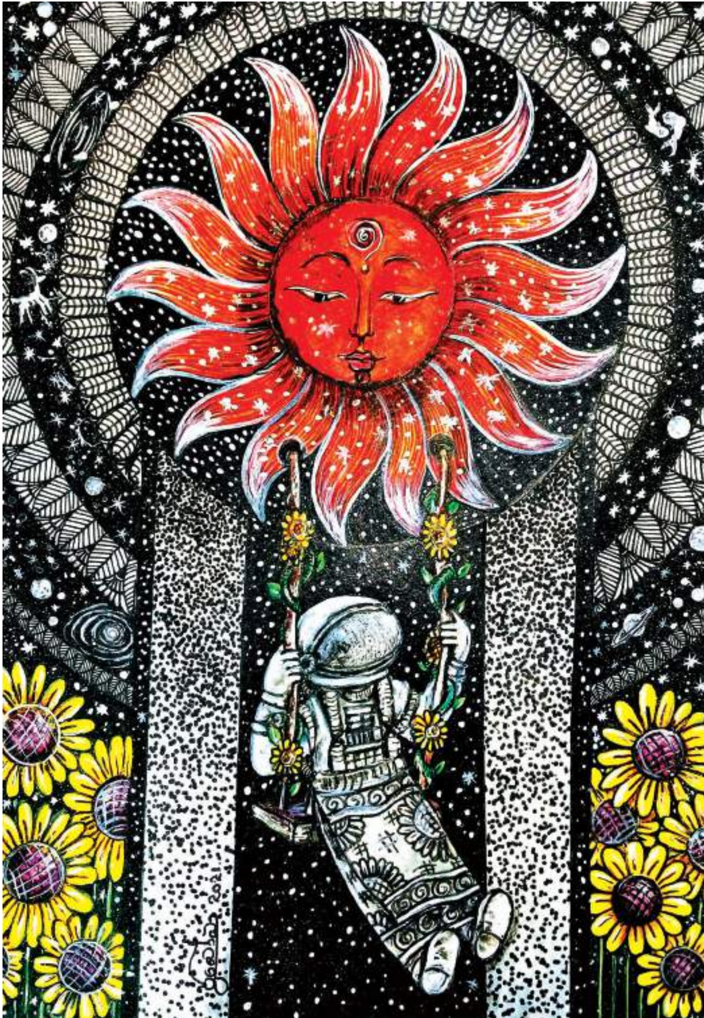
චිත්‍රය - ප්‍රදීපා ජයසිංහ