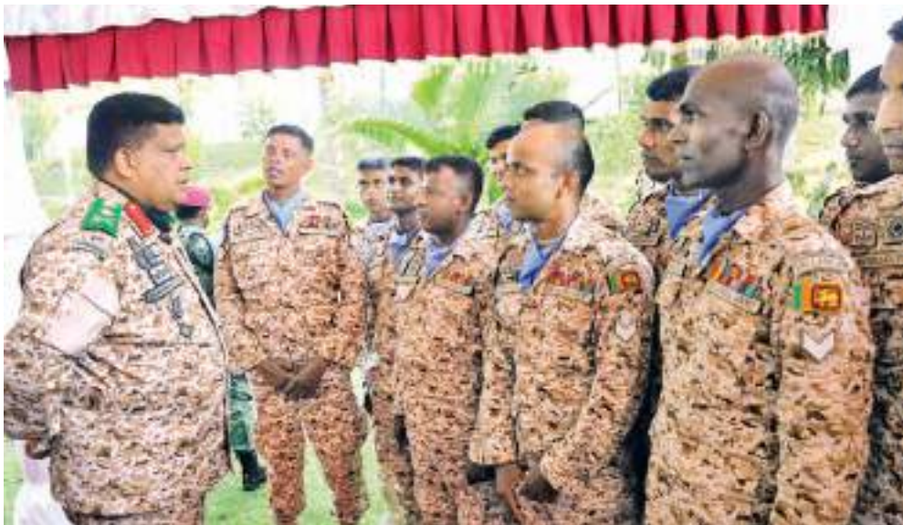
රක්ෂණ ලියාපදිංචි කළුගෙයින් සිටි...

ලෝකයේ දරුණුතම ත්‍රස්ත්‍රවාදී කණ්ඩායම් විනාශ කළ ශ්‍රී ලංකා යුද හමුදාව සතු හැකියාවන් දක්ෂතාවන් වෙත කිසිදු රටක හමුදාවක් සතු නොවන හෙයින් එක්සත් ජාතීන්ගේ සාම සාධක හමුදාවන්ට අපේ හමුදාවද එක් කර ගත් බවත් එය අපේ හමුදාවක් සතු මානුෂීය හා වය ලොවට කියා පෑමට අවස්ථාවක් බවත් ආරක්ෂක මාණ්ඩලික ප්‍රධානී, යුද හමුදාපති, ජෙනරාල් ශබේන්ද්‍ර සිල්වා මහතා පවසයි. එක්සත් ජාතීන්ගේ සාම සාධක මෙහෙයුම් රාජකාරීන් සඳහා මාලි රාජ්‍යය වෙත පිටත්ව යෑමට නියමිත තුන්වන සංග්‍රාමික ප්‍රවාහන හට කණ්ඩායම විසින් ආරක්ෂක මාණ්ඩලික ප්‍රධානී යුද හමුදාපති ජෙනරාල් ශබේන්ද්‍ර සිල්වා මහතා වෙත සම්මාන පෙළපාලියක් ඊයේ (08) කුකුළේ ගහ සාම සාධක මෙහෙයුම් පුහුණු ආයතනයේදී මහත් අභිමානයෙන් පිරිනැමිණි. ඒ අවස්ථාවේදී යුද හමුදාපතිවරයා මේ බව පැවසීය.