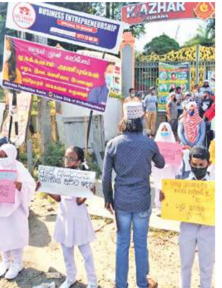
கா/அக்குரணை நீரேல் ஆரம்பப்பிரிவு பாடசாலையில் தரம் 5 இலிருந்து 6 இற்கு சித்தியடையும் மாணவர்களை அக்குரணை அஸ்ஹர் தேசிய பாடசாலையில் (2021) கல்வியைத் தொடர் அனுமதி வழங்கப்படாமலுக்கு எதிர்ப்பு தெரிவித்து பாடசாலை நிர்வாகத்துக்கு எதிராக பாதிக்கப்பட்ட மாணவர்களும் பெற்றோர்களும் நேற்று முன்தினம் பாடசாலைக்கு முன்னால் கவனயீர்ப்பு போராட்டத்தில் ஈடுபட்டனர். இதன்போது எடுக்கப்பட்ட படங்களை இங்கு காணலாம்.

யமற்றவர்கள் இதயத்திற்கே தீ வைத்து தானும் தன்னுடைய குலமும் அழிய வழி செய்வதாக பலரும் சுட்டிக்காட்டுகின்றனர். மலையகத்தினை பொறுத்தவரையில் வளமான, செழிப்பான, நிலவளம், நீர்வளம் காணப்படுவதற்கு இந்த காடுகளே காரணமாக அமைந்துள்ளன. அவ்வாறான ஒரு சூழ்நிலையில் பல நூறு ஏக்கர் காடுகள் வருடம் தோறும் அழிக்கப்படுகின்றன. இதனால் நீரேற்றுக்கள் வரண்டு போய் காணப்படுகின்றன. பல இடங்களில் விலங்குகளின் வாழ்விடங்கள் அழிக்கப்பட்டதன் காரணமாக சிறுத்தை, பாம்பு, உள் லிட்ட கொடிய மிருகங்கள் மக்கள் வாழும் இடங்களை நோக்கி தங்களது வாழ்விடங்களை மாற்றிக்கொண்டுள்ளன. இதனால் இன்று பொது மக்கள் பல்வேறு பிரச்சினைகளுக்கு முகம் கொடுத்த வண்ணம் உள்ளனர். காடழிப்பை சிலர் பொழுதுப் போக்குகாகவும், சிலர் மிருகங்களை வேட்டையாடுவதற்காகவும் காணிகளை அபகரிப்பதற்காகவும் செய்வதாக பாதுகாப்பு பிரிவினர் தெரிவிக்கின்றனர். இருந்த போதிலும் காடுகளுக்கு தீ வைப்பவர்கள் எவரும் இது வரை கைது செய்யப்படவில்லை. இதனால் இத்தகைய சம்பவங்கள் அதிகரித்திருப்பதாக பொது மக்கள் குற்றம் சுமத்துகின்றனர். எனவே பொறுப்பு வாய்ந்தவர்கள் இவற்றை தடுத்து நிறுத்த உரிய நடவடிக்கை எடுக்கப்பட வேண்டும் என பொது மக்கள் கோரிக்கை விடுகின்றனர்.