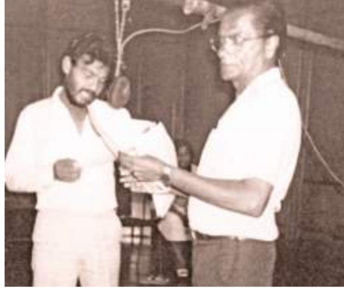
ගැමුණු- ශ්‍රී හිමල්