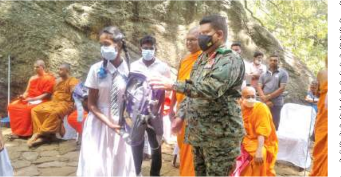
මාස කිහිපයක් සිටි වැදලා රටේ කෝවිඩ් වසංගතය පාලනය කිරීමට හැකියාව ලැබුණු බවත් සිංහල සහ දෙමළ අලුත් අවුරුදු සමයේ සෞඛ්‍ය උපදෙස්වලට අනුගතව ජනතාව කටයුතු කළ යුතු බවත් එසේ නොවුවහොත් අලුත් අවුරුදු සමයෙන් පසු මේ ලබාගත් තත්ත්වය අපෙන් ගිලිහී යෑමේ හැකියාවක් තිබෙන බව යුද්ධ හමුදාපති හා ආරක්ෂක මාණ්ඩලික ප්‍රධානි ශ්‍රී ලංකා සිල්වා මහතා පැවැසීය.

යුද්ධ හමුදාපති හා ආරක්ෂක මාණ්ඩලික ප්‍රධානි ශ්‍රී ලංකා සිල්වා