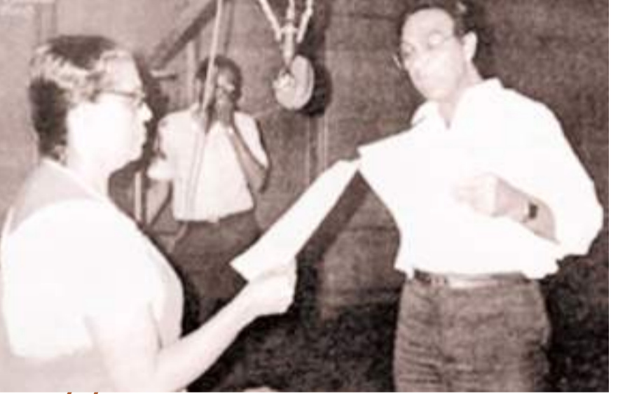
වරකාගොඩ සහ රත්නාවලී

එම ඉවන් විදුලි නාටක හඬ කැවීමට එකල මෙහි සිටි බ්‍රිතාන්‍ය ජාතිකයන් වූ දොස්තර ජෝන් පී.සර්සන්, දොස්තර එල්.නිකල්සන්, සර් රොනල්ඩ් රේස්, එච්.ඕ බ්‍රයන් එලියන් හා දොස්තර ආර්. එල්. ස්පිට්ල් යන අය දායක වී ඇත. එවකට ලංකාව එංගලන්තයේ යටත් විජිතයක්ව පැවැති අතර සියල්ල ඉංග්‍රීසි මාධ්‍යයෙන් සිදු වෙද්දී දීමෙම ඉවන් විදුලි නාටකය ද ඉංග්‍රීසි බසින්ම ප්‍රචාරය වී තිබේ.