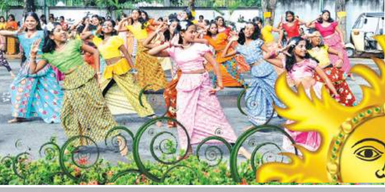
අමුණුපුර පියරහන හිමි අස්ගිරිය

ශාස්ත්‍රපති පණ්ඩිත අරම ශ්‍රී ධම්මචිලක භාහිමි