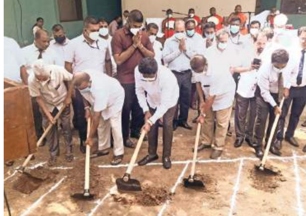
ජනමාධ්‍ය ඇමැතිවරයා නව රංග ශාලාවේ ඉදි කිරීම කටයුතු ආරම්භ කළ අයුරු.

රුවන්මැලි වෛතසරාමාධිපති පල්ලේගම සේමරත්න නාහිමියන් ඇතුළු මහා සංඝරත්නයද, ඇමැති එස්.එම්. චන්ද්‍රසේන, පාර්ලිමේන්තු මන්ත්‍රී උදේක ප්‍රේමරත්න, ජනමාධ්‍ය අමාත්‍යවරයාගේ ලේකම් ජගත් පී. විජේවීර, ශ්‍රී ලංකා ගුවන් විදුලි සංස්ථාවේ නියෝජ්‍ය අධ්‍යක්ෂ ජනරාල් (ප්‍රාදේශීය සේවා හා සංවර්ධන) කුමාර සන්දනායක මහත්වරුද මේ අවස්ථාවට සහභාගි වූහ.