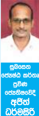
ශ්‍රී ලංකා ජනපති ජනරජයේ අතිරේක අමාත්‍ය ධර්මසිරි

මේස රවි 03 භාග වජ්‍ය පුර විසේනිය හිටිය ලක් කිව් දින ගුර උදාව 06.02 ට ගුර බැසීම 06.19 ට රෙගෙනා හතක රාත්‍රී 11.40 හි ගෙවී මුඛ සිරස හතක උදාවේ. ඔක් පුර විසේනිය සවස 06.06 හි ගෙවී ඔක් පුර සැටවක හිටිය ලබයි. සෙනහසු යෝගය සවස 06.23 හි ගෙවී සෙනහසු යෝගය ලබයි. විෂ්ට කරණය සවස 06.06 හි ගෙවී ශක්‍ය කරණය උදාවේ. විෂ කලාව - දුෂ්ඨය, අමෘත කලාව - කෙණ්ඩ යෝගිනි - ගිනිකොන මරු සිරිත දිසාව - ගිනිකොන සුඛ දිසාව - හඟෙනහිර