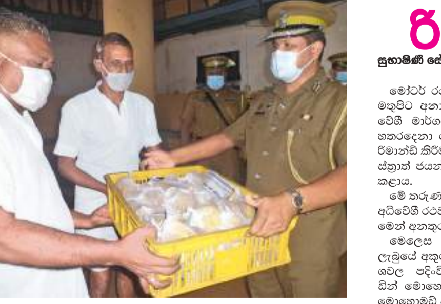
නේවාසික රැඳවුවන්ගේ සංගීත කණ්ඩායම මේ අවස්ථාවේදී සංගීත වැඩසටහනක් ද පැවැත්වීය.

සිංහල සහ දෙමළ අවුරුදු සමරමින්, වැලිකඩ බන්ධනාගාරයේ කාන්තා සහ පිරිමි රැඳවුවන්ට කිරිබත්, කැවුම්, කොකිස් ඇතුළු අවුරුදු කැවිලි සංග්‍රහයක් පෙරේදා(14) පැවැත්විණි. වැලිකඩ බන්ධනාගාර අධිකාරී ගාමිණී දිසානායක මහතාගේ සංකල්පයකට අනුව, සිරකරු සුභ සාධක සංගමයේ වැලිකඩ උප කමිටුවේ දායකත්වයෙන්, පුනරුත්ථාපන අංශයේ පුරුණ අධීක්ෂණයෙන් මේ උත්සවය සංවිධාන කෙරිණි.