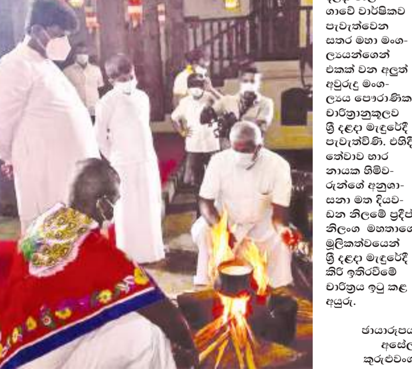
ඡායාරූපය අසේල කුරුච්චංග