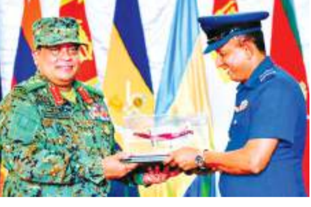
සේනා ආඥාපතිවරුන් සමඟ සාකච්ඡාවක් පැවැත්වූ අතර එහිදී, කොවිඩ් - 19 පැතිරීම වැළැක්වීමට ගනු ලබන ක්‍රියා මාර්ග හා සොබා නිර්දේශ ක්‍රියාත්මක කිරීම සහ ජනතාවගේ පොදු ගැටලු පිළිබඳව ද සාකච්ඡා කළේය.

ක්‍රීඩා හමුදාවේ සියලු නිලයන් නියෝජනය කරමින් යුද, නාවික හා ගුවන් හමුදා සාමාජිකයන් නිදහසෙන් වෙත සමරු කිලිණි ප්‍රදානය කළේය. අනතුරුව ආරක්ෂක මාණ්ඩලික ප්‍රධානි සහ යුද හමුදාපති ජෙනරාල් ගවේන්ද්‍ර සිල්වා මහතා ශ්‍රී ලංකා විදුලි හා යාන්ත්‍රික ඉංජිනේරු බලකා සාමාජිකයන් විසින් නවීකරණය කරන ලද බර වාහන වූත්, වැනිට්ස්, පාලදි සහ තුන් රෝද රථ යාපනය ආරක්ෂක සේනා මුලස්ථානය වෙත භාරදුන්නේය. පසුව, යාපනය, කිලිනොච්චිය සහ මුලතිව් ආරක්ෂක