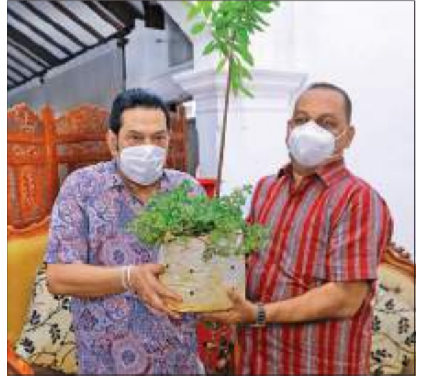
தமிழ், சிங்கள புத்தாண்டில் மரக்கன்று நடும் சுபநேரமான இன்றைய தினத்தில் (16) நடுவதற்காக, பிரதமர் மஹிந்த ராஜபக்ச, சற்றாடல்துறை அமைச்சர் மஹிந்த அமரவீரவர்க்கு வெள்ள சந்தன மரக்கன்றுகளை நேற்று (15) கால்டன் இல்லத்தில் வைத்து வழங்கிய போது பிடிக்கப்பட்ட படம்.

மேற்படி வேலைத் திட்டத்தை அரசாங்கம் கடந்த 12 ஆம் திகதி ஆரம்பித்த நிலையில் நேற்று முன்தினம் புதுவருடத்தை யொட்டி அதற்கான நடவடிக்கைகள் தற்காலிகமாக நிறுத்தப்பட்டிருந்தன. எவ்வாறெனினும் இதுவரை மேற்படி கொடுப்பனவுகளை வழங்குவதற்காக இனங்காணப்பட்டிருந்த 75 விதமானவர்களுக்கு அந்த கொடுப்பனவு வழங்கப்பட்டுள்ளதாகவும் அவர் தெரிவித்தார். அதற்கெனக் இதுவரை 06