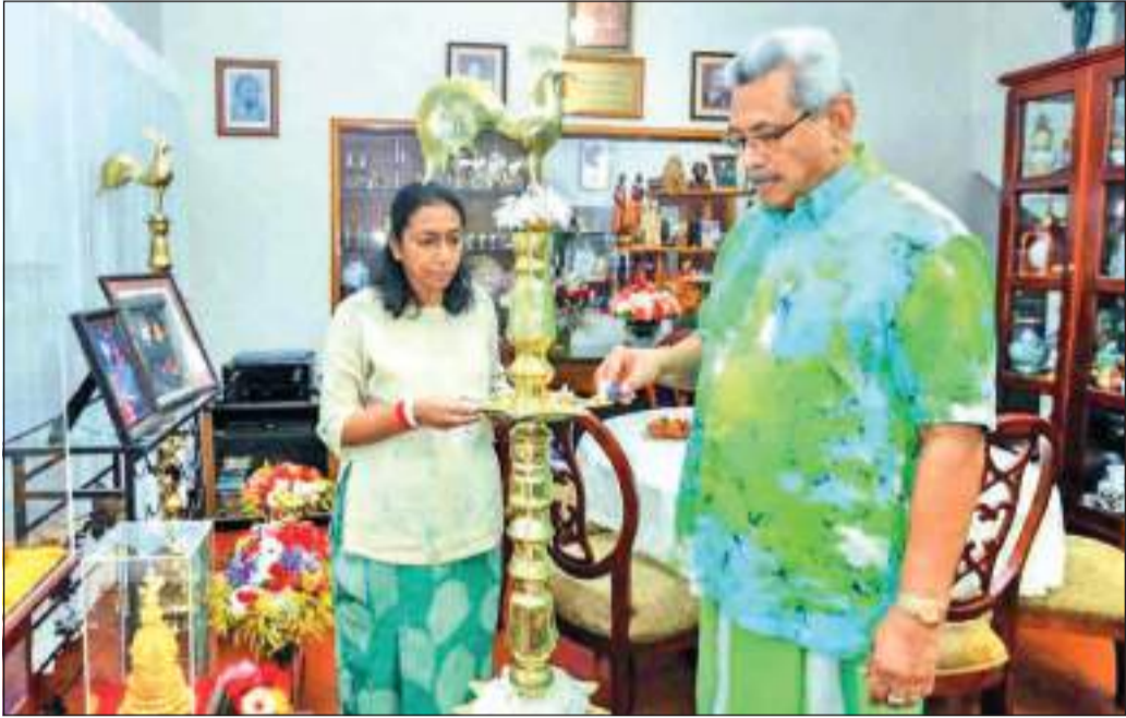
தமிழ், சிங்கள புதுவருடத்தை முன்னிட்டு ஜனாதிபதி கோட்டாபய ராஜபக்ச தனது பாரியார் அயோமாவடன் இணைந்து தனது இல்லத்தில் மிகவும் எளிமையாக புதுவருட பாரம்பரிய சடங்குகளில் ஈடுபட்டார்.