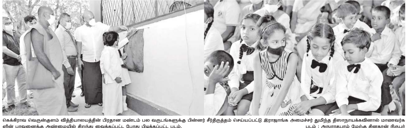
கெக்கிராவ வெருள்குளம் வித்தியாலயத்தின் பிரதான மண்டபம் பல வருடங்களுக்கு பின்னர் சீர்திருத்தம் செய்யப்பட்டு இராஜாங்க அமைச்சர் துமிந்த தீலாநாயக்கவினால் மாணவர்களின் பாவனைக்கு அண்மையில் திறந்து வைக்கப்பட்ட போது பிடிக்கப்பட்ட படம்.

குடையின் மீதும் மின்னல் தாக்கியுள்ளது. வயிற்றிலும், காலிலும் எரி காயங்களுக்கு இலக்காகியுள்ளார். இந்நிலையில் அயலவர்களின் உதவியுடன் புதுக்குடியிருப்பு ஆதார மருத்துவமனை எடுத்து செல்லப்பட்டு அங்கிருந்து மேலதிக சிகிச்சைக்காக மாவட்ட மருத்துவமனையில் தீவிர சிகிச்சைப்பிரிவில் அனுமதிக்கப்பட்டுள்ளார்.