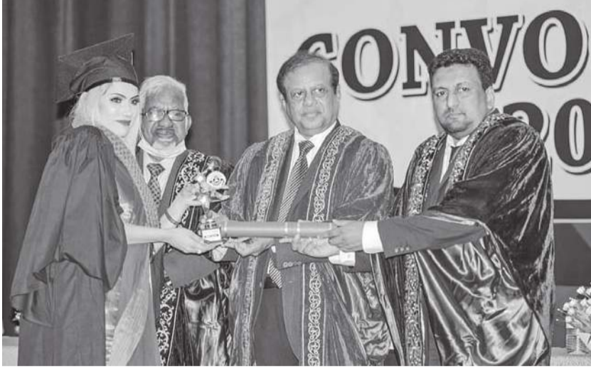
புத்தளம் தினகரன் நிருபர்

பம்பலப்பிட்டி அமேசன் உயர் கல்வி நிறுவனத்தின் சான்றிதழ் வழங்கும் வைபவம் அண்மையில் கொழும்பு பண்டாரநாயக்க ரூபகார்த்த சர்வதேச மாநாட்டு மண்டபத்தில் வெற்றிகரமாக நடைபெற்று முடிந்தது. இந்திகழ்வின் பிரதம அதிதியாக கல்வி மறுசீரமைப்பு, நிறந்த பல்கலைக்கழகங்கள் அமைச்சர் சுசில் பிரேமஜயந்த கலந்துகொண்டார். வெறும் புத்தக கல்வியை மட்டும் மையமாக கொள்ளாமல், மாணவர் களுக்கிடையே சம உறுப்பினர் பட்டங்கள், (Individual Project) பரிசீலி பட்டறைகள் (practical workshops),