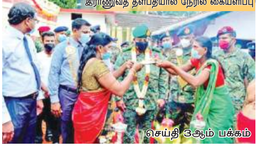
இராணுவத் தளபதியால் நேரில் கையளிப்பு செய்தி இதும் பக்கம்