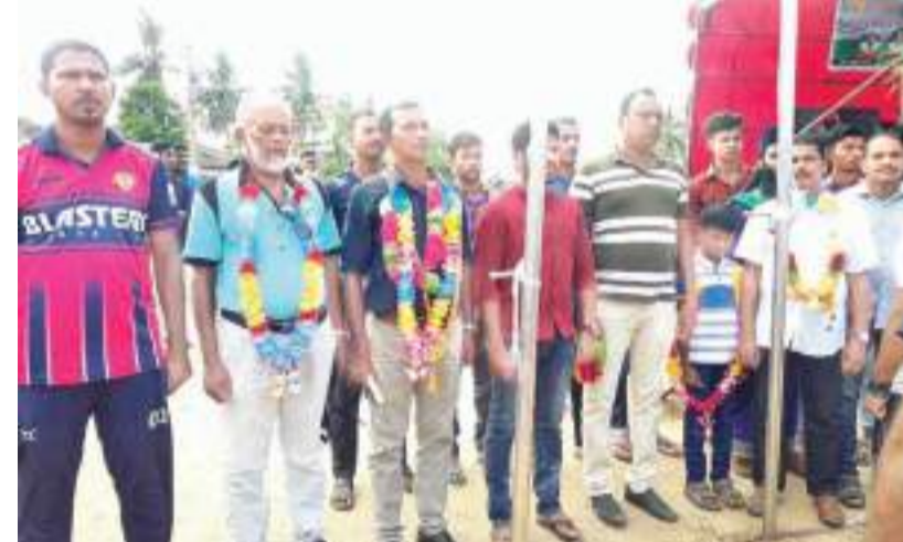
(கல்முனை மத்திய தினகரன் நிருபர்)