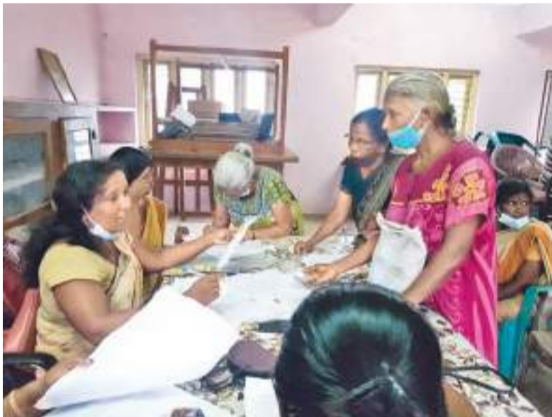
புத்தாண்டை முன்னிட்டு அரசாங்கத்தினால் 5,000 ரூபா விசேட நிவாரண கொடுப்பணவு வழங்கப்பட்டு வரும் நிலையில் வவுனியா பண்பாடுகளுக்கான கிராம அலுவலர் பிரிவில் முன்றலாது நாளாக (15) ஆம் தீக்கி கொடுப்பணவுகள் வழங்கி வைக்கப்பட்ட போது....

முள்ளேரியா தொற்றுநோயியல் வைத்தியசாலையில் சிகிச்சை பெற்று வந்த இவர் நேற்று முன்தினம் உயிரிழந்ததாக சுகாதார சேவைகள் பணிப்பாளர் குறிப்பிட்டார். பெண்ணின் சடலம் சுகாதார நடைமுறைகளின் கீழ் முள்ளேரியாவிலேயே மின்தகனம் செய்யப்படதாகவும் குறிப்பிட்டார்.