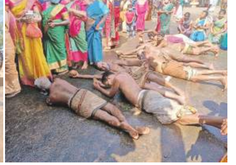
புத்தாண்டு தினத்தில் வவுனியா, வைரவப்புளியங்குளத்தில் எழுந்தருளியிருக்கும் ஆதிவிநாயகர் திருக்கோவிலில் தேர்த்திருவிழா மிகவும் சிறப்பாக இடம்பெற்ற போது பிடிக்கப்பட்ட படங்கள்.