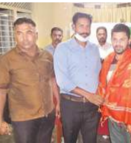
(பாலமுனை விசேட நிருபர்)