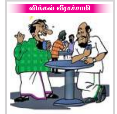
விக்கல் வீராச்சாமி அரசுக்கு எதிரான செய்திகளை மட்டும் போடுவதெனிய சில ஊடகங்கள் தங்க ஊடக நர்மலாக கவையிடிக்கு... எதிரான செய்திகளை யோட்பாத்தான் தங்க ஊடகம் நல்ல விலை யோடு-மெண்டு அலை நினைக்கின்ம போல !!!