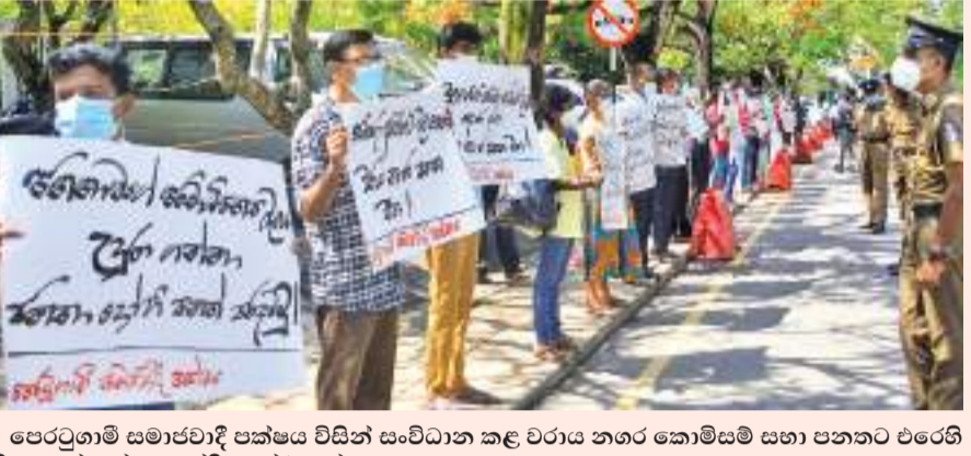
පෙරටුගාමී සමාජවාදී පක්ෂය විසින් සංවිධාන කළ වරාය නගර කොමසම සහා පනතට එරෙහි නිහඬ දර්ශෝපණයේදී අවස්ථාවක්.

අලුත් අවුරුදු සමය අවසන් වීමෙන් පසු එම ප්‍රදේශයේ සිදු කළ පී.සී.ආර්.පරීක්ෂණවලදී මේ නව රෝගීන් හමු වී ඇති අතර එම පළාතේ පී.සී.ආර්.පරීක්ෂණ 378 ක් සිදු කළ බවද සෞඛ්‍ය අධ්‍යක්ෂවරයා පැවසීය.