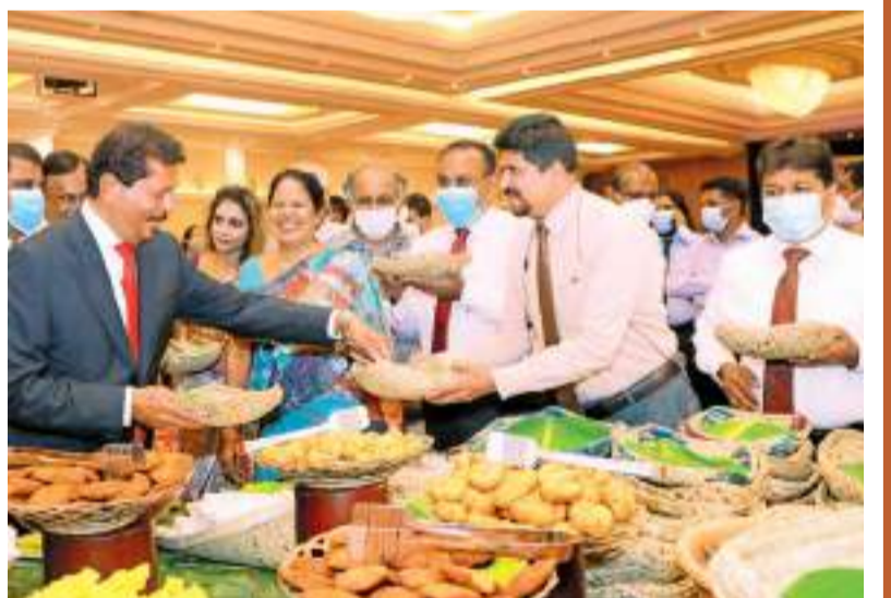
කාර්ය මණ්ඩලයේ සාමාජිකයෝ සහ අගමැතිවරයාට අයත් අමාත්‍යාංශ-වල පෞද්ගලික කාර්ය මණ්ඩලද මේ අවස්ථාවට එක් වී සිටියහ.

අලුත් අවුරුද්දෙන් පසු අගමැති කාර්ය මණ්ඩල කාර්යාල කටයුතු අගමැති මහින්ද රාජපක්ෂ මහතාගේ ප්‍රධානත්වයෙන් ඊයේ (19) පෙරවරුණේ අලුතින් පවරා ගත් ආරම්භ විය. අගමැති මහින්ද රාජපක්ෂ මහතා මෙහිදී සිය කාර්ය මණ්ඩලයේ නිලධාරීන් ඇතුළු සියලු සාමාජිකයන්ට අලුත් අවුරුදු සුභංගිසන එක් කළේය. කාර්ය මණ්ඩල සාමාජිකයන් ද අලුත් අවුරුද්දේ වැඩ ආරම්භ කිරීමට පෙර අගමැතිවරයාගේ ආශීර්වාදය ලබාගැනීම විශේෂත්වයකි.