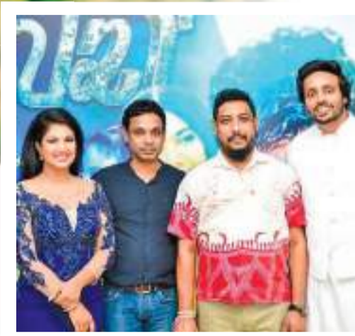
කබ්ඩ මුහුරන් උළෙල දා...