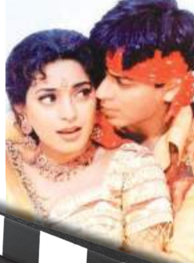
අන්තර්ජාලයෙහි වචනිකා දීපානි රණසිංහ

ජූහි විලා හා ගාදුක් බාත් සිනමාවේ කදිම සුසංයෝගයකි. ඔවුන් දෙදෙනා රැඳු වුරු, ඉයස් බොස්, බූර් හි දිල් හෙ ගිත්දස්පානි, රාම් පානේ වැනි සිනමා පට අදට ද ජනප්‍රියය. සල්මන් බාත්, අමීර් බාත්ට වඩා ජූහිගේ සිත් ගත් මිතුරු වුයේ ද ගාදුක් බාත්ය. එහෙත් ඇයට මුළුම ආර්යත් බාත් සමඟ රහපැමට පවා මනාපයක් නො තිබිණි. නවක තාරකාවක වු ජූහිට රාජු බත් ගයා ජේන්ට්ලමන් සිනමා පටයේ අමීර් වැනි නළුවකු සමඟ රගන්නට ඇති බව නිෂ්පාදකවරයා ගැටුණේය. ඒ නළුවාගේ රුචි සිතුවමට නගා පෙන්විය. දර්ශන තලයට ගිය විට ජූහිට දකින්න ලැබුණේ කෙටටු, කලෙප් සමඟ ඇති තරුණියකි. ජූහි මවා ගෙන සිටි රුච්ට වඩා ඒ රුචි හාත්පසින්ම වෙනස් විය. 'මොයා අමීර්ට සමාන වෙන්නේ මොන පැත්තෙන්ද?' ජූහි නිෂ්පාදකවරයාගෙන් ඇසුවේ කෝපයෙනි. අවසන් ජූහි, ගාදුක් සමඟ රහපැ අතර ඔවුහු හොඳම මිතුරෝ බවට ද පත්වූහ.