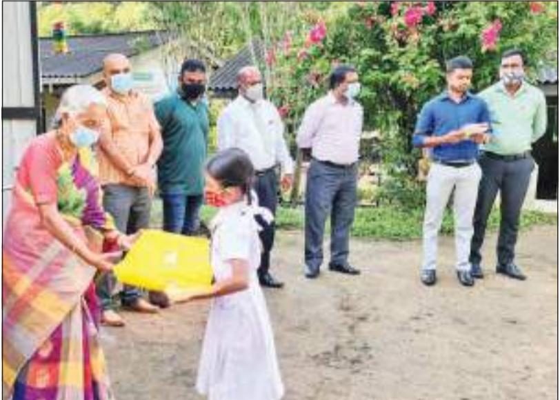
வந்துகாமம் கல்வி வலயத்திலுள்ள மாபேரிதனை தமிழ் வித்தியாலயத்தில் 'சொலாசன்' அமைப்பு ஒழுங்கு செய்த பாடசாலை மாணவர்களுக்கு கற்றல் உபகரணங்கள் வழங்கும் வைபவத்தில் எடுக்கப்பட்ட படம்.