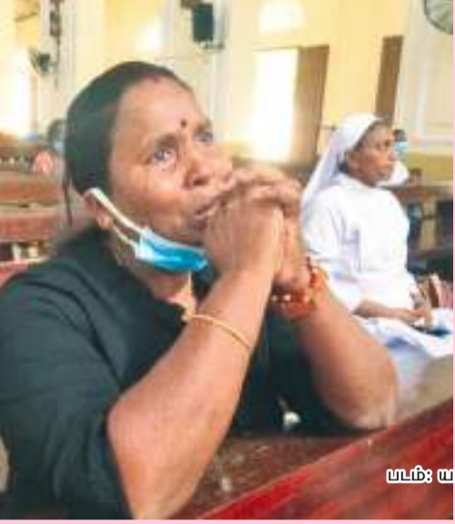
படம்: யாழ்.விசேட நிருபர்