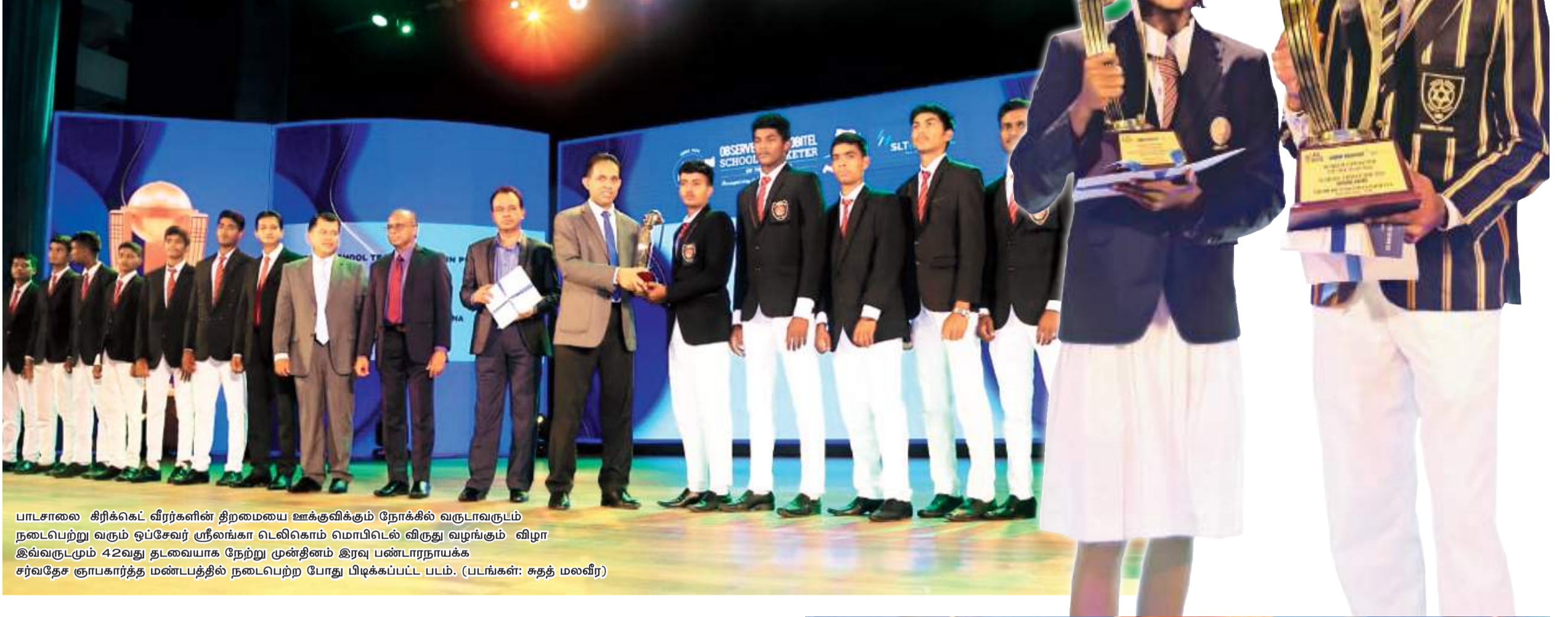
பாடசாலை கிரிக்கெட் வீரர்களின் திறமையை ஊக்குவிக்கும் நோக்கில் வருடாவருடம் நடைபெற்று வரும் ஒப்பேவர் ஸ்ரீலங்கா டெலிகாம் மொபிடெல் விருது வழங்கும் விழா இவ்வருடமும் 42வது தடவையாக நேற்று முன்தினம் இரவு பண்டாரநாயக்க சர்வதேச ரூபகார்த்த மண்டபத்தில் நடைபெற்ற போது பிடிக்கப்பட்ட படம்.