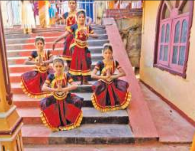
கப்பல்துறை சரஸ்வதி தமிழ் வித்தியாலய மாணவிகள் அண்மையில் நடைபெற்ற திருகோணமலை கோணைஸ்வரா ஆலயத்தின் வருடாந்த தேர்த் திருவிழாவில் நிகழ்த்திய நடன நிகழ்வின் போது பிடிக்கப்பட்ட படம்.