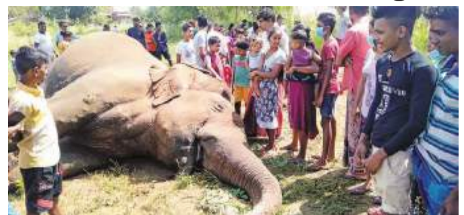
அநுராதபுரம் மேற்கு தினகரன் நிருபர்

தம்புத்தேக சோளம் பகுதியில் சட்டவிரோத மின் இணைப்புடன் மோதி காட்டு யானை யொன்று உயிரிழந்ததாக தலாவன அலுவலகர் தெரிவித்தார். சோளம் பகுதியைச் சேர்ந்த விவசாயி ஒருவர் தனது பண்ணை பயிற்செய்கையை பாதுகாக்கும் நோக்கில், ஏற்படுத்தியிருந்த மின் இணைப்பில் சிக்கியே இந்த யானை உயிரிழந்தது. நாற்பது வயதுடைய யானையே, இச்சம்பவத்தில் உயிரிழந்தது. பண்ணையைச் சுற்றி சட்டவிரோத மின் இணைப்பை ஏற்படுத்தி இருந்ததாக கூறப்