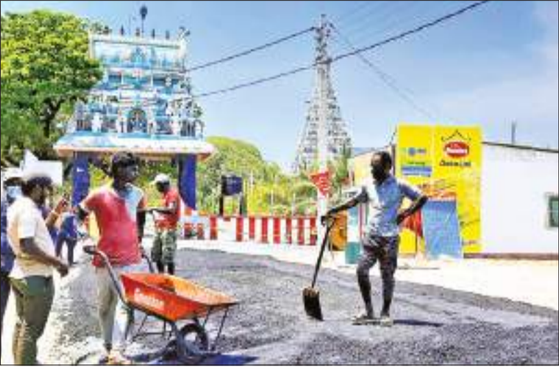
தேசிய வெசாக் நிகழ்வுகள் இம்முறை நயினாவில் நாகரீப விகாரியில் நடைபெற ஏற்பாடுகள் வகுவதால் நயினாவில் பிரதான வீதி, நாகபூசனி அம்மன் ஆலயம் தொடக்கம் வைத்தியசாலை வரை கார்ப்பெட்ட வீதியாக புனரமைக்கும் பணியின் முத்தங்கட்ட பணிகள் நேற்று ஆரம்பிக்கப்பட்டபோது.