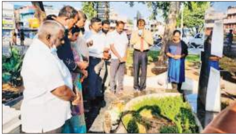
தியடைய பிரார்த்தனையும் இடம்பெற்றது. இந்நிகழ்வில் மட்டக்களப்பு மாநகர சபையின் எதிர்க்கட்சி உறுப்பினர்கள், உயிரிழந்த உறவுகளின் உறவினர்கள் கலந்து கொண்டனர். இதன்போது மட்டக்களப்பு மாநகரசபை ஆணையாளர் தலைமையுடைய அறங்கையில், கடந்த 2019.4.21ஆம் திகதி நடைபெற்ற மிலேசை படுகொலையினால் பலர் உயிரிழந்துள்ளதன், பலர் இன்று சமூகத்தில் மாற்றுத்திறனாளிகளாக பொருளாதார வசதிகள் இன்றி காணப்படுகின்றார்கள். பாதிக்கப்பட்டவர்களுக்கும், உயிரிழந்த குடும்பத்தாருக்கும் அரசாங்கம் உதவிகளை செய்யவேண்டும் எனத்தேறிவித்தார்.