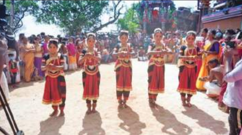
கப்பல்துறை சரஸ்வதி தமிழ் வித்தியாலய மாணவிகள் அண்மையில் நடைபெற்ற திருகோணமலை கோணைஸ்வரா ஆலயத்தின் வருடாந்த தேர்த் திருவிழாவில் நிகழ்த்திய நடன நிகழ்வின் போது பிடிக்கப்பட்ட படம்.