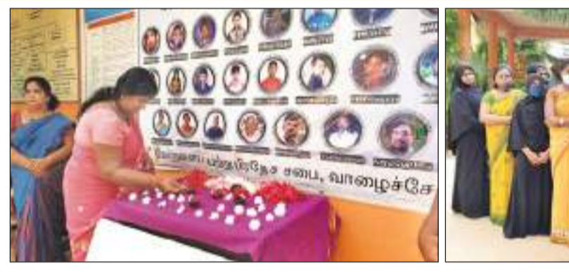
தலைமையில் ஈஸ்டர் தாக்குதலில் உயிரிழந்தவர்களின் ஆத்மா சாந்தி வேண்டி ஈசைச்சுடர் ஏற்றி அஞ்சலி செலுத்தப்பட்டது. இதில் பிரதேச சபை உறுப்பினர்கள், சபை உத்தியோகத்தர்கள் கலந்து கொண்டனர்.