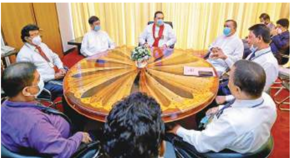
ලංකා බැංකුවේ සහ ජාතික ඉතිරි කිරීමේ බැංකුවේ නිලධාරී විශ්‍රාම වැටුප් 2014 වර්ෂයේ දී ජනාධිපතිවරයාගේ අභියෝග හමුවේ රාජ්‍ය බැංකු ක්ෂේත්‍රය ශක්තිමත්ව පවත්වාගෙන යාම සහ සේවකයන්ගේ ගැටලුවලට විසඳුම් සොයා ගැනීමට අදාළව මෙම හමුව පැවැත්විණි.

මහින්ද අලුත්ගෙදර රාජ්‍ය බැංකු පද්ධතිය ශක්තිමත්ව පවත්වාගෙන යා යුතු බව අගමැති මහින්ද රාජපක්ෂ මහතා පවසයි. ඒ මහතා මේ බව පැවසුවේ පාර්ලිමේන්තු සංකීර්ණයේ පිහිටි අගමැති කාර්යාලයේ රටේ (23) පැවැති ප්‍රභව බැංකු සේවක සංගමයේ නිලධාරීන් සමඟ දීර්ඝ සාකච්ඡාවක නිරතවෙමින් ඒ මහතා මේ බව පැවසුවේය. කාලීන අභියෝග හමුවේ රාජ්‍ය බැංකු ක්ෂේත්‍රය ශක්තිමත්ව පවත්වාගෙන යාම සහ සේවකයන්ගේ ගැටලුවලට විසඳුම් සොයා ගැනීමට අදාළව මෙම හමුව පැවැත්විණි. 1996 වර්ෂයේ සිට නවතා දමා තිබූ මහජන බැංකුවේ,