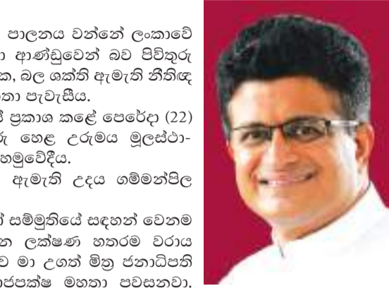
පිළිගන්න එපා කියලා. අපේ ස්වාමීන් වහන්සේට කාලාම සුත්‍රය පිළිබඳ හොඳ අවබෝධයක් තිබෙන බව අප දන්නා කාරණයක්.

ලංකාමුද්‍රාපාලන බැංකුවේ වරාය නගර භූමිය වන්නේ ලංකාවේ හිතියට අනුව ලංකා ආණ්ඩුවෙන් බව පිටිතුරු හෙළ උරුමයේ නායක, බල ශක්ති ඇමැති හිතියට උදය ගම්මන්තිලක මහතා පැවැසීය.