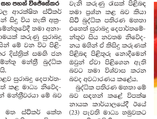
මන්පැත් බෝතල් මහ ස්ටික් හෝ කේත මුදා හැරීමෙන් විශාල ජාචාරමකට පසු- බිම නිර්මාණය වන බවයි හැඟීම. ඊට හේතු වී ඇත්තේ නිසි පරිපාටියෙන් තොරව මේ සේනවරයා ලබාදී ඇති MSP (Madras Security Printers) ඉන්දියානු ආයත- නය ඉන්දියාව තුළ ද අසාදු ලේඛන ගත වී ඇති සමාගමක් බවත් මන්පැත් නිෂ්පාදන සමාගම සමග එක්ව සිදු කළ බරපතළ වංචා නිසා එරට ප්‍රමිති ආයතන නිලධාරීන්, මේ

සුභාභිෂි සේනානායක සහ පහන් විජේසේකර මන්පැත් බෝතල්වල ආරක්ෂිත ස්ටික් ඇලවීම සම්බන්ධයෙන් සිදු විය හැකි අනු- මිකතා පිළිබඳ පාර්ලිමේන්තුවේදී තමා අනා- වරණය කළ බොහෝමයක් කරුණු සුරාබදු දෙපාර්තමේන්තුව විසින් මේ වන විට පිළි- ගෙන ඇති බව මාතර දිස්ත්‍රික් සමගි ජන බලවේගයේ පාර්ලිමේන්තු මන්ත්‍රී බුද්ධික පතිරණ මහතා පවසයි.