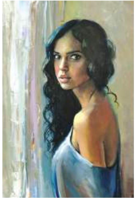
සිට ඉගැන්විය යුතු කරුණකි. ගැහැනියකගේ අඩ නිරුවත් ඡායාරූපයක් දුටු පමණින් තරුණ මහලු හේදයකින් තොරව අද ඇති වන්නේ ලිංගිකත්වය පිළිබඳ මන දොළක් පමණක්මය. එයින් ඔවුන්ගේ ස්වයං විනය පිරිහී ගොස්

ලිංගිකත්වය, ළමා අපයෝජන, ළමා අපචාර, කාන්තා හිංසනය අද සමාජය පුරා ම දක්නට ඇත. ඇමරිකාව යුරෝපය ආදී රටවල කාන්තාවට ඇති නිදහස ලාංකේය කාන්තාවට නොමැති බව අපි අවිවාදයෙන් යුතුව පිළිගත යුත්තෙමු. ආගමික පසුබිම පෙරටු කර ගනිමින් ගමන් කරන ලාංකීය ජන සමාජය තුළ කාන්තාවට නිසි ගෞරවය නොලැබෙන්නේ ඇයි? මෙයට හේතුව ප්‍රොඩ් ඉතිහාසයකට උරුමකම් කියමින් පුරපාරම් දොඩමින්, ශිෂ්ටත්වයේ සිංහ හම පොරවා ගත් ශ්‍රී ලාංකික ජන සමාජයේ බොහෝ දෙනා ස්වයං විනයකින් මිදී තිරිසන් භාවය ද අහිභවා යන්නන් වීමයි. එබැවින් වර්තමානයේ ගැහැනිය යනු ලිංගිකත්වයේ සංකේතයකි. ලිංගිකත්වය යනු සාමාන්‍ය ජන ජීවිතයේ එක් ක්‍රියාවලියක් පමණි. නමුත් ලාංකේය ජන සමාජයේ අහිමානවත් හෙළයන්ට හෝඩියේ