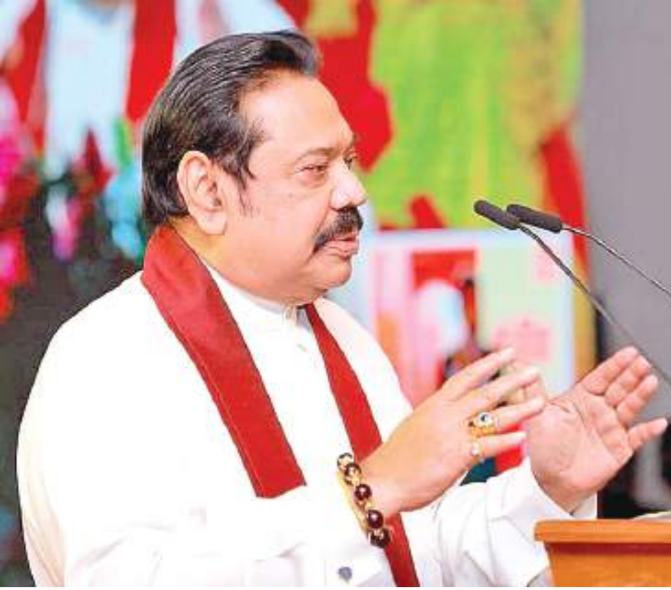
களை மேற்கொள்ளல், தனிமைப்படுத்தல் மற்றும் தொற்றாளர்களுக்கு சிகிச்சை அளித்தல் மற்றும் குறைந்தபட்ச இறப்பு விகிதத்தை

எங்களால் பராமரிக்க முடிந்தது. இலங்கை ஒரு வலுவான பொது சுகாதார திட்டத்தை கொண்டுள்ளது. இலவச சுகாதார வசதிகள் தொற்றுநோயைக் கட்டுப்படுத்த உதவின. கடந்த பெப்ரவரி மாதம் நமது அரசாங்கத்தால் 100,000 இலங்கையர்களுக்கு தடுப்பூசி வழங்க முடிந்தது.