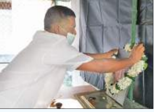
(காரைதீவு குறுப் நிருபர்)

தந்தை செல்வா அன்று சொன்னது, கடவுள் தான் தமிழர்களை காப்பாற்ற வேண்டும் என்பதனை தமிழர்கள் உணர் தோடங்கியுள்ளனர். தமிழரசு கட்சியை நிராகரிக்க தோடங்கியவர்களின் செயற்பாடு கட்சியை மீட்டெடுக்கும் என த.தே.கூட்டமைப்பின்