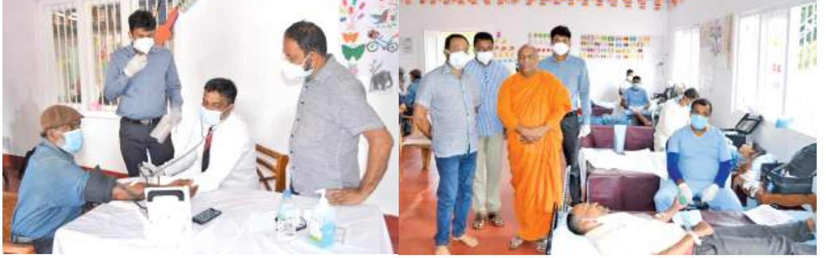
நுவரெலியா பொது வைத்தியசாலை வைத்தியர்களின் ஏற்பாட்டில் நுவரெலியா சர்வதேச பொளத்த நிலையத்தில் நேற்று (27) செவ்வாய்க்கிழமை இரத்த தானம் நிகழ்வு ஒன்று இடம்பெற்றது. இதன்போது எடுக்கப்பட்ட படங்களை இங்கு காணலாம்.

யுள்ளதால் தொழிலாளர்கள் கடும் அதிருப்தி அடைந்து போராட்டத்துக்கு செல்லும் ஒரு பதற்றமான நிலை தோன்றியிருந்தது. இந்நிலையில், இந்த விடயம் தொடர்பில் செந்தில் தொண்டமான் எவ்வளவுதான் கொண்டு வரப்பட்டதை தொடர்ந்து உடனடியாக தோட்டத்துக்கு சென்ற செந்தில் தொண்டமான், தொழிலாளர்களிடம் ஏற்பட்டுள்ள சுமுகமற்ற நிலையை அறிந்துகொண்டதுடன் விரைவில் இந்த பிரச்சினைக்கு தீர்வை பெற்றுத்தருவதாக தொழிலாளர்களிடம் உறுதியளித்தார். இதேவேளை, இதுவரை காலமும் இருந்த நடைமுறையை பின்பற்றாமலும் 18 கிலோவுக்கு அதிகமாக பார்க்கப்படும் கொழுந்துக்கு மேலதிக கொடுப்பனவை நிர்வாகம் கட்டாயம் வழங்க வேண்டும் எனவும் வலியுறுத்தியுள்ளார்.