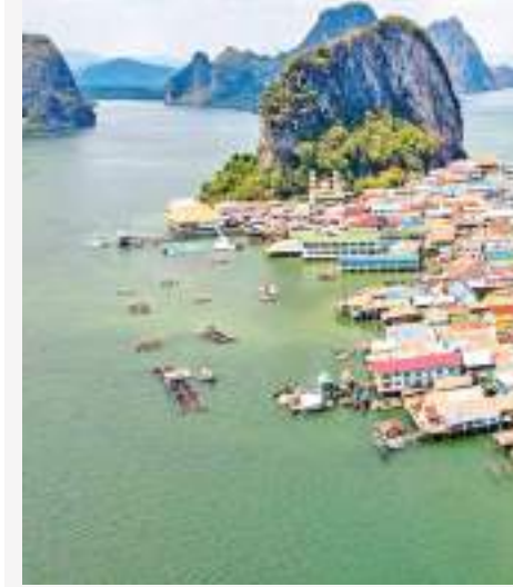
தாய்லாந்து என்பது உல்லாசப் பயண நகராகும். அந்நாட்டிற்கு வருமானத்தை ஈட்டித் தருவது சுற்றுலா துறையாகும். அங்கு அமைக்கப்படும் அனைத்து நிர்மாணங்களும் சுற்றுலா துறையை மையப்படுத்தியே மேற்கொள்ளப்படுகின்றன. இதனை நோக்கமாகக் கொண்டே கோ பன்யி நகரம் சமுத்திரத்தில் அமைக்கப்பட்டுள்ளது.

இந்த நகரம் அமைக்கப்பட்டுள்ள தீவு பதினெட்டாம் நூற்றாண்டுக்கும் அப்பாற்பட்ட சரித்திரத்தை உடைய மீனவக் கிராமமாகும். ஆனால் இருபத்தேராம் நூற்றாண்டு ஆரம்பமானவுடன் சுற்றுலாத்துறையின் முக்கியத்துவத்தை புரிந்துகொண்ட பின்னர் அது சமுத்திர நகரமாக அபிவிருத்தி செய்யப்பட்டுள்ளது.