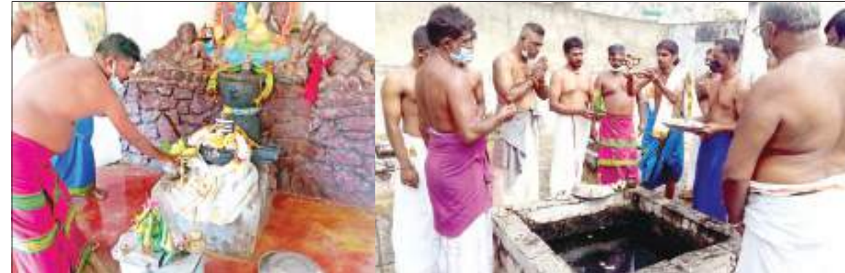
இந்துக்கள் சித்திரா பெளர்ணமி விரதத்தை திங்கட்கிழமை (26) திருக்கோணமலை கன்னியா வெற்றி ஊற்று சிவன் ஆலயத்தில் ஆதமக்களுக்கு பிதர் கடன் வழங்கும் நிகழ்வு நடத்தப்பட்டது. கன்னியா சிவன் ஆலயத்தில் பூசை வழிபாடுகள் நடைபெற்றது. சுநீர் சிணற்றில் பூசை இடம்பெறுவதையும், சிவன் ஆலயத்தில் அடியவர்கள் பிதர் கடன் வழங்குவதையும் படங்களில் காணலாம்.

இதில் நால்வர் கிண்ணியா சுகாதாரப் பிரிவுக்குட்பட்ட சீனக்குடா பிரதேசத்தை சேர்ந்தவர்கள் என்றும், மற்றையவர் றஹ்மாவியா கிராம சேவகர் பகுதியில் உள்ள 53 வயதான பெண் என்றும் தெரிவித்த அவர், கொரோனாவின் உலகு அலைக்குப் பின்னர் கிண்ணியா சுகாதாரப் பிரிவில் மொத்தமாக 134 பேர் கொவிட் 19 தொற்றாளர்களாக இனங்காணப்பட்டிருக்கிறார்கள். அதில் ஒருவர் மரணமடைந்திருக்கிறார் என்றும் தெரிவித்தார்.