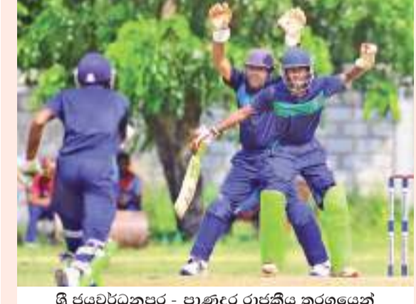
ශ්‍රී ජයවර්ධනපුර - පාණ්ඩු රාජකීය තරගයෙන්

මේ තරගාවලියේ 'බී' කාණ්ඩයේ (Tier B) ශූරතාව දිනා ගැනීමට කොට්ටේ ශ්‍රී ජයවර්ධනපුර මහ විදුහල සමත් විය. බිආර්ඪි පීටියේ පෙරේරා පාසලේ ප්‍රධාන තරගයෙන් ශ්‍රී ජයවර්ධනපුර පිල හමුවේ පාණ්ඩු රාජකීය විදුහල ලකුණු 5කින් පරාජයට පත් විය. තරගයේ පළමුව පන්දුවට පහර දුන් ජයවර්ධනපුර පිල ලකුණු 136කට දැවී ගිය අතර, එම ඉලක්කය හමාගිය රාජකීය පිලට ඔවුන් 46.3කදී සියල්ලන් දැවී රැස් කළ හැකි වූයේ ලකුණු 131ක් පමණි. ලකුණු 18ක් රැස් කළ හානිය සත්සර රාජකීය ඉතිරි වැඩිම ලකුණු ලාභියා විය. පන්දු යැවීමේදී දෙනුවෙන් ජයවර්ධන කඩුලු 4ක් බිඳ දැමීමේය. ජයවර්ධනපුර පිල වෙනුවෙන් ජයද සංකල්ප නොදැවී ලකුණු 50ක් රැස් කළේ හතරේ පහර 4ක් සමගින් පන්දු 138කිනි. කවිෂ්ක ගිනන් ලකුණු 23ක් රැස් කළ අතර, සෙසු පිතිකරුවන්ට ලකුණු 20 සීමාව පසු කිරීමට රාජකීය පන්දු යවන්නන්ගෙන් ඉඩක් නොලැබිණි. පන්දු යැවීමේදී තවත් එන්දුව කඩුලු 3ක් දවාගත් අතර, යසින් ප්‍රමෝද් සහ සවිත් එමදින කඩුලු 2 බැගින් බිඳ දැමූහ.