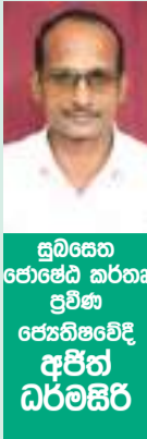
සුබසෙන රෝපේඩ් කර්තෘ ප්‍රවීණ ජෙනරාල්වේදී අජිත් ධර්මසිරි

මේස රවී 18 භාග ඔක් අව විසේනිය ලත් ශනි දින ඉර උදාව 05.57ට ඉර ඔැසීම 06.19ට මුල හැකින උදේ 10.20ත් ගෙවී ප්‍රචණ්ඩ හැකින ලැබේ. ඔක් අව විසේනිය නිවේස සවස 04.49ත් ගෙවී අව සැටවක නිවේස ලැබේ. ශිව ගෝඨය අලුගම 04.42ත් ගෙවී සිද්ධි ගෝඨය ලැබේ. කෙළවර කරණය අලුගම 05.53ත් ගෙවී තෙත්වල කරණය ලබා එය සවස 04.49ත් ගෙවී ගරුප කරණය ලැබේ විම කලාව - ලිංග ගෝති අමන කලාව - ඇස මරු සිටින දිසාව - හැරගෙනහිර ගෝති - දුකුණ - සුම දිසාව - උතුර