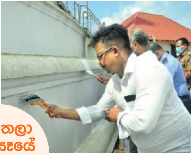
හුණු පිරියම් කිරීමේ ප්‍රජාය කටයුත්තේ අවස්ථාවක්

බරපතල හානියක් මේ රටේ සිදු වෙනවා. එම දේවල් වළක්වා ගැනීමට මහා සංඝරත්නය මැදිහත් වෙලා මහා නායක අනුනායක නාහිමිවරු එකතුවී ත්‍රිපිටක සංරක්ෂණ පනතක් පවා සකස්කර පාර්ලිමේන්තුවේ අනුමත කර ගැනීම සඳහා අවශ්‍ය කටයුතු සංවිධානය කර තිබෙනවා. අපේ සංස්කෘතියට පහර නොදී සංස්කෘතියෙන් ජනතාව ගැලවෙව්වේ නැත්නම් බුදු දහම විනාශ කරන්න බැහැ. මේ වසර දෙදහස් ගණනක් මේ සංස්කෘතිය පවත්වාගෙන ඇවිත් තිබෙන්නේ මේ රටේ ගහට පොත්තට පොත්තට ගහ වගේ අපේ අපේද්වයන් හා සංස්කෘතිය. මේ ඉතිහාසයන් එක්ක තිබෙන බැඳීම නිසයි. සංස්කෘතිය බැඳීම් කඩන්න කුමන්ත්‍රණ කරන්නේ. බොහෝම සුළු පිරිසක් මෙය ප්‍රචාරය කරනවා. ව්‍යාපාරික අපේ ඩබ්ලිව්. සිරිසේන මහතා මෙම කාර්යට ආයතනව සැලසීම උසස් පිංකමක් බවද උන්වහන්සේ වැඩිදුරටත් පැවැසූහ. මිහින්තලය පිළිබඳවත් මෙය කෙබඳු ස්ථානයක්ද යන්න අමුතුවෙන් කිවයුතු නෑ. මිහින්තලය පිළිබඳව සඳහන් කරද්දී කියන්න වෙන්නේ ශ්‍රී ලාංකීය සංස්කෘතියේ නොවීලදු කියලාවත් නිශ්චිතය කියලාවත් නොව ගර්භාභය කියලයි. ශ්‍රී ලාංකීය සංස්කෘතියක් ඇද්ද, බෞද්ධ සංස්කෘතියක් ඇද්ද, සිංහල සංස්කෘතියක් ඇද්ද මේ අවුරුදු දෙදහස් ගණනක ඉතිහාසයට මේ සම-