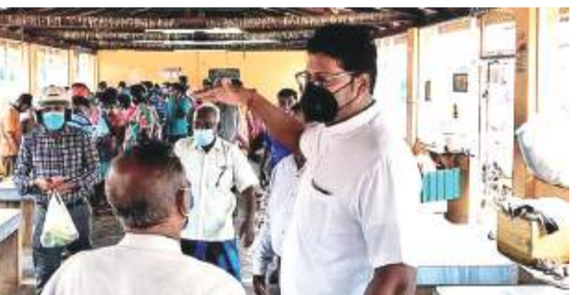
உரையாடி பிரச்சினை தொடர்பில் அறிந்து கொண்டார். மேலதிக நடவடிக்கைகளை முன் எடுப்பதாக முதல்வர் கூறினார்.