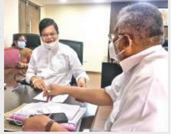
முறையில் தீர்த்து வைக்கப்படும் என்று உறுதியளித்துள்ளன குறிப்பிடத்தக்கது.

அமைச்சர் டக்ளஸ் தேவானந்தாவின் கருத்துக்களை ஏற்றுக் கொண்டு அமைச்சர் பந்துல குணவர்த்தன, முன்னுரிமை அடிப்படையில் வடக்கு வர்த்தகர்களின் அனைத்து எதிர்பார்ப்புகளும் நியாயமான