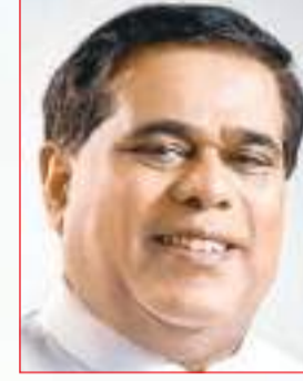
கௌரவ அமைச்சர் சட்டத்தரணி நமால் சிற்பால டி சீவ்லா அவர்கள்

2021 ஆம் ஆண்டிற்காக நான் முன்வைத்த வரவு செலவுத் திட்டத்தில் தோட்ட தொழிலாளர்களுக்கு உறுதி அளிக்கப்பட்ட 1000 ரூபா நாளாந்த சம்பளத்தை பெற்றுக்கொடுப்பதற்கும் அதேபோன்று தொழிலாளர்களின் நலன்களுக்காக ஊழியர் சேமலாப நிதிய சட்டம், கைத்தொழில் பிணக்குச் சட்டம் மற்றும் இழப்பீட்டு கட்டளைச் சட்டம் போன்ற பல தொழிலாளர் சட்டங்களையும் புதுப்பித்ததன் மூலம் தொழிலாளர் உரிமைகளை பாதுகாப்பதற்கு எமது அரசாங்கத்திற்கு முடியுமானதை இட்டு மிக மகிழ்ச்சியடைகிறேன்.