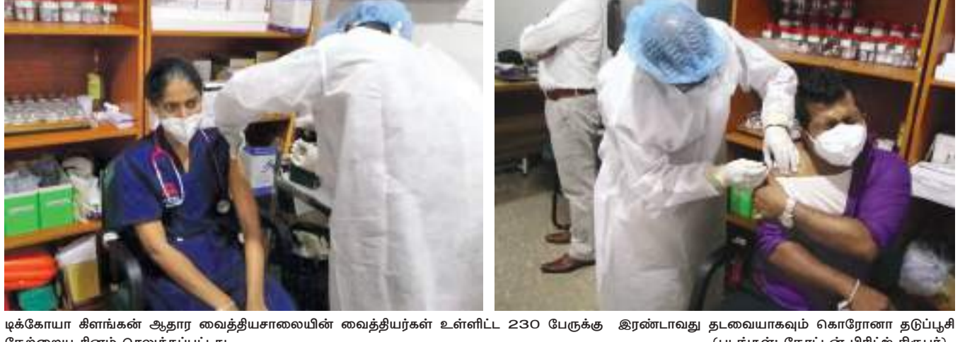
டிக்ஹாயா கிளக்கன் ஆதார வைத்தியசாலையில் வைத்தியர்கள் உள்ளிட 230 பேருக்கு கிரண்டாவது தடவையாகவும் கொரோனா தடுப்பூசி நேற்றைய தினம் செலுத்தப்பட்டது.

களை விற்பனை செய்து கொண்டிருந்ததை அவதானிக்க முடிந்தது. இது இவ்வாறிருக்க மாத்தளை மாவட்டத்தில் 1757 கொவிட் 19 வைரல் தொற்றாளர்கள் உறுதிப்படுத்தப்பட்டிருப்பதுடன்,கடந்த 24 மணி நேரத்தில் புதிதாக 143 பேர் இனங்காணப்பட்டுள்ளனர்,இதனிடையே மாவட்டத்தில் 155 குடும்பங்கள் தனிமைப்படுத்தப்பட்டுள்ளன. மாவட்ட கொவிட் ஒழிப்புக் குழுவினர்; மாத்தளை மாவட்டத்தில் இதுவரை 11 கொரோனா மரணங்கள் ஏற்பட்டுள்ளதாக தெரிவித்தனர்.