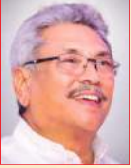
அதிகேது ஜனாதிபதி கோட்டாய ராஜபக்ஷ அவர்கள்