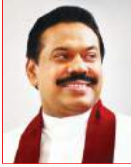
கௌரவ பிரதமர் மஹந்த ராஜபக்ஷ அவர்கள்

(கூட்சத்தின் நோக்கு கொள்கைப் பிரகடனம் 28ஆம் பக்கம்)