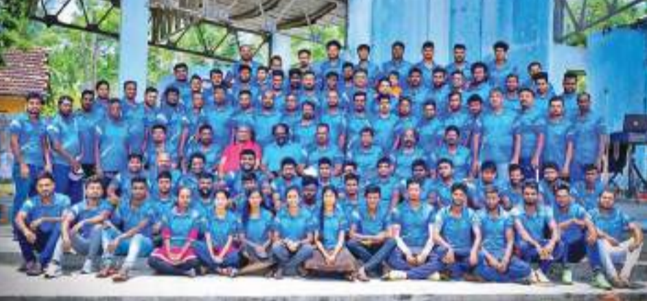
காரைதீவு குழுப் நிருபர்