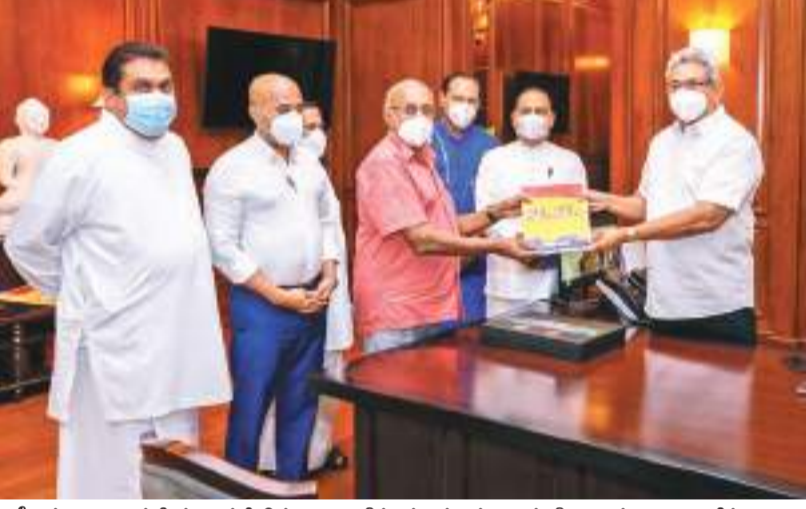
ஸ்ரீலங்கா சுதந்திரக் கட்சியின் தொழிற்சங்கங்கள் ஒன்றிணைந்து தயாரித்த 21 தீர்மானங்களுடனான சர்வதேச தொழிலாளர் தின பிரேரணை நேற்று (30) ஜனாதிபதி கோட்பாய ராஜபக்சுவிடம் கையளிக்கப்பட்டபோது...