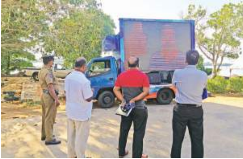
மட்டக்களப்பு மாவட்டம் மக்களை கொவிட் 19 தொற்றிலிருந்து எவ்வாறு பாதுகாத்துக்கொள்வது, கொவிட் தடுப்பு மருந்து ஏற்றுவுதல் ஊடாக நாம் அடையும் நன்மை தொடர்பாகவும் விழிப்புணர்வு

மட்டக்களப்பு மாவட்டத்தை கொரோனா தொற்றிலிருந்து பாதுகாப்பதற்கான பல்வேறுபட்ட விழிப்புணர்வு நடவடிக்கைகள் மாவட்டம் பூராகவும் முன்னெடுக்கப்பட்டு வருகின்றன. மட்டக்களப்பு மாவட்ட கொவிட் 19 தடுப்புச் செயலணியானது மாவட்டம் பூராகவும் பல்வேறுபட்ட நடவடிக்கைகளை அரசாங்க அதிபர் கே.கருணாகரனின் ஆலோசனை மற்றும் வழிகாட்டலில் சுகாதாரத் துறையினரின் பங்களிப்பின் முன்னெடுக்கப்பட்டு வருகின்றது. மட்டக்களப்பு மாவட்ட மக்களை கொவிட் 19 தொற்றிலிருந்து எவ்வாறு பாதுகாத்துக்கொள்வது, கொவிட் தடுப்பு மருந்து ஏற்றுவுதல் ஊடாக நாம் அடையும் நன்மை தொடர்பாகவும் விழிப்புணர்வு