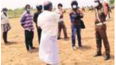
வெளியேற்றினர். சனிக்கிழமை (01) காணிச் சொந்தக்காரர் தனது காணிக்ஞள் வேலிகளை உடைத்து கல்லோயா பெருந்தோட்ட தனியார் கம்பனி

அக்கரைப்பற்று நுரைச்சோலைக் கண்டத்தில் காணிச் செய்கையாளர்களுக்கு தெரியாமல் கல்லோயா பெருந்தோட்ட தனியார் கம்பனி ஊழியர்கள் அத்துமீறிகளும்புச் செய்கைகான நடவடிக்கைகளை கடந்த வெள்ளிக்கிழமை (30) மேற்கொண்டபோது காணிச் சொந்தக்காரர் அவ்விடத்திற்கு வருகை தந்து உழவு இயந்திரங்களை காணிக்ஞள் இருந்து