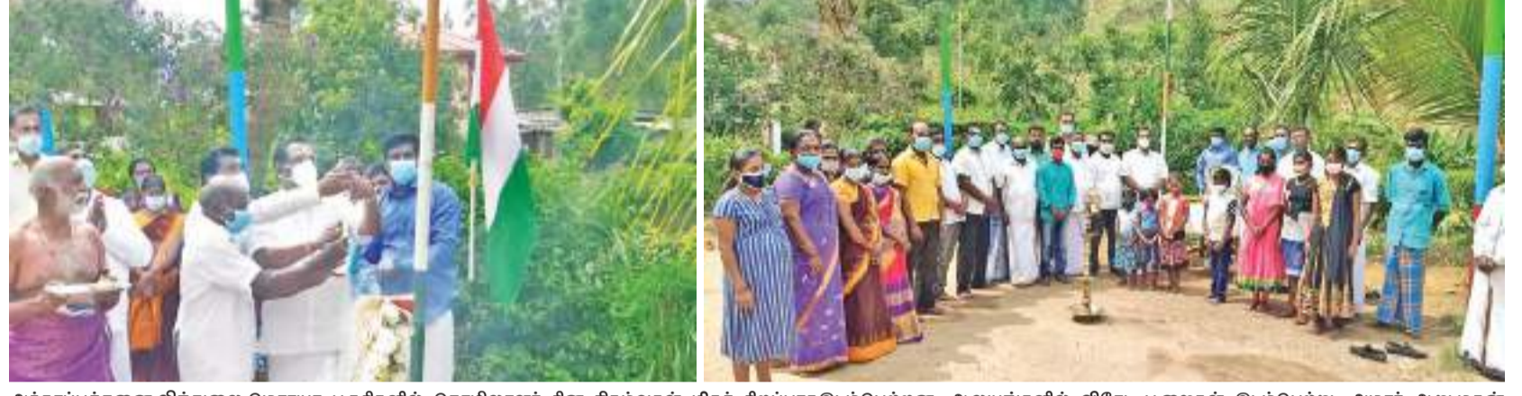
அக்கரப்பத்தலை, விந்துலை, மெரயா பகுதிகளில் தொழிலாளர் தின நிகழ்வுகள் மிகச் சிறப்பாக இடம்பெற்றன. ஆலயங்களில் விசேட பூஜைகள் இடம்பெற்று, அமரர் அறங்களைத் தொண்டமாளின் உருவ படத்திற்கு மலர் மாலை அணிவித்து அஞ்சலியும் செலுத்தப்பட்டது. இந்நிகழ்வில் பங்கேற்ற பலரும் தொழிலாளர் தின வைபவங்களில் கலந்து கொண்டனர். (தலவாக்கலை குறுப் நிருபர்)

சிறுநீரகங்களை வழங்க இரண்டு கொடையாளர்கள் முன்வந்துள்ள நிலையில், அறுவை சிகிச்சைக்கு சுமார் 35 இலட்சத்திற்கும் அதிகமான பணம் செலவாகும் என கணக்கிடப்பட்டுள்ளது. நிதியுதவி வழங்குபவர்கள் தேசிய சேமிப்பு வங்கியில் உள்ள கணக்கு இலக்கமான 10758013198 பணத்தை வைப்பு செய்யுமாறு கோரியுள்ளார். மேலதிக தகவல்களுக்கு 0764232435 என்ற தொலைபேசி இலக்கத்துடன் தொடர்பு கொள்ளுமாறும் அவர் வேண்டுகோள் விடுத்துள்ளார்.