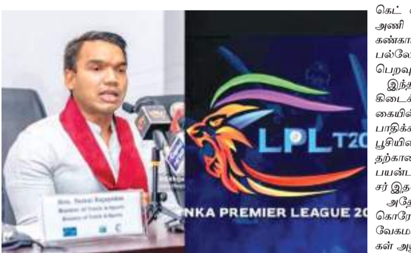
கண்டி மற்றும் கொழும்பில் நடத்துவதற்கு எதிர்பார்த்துள்ளோம். இதற்கான ஆரம்பகட்ட வேலைகளை இலங்கை கிரிக்கெட் சபை முன் நெடுத்து வருகின்றது.