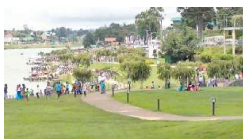
வருவதாகவும் தெரிவிக்கப்படுகின்றது. நுவரெலியா வசந்த கால கொண்டாடங்களில் கடமை புரிந்தவர்களுக்கே கொரோனா தொற்று ஏற்பட்டுள்ளமை தெரிய வந்துள்ளது. இதேவேளை நேற்று கண்டி மாவட்டத்தில் 84 பேருக்கும், நுவரெலியா மாவட்டத்தில் 56 பேருக்கும் கொவிட் தொற்று உறுதிப்படுத்தப்பட்டமை குறிப்பிடத்தக்கது.

நுவரெலியா பொலீஸ் நிலையத்தின் பெண் உப பொலீஸ் பரிசோதகர் மற்றும் போக்குவரத்து பிரிவில் கடமையாற்றும் பொலீஸ் அதிகாரிகள் ஐந்து பேருக்கு கொவிட் தொற்று உறுதிப்படுத்தப்பட்டுள்ளது. இதையடுத்து இவர்கள் கண்டி வைத்தியசாலைக்கு சிகிச்சைக்காக அனுப்பப்பட்டுள்ளதாக நுவரெலியா பொலீஸ் நிலைய பொறுப்பதிகாரி தெரிவித்தார்.