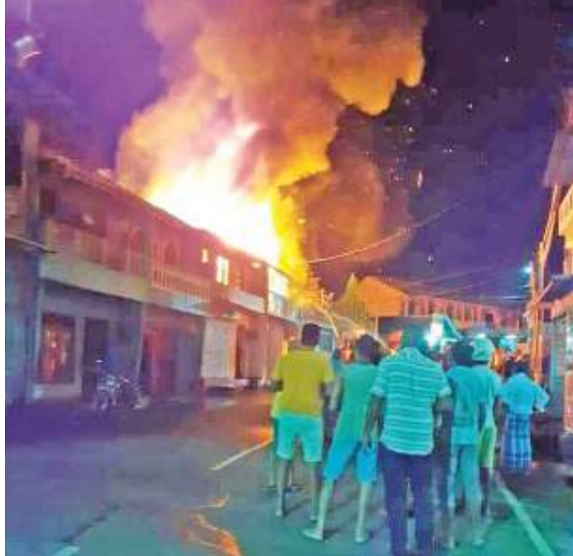
இறக்குவானை பொது பஸ்தரிப்பு நிலையத்திற்கருகில் ஏற்பட்ட திடீர் தீ விபத்தில், இரண்டு கடை தொழிலாளர் மூன்று நபர்கள் இறந்தனர். இது தீ விபத்து நேற்று முன்தினமிரவு (01) இடம்பெற்றது. இச்சம்பவத்தில் எவருக்கும் பாதிப்புக்கள் ஏற்படவில்லை என்பது குறிப்பிடத்தக்கது. (காவல்துறை தினகரன் விசேட நிருபர்)

எவ்வாறாயினும் மக்களுக்கான சேவைகள் தொடர்ந்தும் முன்னெடுக்கப்படுவதாகவும் அந்த பொறுப்பதிகாரி கூறினார். எனினும், பொலீஸ் போக்குவரத்து பிரிவு தற்காலிகமாக மூடப்பட்டுள்ளதாகவும், ஏனைய அதிகாரிகளைக் கொண்டு பணிகள் இடம்பெற்று