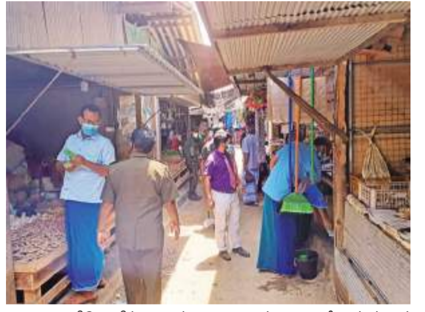
பூரணமாக விடுபடவில்லை என்பதனை மறந்துவிடலாகாது. நாளந்தம் இதன் தாக்கத்திற்குட்பட்ட பலர் இனங்காணப்பட்டுவருவதை ஊடகங்கள் வாயிலாக அறிந்திருந்தும் அதன் ஆபத்தை இன்னும் பலர் அறிந்துகொள்ளாமல் செயற்பட்டு வருவது கவலைக்குரிய விடயமாகவுள்ளது என்றும் குறிப்பிட்டார். நோன்புப் பெருநாள் நெருங்கி வரும் இவ்வேளை மிகவும் அவதானத்துடன் செயற்படுவது அவசியமாகவுள்ளது. இல்லாவிடின் மதம் கூறுகின்ற தொற்று நோய் நடைமுறைகளை சிறந்த முறையில் பின்பற்றி ஒத்துழைப்பு வழங்குவது நாட்டிற்கு வழங்கும் பெரும் பங்களிப்பாகும் என்றார்.