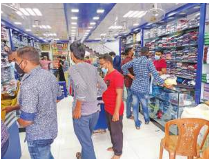
திருகோணமலை மாவட்டத்தில் சில பகுதிகள் முடக்கப்பட்ட நிலையிலும், மக்கள் நகர பகுதிகளில் சென்று தங்களுக்கான நோன்பு பெருநாள் ஆடைகளை கொள்வனவு செய்வதில் ஆர்வத்துடன் ஈடுபட்டுள்ளதை காணலாம்.

மட்டக்களப்பு திருமலை பிரதான வீதியின் நான்கு வழிப்போக்குவரத்தை கொண்ட அபிவிருத்திச் சந்தியில் அடிக்கடி ஏற்படும் வான விபத்துகளை தடுக்க சுற்றுலா அமைக்குமாறு பொது மக்கள் சம்பந்தப்பட்ட அதிகாரிகளிடம் வேண்டி உள்ளனர். இந்நெடுஞ்சாலை பிரதான போக்குவரத்தில் இரு குறுக்கு வீதிகளினாலும் இச்சந்தியை வந்தடையும் வாகனங்கள் பிரதான வீதி வழியாக வரும் வாகனங்களை கண்டு கொள்ள இயலாத நிலையில் இதன் அருகில் பல குடியிருப்புக்கள் காணப்படுகின்றன. இந்நிலையில் இச்சந்தியில் சுற்றுலா அமைப்பதன் மூலம் வேக கட்டுப்பாட்டை சாரதிகள் கடைப்பிடித்து, இடம்பெறும் விபத்துக்களை தடுக்க முடியும் எனவும் பொது மக்கள் கட்டிக்காட்டி உள்ளனர்.