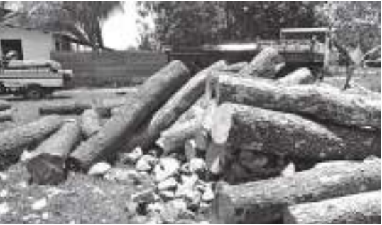
පොලීසිය විපර් රථයේ අයිතිකරු සෙවීමට පරීක්ෂණ ආරම්භ කර තිබේ.

විශේෂ කාර්ය බලකායේ නිලධාරීන්ට ලැබුණු තොරතුරක් මත මුරැත එහි යන විට මුරැත කඳන් පවතින ලද විපර් රථය දමා සැකකරුවන් පලා ගොස් තිබේ. පොලීසි විශේෂ කාර්ය බලකාය විසින් අත්අඩංගුවට ගත් මුරැත කඳන් සහ විපර් රථය වවුනියාවේ ප්‍රදේශයේදී පොලීසි විශේෂ කාර්ය බලකායේ නිලධාරීන් විසින් පෙරේදා (02) අත්අඩංගුවට ගෙන තිබේ.