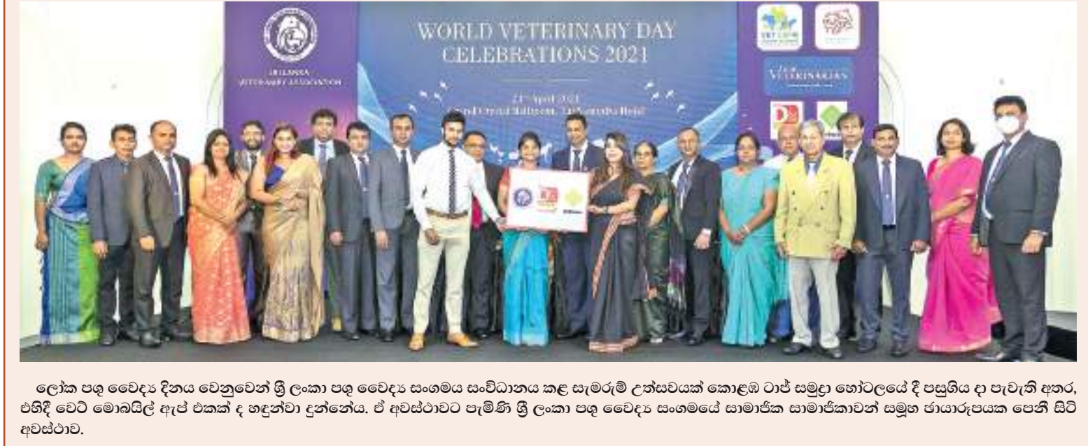
ලෝක පශු වෛද්‍ය දිනය වෙනුවෙන් ශ්‍රී ලංකා පශු වෛද්‍ය සංගමය සංවිධානය කළ සැමරුම් උත්සවයක් කොළඹ ටාට් සමුදා ගෝට්ටයේ දී පසුගිය දා පැවැති අතර, එහිදී වෙට් මොබයිල් ඇප් එක්කර ද හඳුන්වා දුන්නේය. ඒ අවස්ථාවට පැමිණි ශ්‍රී ලංකා පශු වෛද්‍ය සංගමයේ සාමාජික සාමාජිකාවන් සමූහ ජායාරූපයක පෙනී සිටි අවස්ථාව.

පතිරණ මහතා හමුවීම සඳහා අවස්ථාවක් ලබා දෙන මෙන් මැලේසියානු මහකොමසාරිස් හා ඉන්දුනීසියානු තානාපති වෙළෙඳ අමාත්‍යවරයාගෙන් කළ ඉල්ලීමට අනුව ඉදිරියේදී ඒ සඳහා අවස්ථාව සැලසීමට කටයුතු කරන බව අමාත්‍යවරයා මෙහිදී ප්‍රකාශ කළේය.