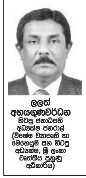
ලලත් අභයගුණවර්ධන හිටපු ජනාධිපති අධ්‍යක්ෂ ජනරාල් (විශේෂ ව්‍යාපෘති හා මෙහෙයුම් සහ හිටපු අධ්‍යක්ෂ, ශ්‍රී ලංකා වෘත්තීය පුහුණු අධිකාරිය)

ප්‍රාසල් සහ විශ්වවිද්‍යාල අධ්‍යාපනයෙන් පසු දැරුවන් යොමු වන්නේ වෘත්තීය අධ්‍යාපනය දෙසටය. වර්තමානයේ වෘත්තීය අධ්‍යාපනය සෑම දැරුවකුටම වඩාත් පලදායී වන්නේ කොරෝනා වසංගතයක් සමඟ