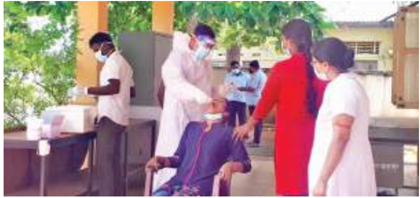
(வவுனியா விசேட நிருபர்)

வவுனியாவில் நோயாளர் காய வண்டி சாரதி ஒருவருக்கு கொரோனா தொற்று ஏற்பட்டதை யடுத்து, அவருடன் தொடர்பைப் பேணிய சுகாதார துறையினருக்கு பிசீஆர் பரிசோதனைகள் மேற்கொள்ளப்பட்டன.