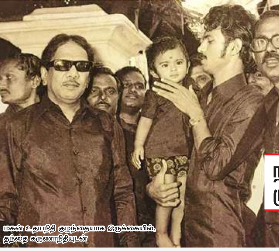
மகன் உதயநிதி குமுந்தையாக இருக்கையில், தந்தை கருணாநிதியுடன்