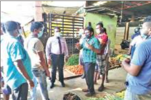
விப்பதற்காக கள் விஜயமொன்றை மேற்கொண்டார். இதன்போது அரசாங்க அதிகாரிகள்