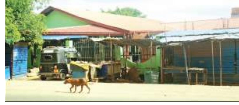
பாண்டிருப்பு தினகரன், மண்டுர் குறாப் நிருபர்கள்

மண்முனை தென் எருவில் பற்று கருவாஞ்சிகுடி பிராந்திய சுகாதாரப் பணிமனைக்குட்பட்ட பிரதேசங்களில் இயங்கும் பொதுச்சந்தைகள் அனைத்தும் மூன்று நாட்களுக்கு மூடப்பட்டிருக்கும் என கருவாஞ்சிகுடி பிராந்திய சுகாதாரப் பணிமனை தெரிவித்துள்ளது. இதற்கிணங்க நேற்று செவ்வாய்க் கிழமை தொடக்கம் பொதுச்சந்தை இயங்கவில்லை. பிரதேசத்தில் பொது