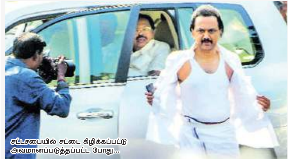
சுப்சபையில் சட்டை கிழிக்கப்பட்டு அவமானப்படுத்தப்பட்ட போது...