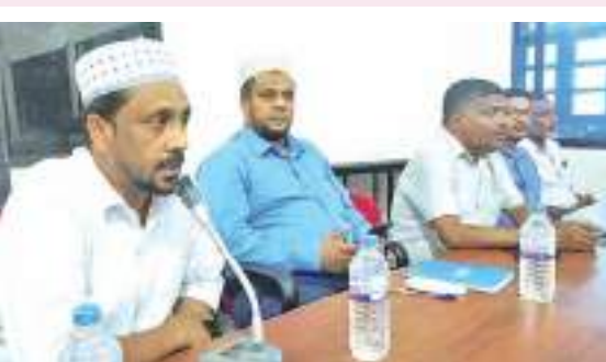
(அட்டாணைச்சேனை விசேட நிருபர்)