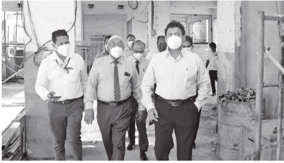
சுகாதார அமைச்சின் கு. 743 மில்லியன் செலவில் நிர்மாணிக்கப்படும் இக்கட்டிடம் 10 தளங்களைக் கொண்டுள்ளது.

இந்தப் பின்புலத்தில் சுகாதார அறிவுறுத்தல்களை சரியான முறையில் பின்பற்றி பொருத்தமான செயல்பாட்டு முறைமையின் கீழ், களுபோவில் வைத்தியசாலையில் நிர்மாணிக்கப்பட்டு வரும் களுபோவில் போதனா வைத்தியசாலையின் மில்லனியம் விடுதி வளாகம் மற்றும் வெளிநோயாளர் பிரிவின் நிர்மாணப் பணிகள் விரைவாக நிறைவு செய்யப்பட்டு சுகாதார அமைச்சிடம் கையளிப்பும்.