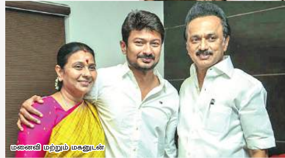
மனைவி மற்றும் மகனுடன்