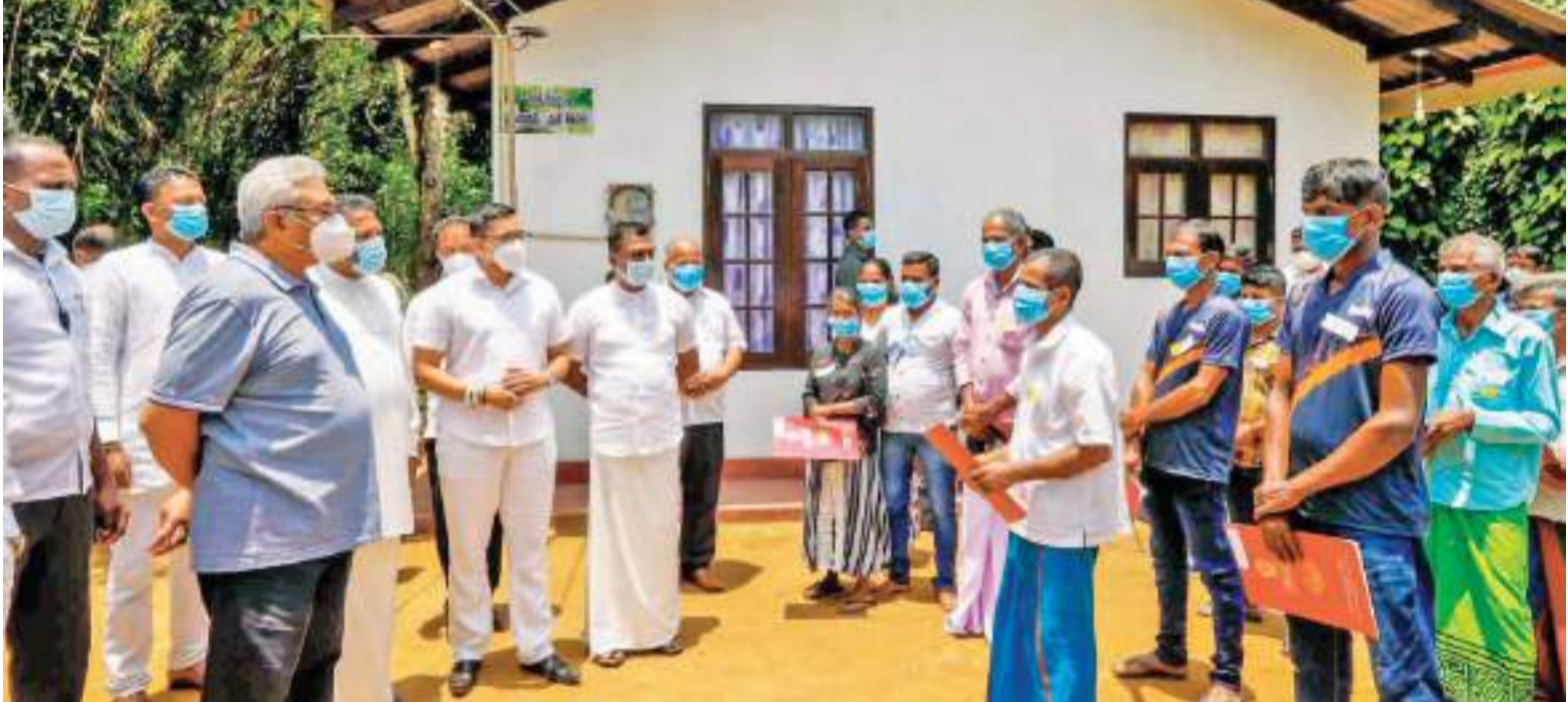
බව පසක් කළේ මෙසේය. 'ඇත ඉදන් අත වනලා අම්මේ මට ගමට එන්න පාර කියා-පන්නේ' යනුවෙනි.

මට බොහෝදෙනා දක්වන්නේ අසීමිත ආදරයකි; එසේම ගෞරවයකි. උපන් දේශයට ආදරය කරන කවර හෝ පුද්ගලයෙකු සිය උපන් ගමට ආදරය දක්වන්නේ මවට, පියාට මෙනි. බුදුන් වහන්සේ පවා කිසිදුමටින් හමන සුළඟ පවා මට සුවදායක යැයි විශ්වාස පැවසූ බව අසා ඇත.