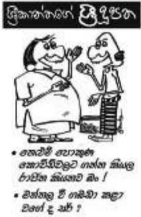
• නොවැනි ආරක්ෂණ කොමිෂියන්වලට ගාස්තු සියලුම ජාතික බවට බැර ! • වත්තල වි ගැනීම කළු වරක් ද බැර ?

පසුගිය කාලයේ සිදු වූ අපරාධ රැසක් සම්බන්ධයෙන් ද පොලීසියට අවශ්‍ය කර සිටි සැකකරුවෙකි. සැකකරු අධිකරණයට ඉදිරිපත් කිරීමෙන් අනතුරුව රක්ෂණ බන්ධනාගාරගත කර නිබේ. මට්ටම්කරු ලෙස පොලීසිය වැඩිදුර විමර්ශන සිදු කරයි.