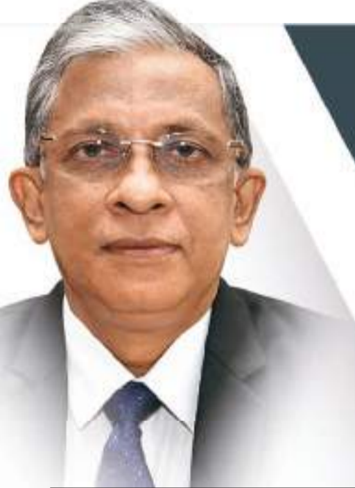
සෞඛ්‍ය සේවා අධ්‍යක්ෂ ජෙනරාල්