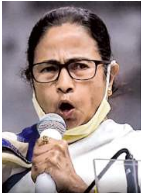
බටහිර බෙංගාලය බෙනර්ජි