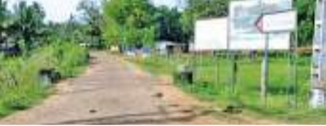
හුදෙකලා කිරීම නිසා එහි වැඩියෙන් විශාල පිරිසකට අත්වැරදීම හා අනවබෝධීතාව මඟින් වැඩි වූ බව මවුන් පළාතේ මහජන සෞඛ්‍ය පරීක්ෂකවරයා දැනුම් දී ඇති අතර සෞඛ්‍ය අංශ මාර්ගයේ මේ වටුනියාවේ පහසුකම් සැපයීමට විශේෂ වැඩපිළිවෙලක් ක්‍රියාත්මක කර තිබේ.

උතුරු පළාත් විශේෂ රක්ෂක දිවියේ වටුනියාවේ පුරවැසිකුලම් කුරුකකලපුදකුලම් ගම්මානය හුදෙකලා කිරීමෙන් පසුව එම ගම්මානයෙන් කොරෝනා රෝගීන් 7ක් පෙරේදා (05) හමු වී තිබේ. මේ ගම්මානයෙන් ඊට පෙර ආසාදිතයන් 11ක් හමු වූ අතර ඉන් පසුව පී.සී.ආර්.පර්ක්ෂණ 128ක් සිදු කොට ගම්මානය හුදෙකලා කිරීමට සෞඛ්‍ය බලධාරීන් පියවර ගෙන තිබුණි. කුරුකකලපුදකුලම් ගම්මානය හදිසියේම