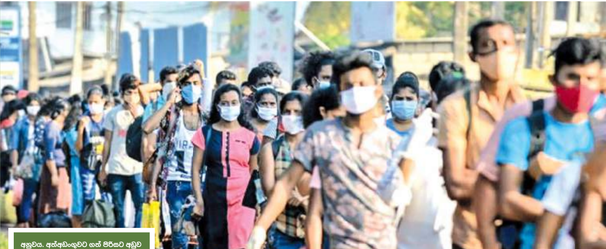
අනුවය. අන්වර්ගයට ගත් පිරිසට අඩුව තිබුණේ 'අං' පමණකි.

බම්බලපිටියේ මිලාගිරිය පවුමගේ රාත්‍රි සමාජ ශාලාවක් වැටලීමට පොලිසියට සිදු වූයේ 03 වැනිදා රාත්‍රියේය. ඒ නිරෝධායන නීති රීති උල්ලංඝනය කරමින් සුපිරි සාදයක් පවත්වද්දීය. පුරපි නිරූපණ ශිල්පීන් විසිපහක් ඇතුළු පිරිසක් පොලිස් අන්වර්ගයට පත් වූයේ ඒ