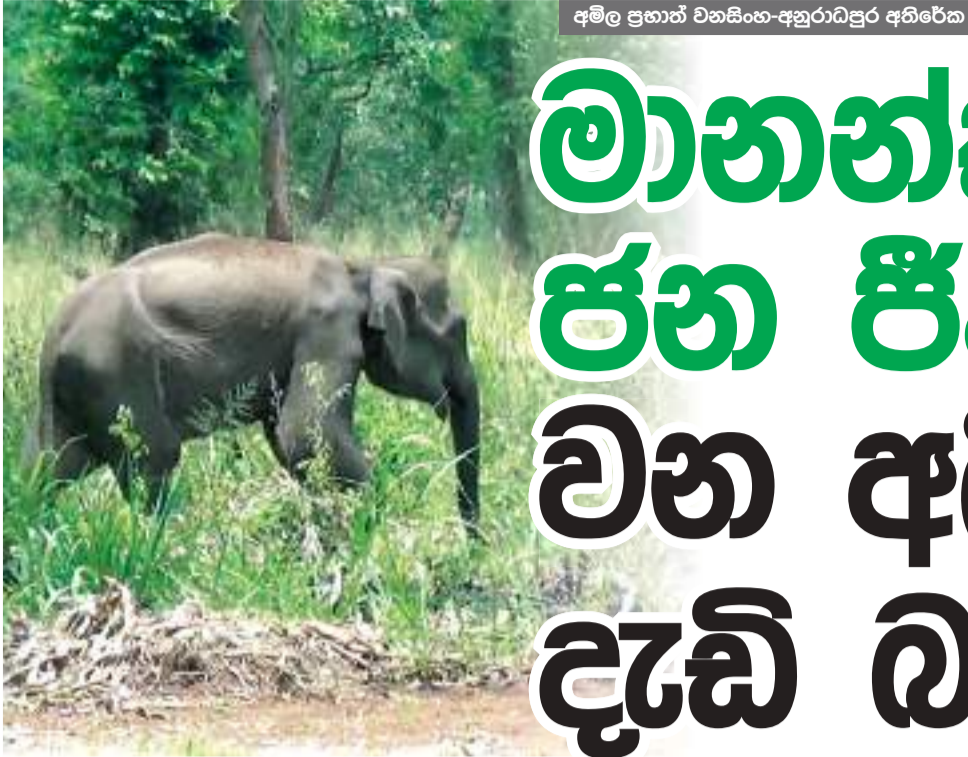
අම්ල ප්‍රභාත් වනසිංහ-අනුරාධපුර අභිරේක