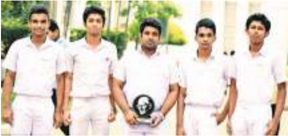
තාරකා විද්‍යා සංගමයේ මිතුරන් සමඟ

ඉන් නොනැවතුණු ඔහු 2019 වසරේදී රුමේනියාවේ පැවති අන්තර්ජාතික තාරකා විද්‍යා මලිම්පියාඩ් තරගාවලියට සහභාගි වී ඇගයීමේ සහතිකයක් දිනා ගැනීමට ව්‍යාපාරිකව ප්‍රවිණ කොරෝනා වසංගතය හමුවේ ඔහුට එම අධ්‍යයනවලට නිත නැඹීමට සිදුවී ඇත. අයගම ප්‍රාදේශීය ලේකම් කාර්යාලයේ සංවර්ධන නිලධාරීවරයකු ලෙස කටයුතු කරන, ඔහුගේ පියා වන කේ. ඩබ්. එස් රත්නප්‍රිය මහතාගෙන් හා කීර්ඤ්‍යාලල ප්‍රාදේශීය ලේකම් කාර්යාලයේ සංවර්ධන නිලධාරීවරයකු ලෙස කටයුතු කරන, ඔහුගේ පියා වන කේ. ඩබ්. එස් රත්නප්‍රිය මහතාගෙන් හා කීර්ඤ්‍යාලල ප්‍රාදේශීය ලේකම් කාර්යාලයේ සංවර්ධන නිලධාරීවරයකු ලෙස කටයුතු කරන දයානි කුමාර මව ගෙන් නමාගේ අධ්‍යාපන කටයුතුවලට විශාල සහායක් ලැබෙන බව අකලංක රත්නප්‍රිය සිසුවා