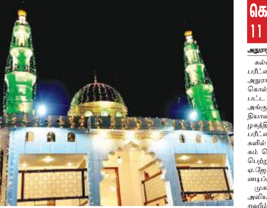
பேருவளை மாலிகாசேனையைச் சேர்ந்த பெயர் குறிப்பிட விரும்பாத பிரபல மாணிக்க வர்த்தகர் ஒருவரின் நிதி உதவி மூலம் பேருவளை மஸ்ஜை சமீப மாவட்டத்தில் உள்ள ஷாதுலிய்யா ஸாவிய்யா புனர்நிர்மாணம் செய்யப்பட்டு அண்மையில் திறந்துவைக்கப்பட்டது. ஸாவிய்யாவின் அழகிய தோற்றத்தை படத்தில் காணலாம்.

மான வியாபார நிலையங்களும் மூடப்பட்டுள்ளன. அத்தோடு மாவட்டத்திலுள்ள சகல வாராந்த சந்தைகளையும் மூடுவதற்கு பிரதேச உள்ளராட்சி மன்றங்கள் நடவடிக்கை எடுத்துள்ளதால், கிராமிய விவசாயிகள் தங்களது விவசாய உற்பத்திகளை விற்பனை செய்ய முடியாத நிலையில் உள்ளனர். மேலும் பொது மக்களும் தங்களது தேவையான மரக்கறி வகைகளை பெறுவதில் பல்வேறு சிரமங்களுக்கு முகம்கொடுத்துள்ளனர். கொவிட் 19 கொரோனா தொற்றின் காரணமாக ஹம்பாந்தோட்டை மாவட்ட மக்களது பொருளாதார நிலைமையும் வெகுவாகப் பாதிக்கப்பட்டுள்ளது.