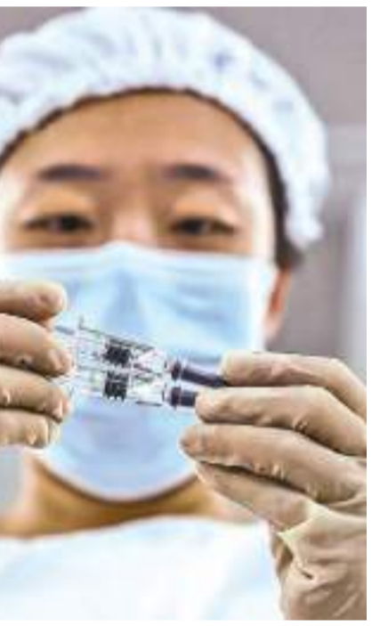
சர்வதேச அளவில் வழங்கப்பட்டு இருந்ததால் சீன தடுப்பூசியின் செயல்விரியம் நீண்டகாலமாக உறுதியாகத் தெரியாமலே இருந்தது. சீனோபாரம் நிறுவனம் தயாரித்த தடுப்பூசியின் பாதுகாப்பு, செயல்விரியம் மற்றும் தரம் ஆகியவற்றை தாங்கள் பரிசோதித்து கண்டறிந்துள்ளதாக உலக சுகாதார அமைப்பு தெரிவித்துள்ளது. 18 அல்லது அதற்கு அதிகமான வயதுடையவர்களுக்கு இந்த தடுப்பூசியை இரண்டு டோஸ்களாக வழங்கவும் உலக சுகாதார அமைப்பு பரிந்துரைத்துள்ளது.

சீன அரசுக்கு சொந்தமான சீனோபாரம் நிறுவனம் தயாரித்த கொவிட்-19 தடுப்பூசிக்கு உலக சுகாதார அமைப்பு அவசர காலப் பயன்பாட்டு அனுமதி வழங்கியுள்ளது. மேற்கத்திய நாடு ஒன்றால் தயாரிக்கப்படாத தடுப்பூசி ஒன்று உலக சுகாதார அமைப்பின் அங்கீகாரத்தை பெறுவது இதுவே முதல் முறையாகும். சீனாவிலும் நோடுகளிலும் இந்த தடுப்பூசி ஏற்கனவே கோடிக்கணக்கான மக்களுக்கு வழங்கப்பட்டுள்ளது. இதற்கு முன்னதாக பைசர், அஸ்த்ராசெனிக்கா, ஜோன்சன் அன்ட் ஜோன்சன் மற்றும் மொடர்னா ஆகிய தடுப்பூசிகளின் பயன்பாட்டுக்கு மட்டுமே உலக சுகாதார அமைப்பு ஒப்புதல் அளித்திருந்தது. ஆனால் பல நாடுகளில், குறிப்பாக ஆபிரிக்கா, லத்தீன் அமெரிக்கா, ஆசியா போன்ற பகுதிகளில் உள்ள சில ஏழை நாடுகளில் மருத்துவ ஒழுங்காற்று அமைப்புகள் சீனோபாரம் தடுப்பூசியின் அவசரகால பயன்பாட்டுக்கு அனுமதி வழங்கியிருந்தன. முன்னதாக குறைவான தரவுகளை