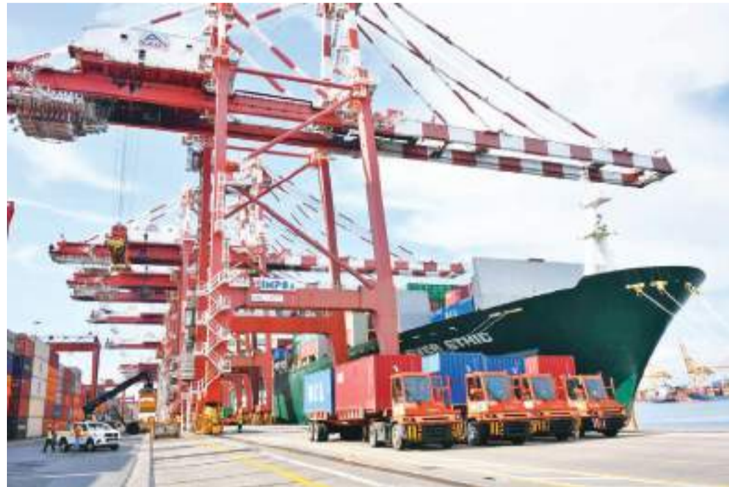
புற்றுநோயை ஏற்படுத்தக் கூடிய இரசாயன பதார்த்தம் கலக்கப்பட்டு இறக்குமதி செய்யப்பட்ட தேங்காய் எண்ணெய் மீண்டும் அந்த நாட்டுக்கே திரும்பி அனுப்பப்பட்டன. 230 மெற்றிக்டொன் அடங்கிய தேங்காய் எண்ணெய் 12 கொள்கலன்களும் துறைமுகத்தில் கப்பலுக்கு ஏற்றப்பட்டபோது.

கொரோனா வைரஸ் பரவல் கட்டுப்படுத்தல் நடவடிக்கைகளுக்காக தேற்று வரை நூற்றுக்கும் மேற்பட்ட கிராம சேவை உத்தியோகத்தர் பிரிவுகள் தனிமைப்படுத்தலுக்காக முடக்கப்பட்டுள்ளன. தேற்றும் 21 கிராம சேவகர் பிரிவுகள் தனிமைப்படுத்தலுக்காக 06