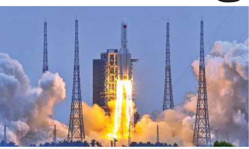
அமெரிக்க விண்வெளி கட்டணை கம் வெளியிட்ட அறிவிப்பில் கூறப்பட்டது. இந்த ரொக்கெட் பூமியை நோக்கி வரும் நிலையில் அதன் பாகங்கள் மக்கள் வாழும் பகுதியில் விழும் அச்சம் இருந்து வந்தது. பூமியின் சுற்று வட்டப்பாதையில் இருந்து ரொக்கெட்டை பூமியை நோக்கி விழுவதற்கு விடுவதில் சீனா அலட்சியமாக இருப்பதாக அமெரிக்க பாதுகாப்பு

கட்டுப்பாட்டை இழந்து பூமியின் வளிமண்டலத்திற்கு திரும்பிய சீனாவின் இராட்சத ரொக்கெட் சிதைவுண்டு இந்திய பெருங்கடல் பகுதியில் விழுந்ததாக சீனா தெரிவித்துள்ளது. பூமிக்கு திரும்பும்போது இந்த ரொக்கெட்டின் பெரும்பகுதி அழிந்த நிலையில் எஞ்சிய பாகங்களே கடலில் விழுந்து விழுந்ததாக சீனாவின் அரசு ஊடகம் நேற்று செய்தி வெளியிட்டது. அதன் பாகங்கள் மானைத் தவிர மேற்காகவே விழுந்துள்ளன. கட்டுப்பாட்டை இழந்த லோங் மார்ச்சி என்ற இந்த வாகனம் விழுந்த இடம் பற்றி அமெரிக்கா மற்றும் ஐரோப்பாவும் கண்காணித்து வருகிறது. பீஜிங் நேரப்படி நேற்று குரூயிற்றுக் கிழமை 10.24 மணி அளவிலேயே இந்த ரொக்கெட் பூமியை நோக்கி விழுந்ததாக சீன அரசு ஊடகம் தெரிவித்தது. 'அரேபிய தீபகற்பத்திற்கு மேலால் லோங் மார்ச்சி ரொக்கெட் பூமியின் வளிமண்டலத்திற்கு மீண்டும் திரும்பியது உறுதி செய்யப்பட்டது' என்று