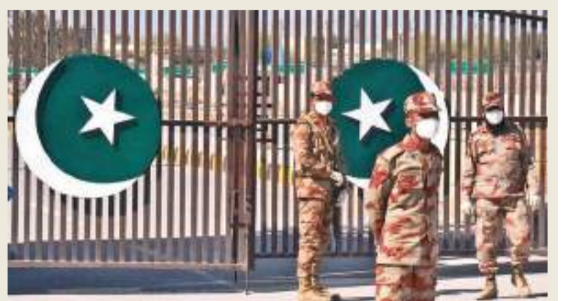
தொற்று அதிகரித்து வருகிறது. அங்கு வைரஸ் 6 ஆம் திகதி தொடக்கம் தேசிய அளவில் பொது முடக்கம் அடங்குபடுத்தப்பட்ட நிலையில் அது வரும் மே மாதம் வரை நீடிக்கப்பட்டுள்ளது. பாகிஸ்தானிலும் நோய்த் தொற்று மற்றும் உயிரிழப்பு வெகமாக உயர்ந்துள்ளது. இதனால் அங்கு சுகாதார சேவை நிலைகுலையும் அச்சம் உருவாகியுள்ளது. அங்கு முடக்க நிலை இல்லாதபோதும் சில மாகாணங்களில் கட்டுப்பாடுகள் கொண்டுவரப்பட்டு முக்கிய வசம் கட்டாயமாக்கப்பட்டுள்ளது. நாட்டின் எல்லைகளும் மூடப்பட்டுள்ளன. இலங்கையிலும் ஏப்ரல் நடுப்பகுதியில் திடீரென நோய் தொற்று எண்ணிக்கை அதிகரித்ததை அடுத்து கட்டுப்பாடுகள் கொண்டுவரப்பட்டுள்ளமை குறிப்பிடத்தக்கது. குறிப்பாக இந்திய வைரஸ் கிடைக்கும் பாதுகாப்பை மீறிப் பரவி வரக்கூடும் என உலக சுகாதார அமைப்பின் தலைமை விஞ்ஞானி சௌமயா சுவாமிநாதன் கூறியுள்ளார்.

இந்தியாவில் கொரோனா தொற்று தீவிரம் அடைந்து அதனை கட்டுப்படுத்த போராடி வரும் நிலையில் அண்டைய நாடுகளிலும் நோய்த் தொற்று அதிகரித்து வருகிறது. கடந்த மார்ச் மாதம் தொடக்கம் இந்தியாவில் தினசரி நோய்த் தொற்று மற்றும் உயிரிழப்பு எண்ணிக்கை கட்டுக்கடங்காது அதிகரித்து வருகிறது. இந்த சூழலில் இந்தியாவின் நெருங்கிய அண்டை நாடுகளிலும் நிலைமை மோசமடைந்து வருகிறது. இதில் நோயாளம் மீதான கவலை அதிகரித்துள்ளது. அங்கு ஏப்ரல் மாதம் தொடக்கம் நோய்த் தொற்று வேகமாக உயர்ந்து கொரோனா சோதனைக்கு உள்ளாகுபவர்களில் 40 வீதமானவர்களுக்கு வைரஸ் தொற்றி இருப்பது அடையாளம் காணப்பட்டு வருகிறது. நேபாளம் இந்தியாவுடன் 1,880 கிலோமீற்றர் நில எல்லையை பகிர்ந்து கொள்ளும் நிலையில் இரு நாட்டு மக்களும் வர்த்தகம், சுற்றுலா மற்றும் குடும்ப காரணங்களுக்காக கட்டுப்பாடுகள் இன்றி எல்லையை கடந்து வருகின்றனர். இந்தியா சென்று திரும்பிய நேபாளத்தின் முன்னாள் மன்னர் கயேந்திர ராவுக்கும் நோய்த் தொற்று ஏற்பட்டிருப்பது உறுதி செய்யப்பட்டுள்ளது. பங்களாதேஷிலும் கடந்த மார்ச் ஆரம்பம் தொடக்கம் நோய்த்