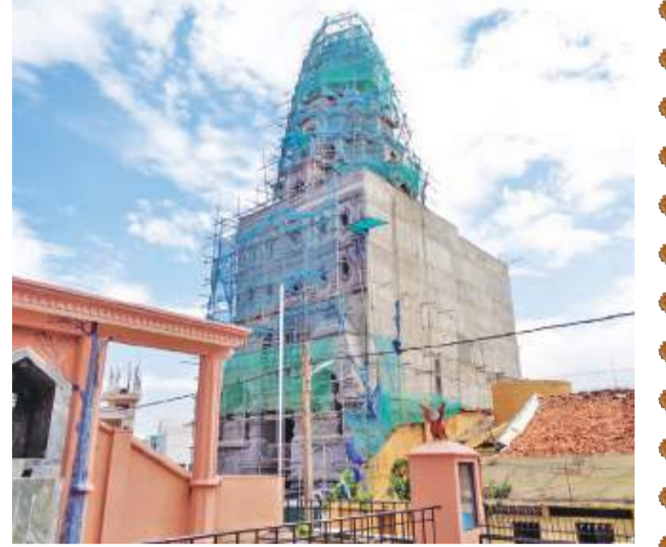
கொழும்பு மாநகரில் மிக உயரமான விமான போடரத்தைக் கொண்டதாக நிர்மாணிக்கப்பட்டுவரும் கொழும்பு- 13 புதுச் செட்டித்தெரு ஸ்ரீ ஸ்ரீ கிராதாசீருஷ்ணர் ஆலயத்தின் அழகிய தோற்றத்தைப் படத்தில் காணலாம்.