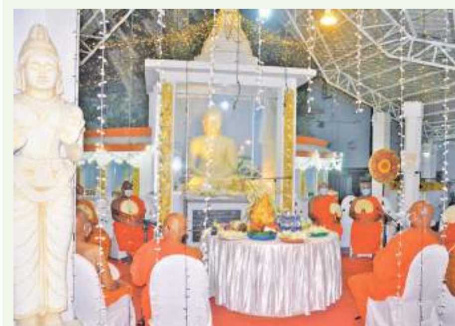
இலங்கை ஒலிபரப்புக் கூட்டுத்தாபனத்தில் நடைபெற்ற மத அனுஷ்டானங்களின் போது.