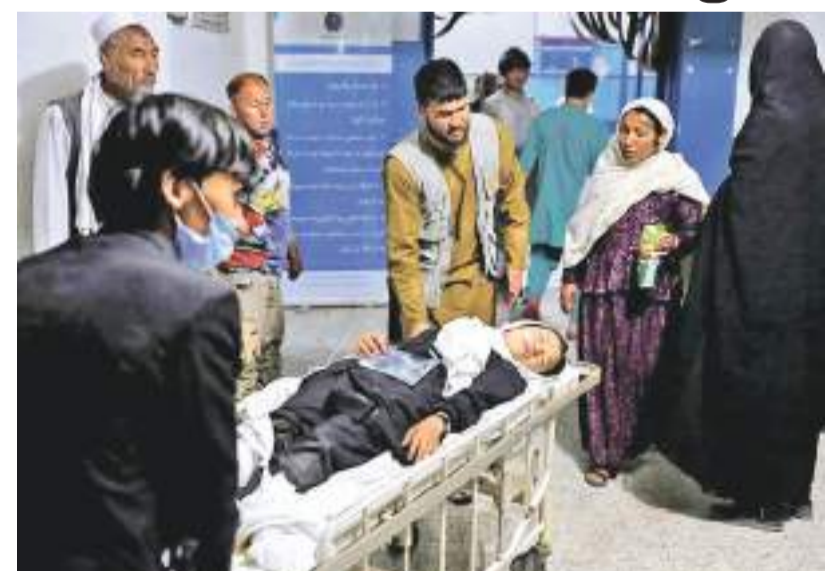
ஆப்கான் ஜனாதிபதி அஷ்ரப் காணி இந்தத் தாக்குதலுக்கு தலிபான் கள் மீது குற்றம்சாட்டியபோதும், இதில் தமக்கு தொடர்பு இல்லை என்று தலிபான் பேச்சாளர் மறுத்திருப்பதோடு ஆப்கான் பொதுமக்கள் மீதான எந்த ஒரு தாக்குதலையும் அந்த அமைப்பு கண்டித்துள்ளது. தற்போதை போர் மற்றும் வன்முறையை தடுக்க தவறி இருப்பது குறித்து ஆப்கான் அரசு மற்றும் மேற்குலக சக்திகள் மீது பாதிக்கப்பட்டவர்களின் குடும்பத்தினர் குற்றம்சுமத்தியுள்ளனர். பாதிக்கப்பட்டவர்களை அடக்கம் செய்வதற்காக நேற்றைய தினத்திலும் பிரதே அறையில் இருந்து உடல்கள் பெறப்பட்டு வரும் அதேநேரம், சில குடும்பத்தினர் காணாமல்போனவர்களை தொடர்ந்து தேடி வருகின்றனர். ஆப்கானில் வன்முறைகள் அதிகரித்திருக்கும் சூழலில் வரும் செப்டெம்பர் 11 ஆம் திகதி அமெரிக்க துருப்புக்கள் ஆப்கானில் இருந்து முழுமையாக வெளியேறும் அறிவிப்பை வெளியிட்டிருக்கும் நிலையிலேயே இந்தத் தாக்குதல் இடம்பெற்றுள்ளமை குறிப்பிடத்தக்கது.

ஆப்கானிஸ்தான் தலைநகர் காபுலின் பாடசாலை ஒன்றுக்கு அருகில் இடம்பெற்ற குண்டு வெடிப்பில் உயிரிழந்தவர்கள் எண்ணிக்கை 58 ஆக அதிகரித்திருப்பதோடு காயமடைந்த குறைந்தது 150 பேருக்கு மருத்துவ சிகிச்சை அளிப்பதில் மருத்துவர்கள் போராடி வருகின்றனர். ஷியா முஸ்லிம்கள் வாழும் டாஷ்டே பார்கி பகுதியில் கடந்த சனிக்கிழமை மாலை இடம்பெற்ற இந்த குண்டு வெடிப்பு அந்தப் பகுதியை அதிர்ச்சி செய்தது. ஆப்கானின் மதச் சிறுபான்மையினராக இருந்த இந்த சமூகத்தை இலக்கு வைத்து கடந்த காலங்களில் இஸ்லாமிய அரசுக் குழு மற்றும் கன்னி முஸ்லிம் போராட்டக் குழுக்கள் தாக்குதல் நடத்தி உள்ளமை குறிப்பிடத்தக்கது. கார் குண்டு மற்றும் அந்தப் பகுதியில் வைக்கப்பட்ட இரு குண்டுகளால் இந்த வெடிப்புகள் இடம்பெற்றிருப்பதாக நம்பப்படுகிறது. இதில் கற்றலை முடித்து விட்டு வீடு திரும்பும் ஏழு அல்லது எட்டு சிறுமிகள் கொல்லப்பட்டவர்களில் இருப்பதாக பார்த்தவர் ஒருவர் ரோய்ட்டர்ஸ் செய்தி நிறுவனத்திற்கு தெரிவித்துள்ளார். அதேபோன்று இந்தத் தாக்குதலில் பல பெண்களும் பாதிக்கப்பட்டிருப்பதாக அங்கிருந்து வரும் செய்திகள் தெரிவிக்கின்றன.