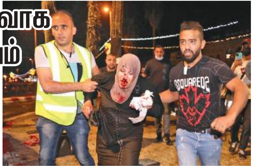
இந்நிலையில் கிழக்கு ஜெருசலத்தின் செய்க் ஜெர்ரா மாவட்டத்தைச் சேர்ந்த பலஸ்தீன குடும்பங்களை அங்கிருந்து வெளியேற்றுவதற்கு இஸ்ரேல் முயற்சிப்பதே அண்மைய பதற்றம் அதிகரிப்பதற்கு காரணமாகும். இந்த முயற்சியை இஸ்ரேல் கைவிட வேண்டும் என்று ஐ.நா வலியுறுத்துவதோடு ஆர்ப்பாட்டக்காரர்களுக்கு எதிராக பலப்படு ரோகத்தை பயன்படுத்துவதில் கட்டுப்பாட்டை பேண வேண்டும் என்று கேட்டுக் கொண்டுள்ளது. வலுக்கட்டாயமான வெயியேற்றத்தை தடுக்க சர்வதேச சமூகம் தலையிட வேண்டும் என்று அரபு லீக் நாடுகள் அமைப்பு விடுத்துள்ளது. இது தொடர்பில் நீண்ட காலமாக நீடிக்கும் சட்டப் பிரச்சினை குறித்து இஸ்ரேலிய உச்ச நீதிமன்றம் இன்று விசாரணை நடத்தவுள்ளமை குறிப்பிடத்தக்கது.

பெற்ற மோசமான சம்பவமாக தற்போதைய மோதல் உள்ளது. இங்கு வன்முறை அதிகரித்திருப்பது குறித்து மத்திய கிழக்கு பேச்சுவார்த்தையாளர்கள், அமெரிக்கா, ஐரோப்பிய ஒன்றியம், ரஷ்யா மற்றும் ஐ.நா கவலை வெளியிட்டுள்ளனர். இதேநேரம் ஹமாஸ் அமைப்பின் கட்டுப்பாட்டில் இருக்கும் காசா பகுதியில் இருந்து கடந்த சனிக்கிழமை இஸ்ரேலை நோக்கி ரொக்கெட் குண்டுகள் வீசப்பட்டதாக இஸ்ரேல் இராணுவம் குறிப்பிட்டுள்ளது. 'இதற்கு பதில் நடவடிக்கையாக எமது போர் விமானங்கள் தெற்கு காசாவில் ஹமாஸ் இராணுவ முகாம் ஒன்றின் மீது தாக்குதல் நடத்தியது' என்று இஸ்ரேல் பாதுகாப்பு படை விட்டில் குறிப்பிட்டுள்ளது. 1967 மத்திய கிழக்கு போர் தொடக்கம் கிழக்கு ஜெருசலம் இஸ்ரேலிய ஆக்கிரமிப்பில் உள்ளது. ஜெருசலம் முழுவதையும் தமது தலைநகராக இஸ்ரேல் அறிவித்தபோதும் அதிகப் பெரும்பான்மையான சர்வதேச சமூகம் அதனை அங்கீகரிக்கவில்லை.