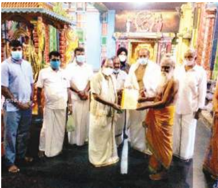
கொரோனா அபாயம் நீங்கவேண்டி யாழ். கீரிமலை நகுலேஸ்வரம் மற்றும் மாவிட்டபுரம் கந்தகவாமி ஆலயம் ஆகியவற்றில் சிறப்பு வழிபாடு நடத்தப்பட்டுள்ளது. குறித்த வழிபாடுகளில் அரசியல் கட்சிகளின் தலைவர்கள், அரசியல் பிரதிநிதிகள் மற்றும் யாழ். இந்தியத் துணைத் தூதுவர் உள்ளிட்டோர் பங்கேற்றிருந்தனர். வழிபாடுகளின் நிறைவில் இந்திய மக்களைப் பிராத்தித்து அந்த நாட்டுப் பிரதமருக்கான கடிதங்கள் இந்தியத் துணைத் தூதுவரிடம் கையளிக்கப்பட்டது.