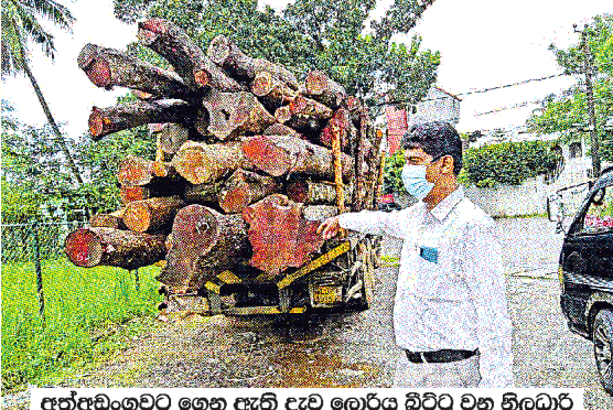
අත්අඩංගුවට ගෙන ඇති දැව ලොරිය බිටුව වන නිලධාරීන්ගේ මහතා පෙන්වා දෙමින් අවස්ථාව

(වාරණ ආහන්ද ඉ. ජයකොඩි) රුසියාලු ලක්ෂ ගණනක් වටිනා කොස් හා මහෝනි දැව කැපෑ හැක්කා හටියක් බලපත්‍ර රහිතව පටවාගෙන පැමිණි ලොරියක් අත්අඩංගුවට ගැනීමට හැකි වූ බව පස්සාල දැව පරීක්ෂණ මධ්‍යස්ථානය පවසයි.