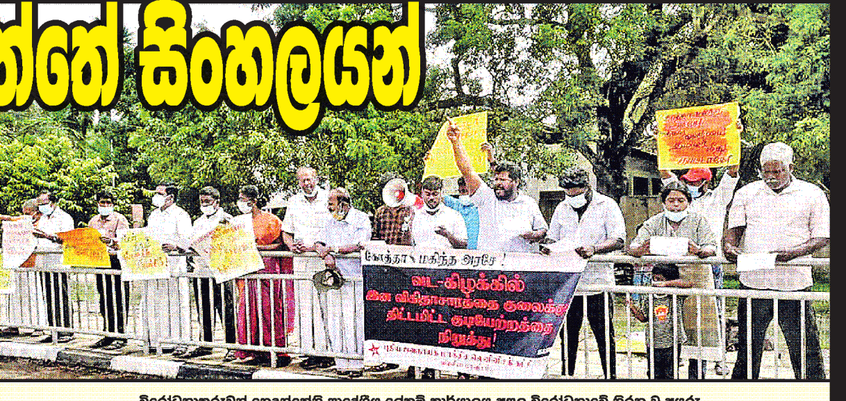
විරෝධතාකරුවන් හෙදන්කේනි ප්‍රාදේශීය ලේකම් කාර්යාලය අසල විරෝධතාවේ නිරත වූ අයුරු.

වවුනියාව දිස්ත්‍රික් ලේකම් කාර්යාලය මේ සම්බන්ධයෙන් දිනින් දිනටම සාකච්චා සිදු කරන අතර මෙම ජනතාව හෙදන්කේනි ප්‍රාදේශීය ලේකම් කොට්ඨාසය යටතට එක් නොකරන ලෙස දිස්ත්‍රික් ලේකම්වරයාගෙන් ඉල්ලා සිටින බවත් විරෝධතාකරුවෝ වැඩිදුරටත් පැවසූහ. මෙම විරෝධතාව පාර්ලිමේන්තු මන්ත්‍රී එස්. ශ්‍රීධරන්, නිට්ටු පාර්ලිමේන්තු මන්ත්‍රීවරුන් වන මාවෙයි සේනාරාජා, සීවිගේනි ආනන්දන්, ශාන්ති ශ්‍රී සක්කරාසා යන මහත්වරුන් ඇතුළු දෙමළ ජාතික සන්ධාන ප්‍රාදේශීය දේශපාලනඥයන් හා සිවිල් ක්‍රියාකාරීන් පිරිසක් එක්ව සිටියහ.