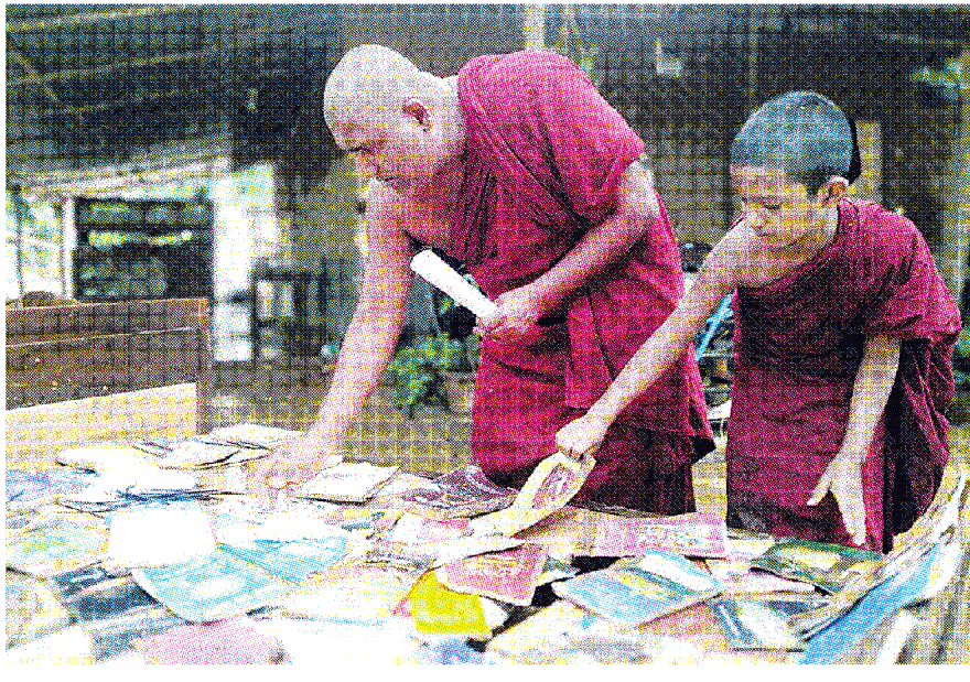
සාමනේර නිමයන් සහ විහාරාධිපති නිමයන් ජලයට හසුවූ බිණ පොත් වෙළඹිම

(සැලැංකාව - හේමලතා ඩී, හේමලතා) අද කැලණි අධික වරපාවත් සමග මා බිය පිටාර ගැලීම නිසා වැල්ලවගෙදර පාලම අසල ඉදිවෙමින් පවතින බෞද්ධ මධ්‍යස්ථානය ජලයෙන් යටවී එහි තිබූ බිණ පොත් ඇතුළු විවිධ වස්තූන් සමග මෙහි බිහිවී තිබේ. මෙහි බිහිවීමට හේතු වන්නේ වතුරට යවවෙලා බවයි.