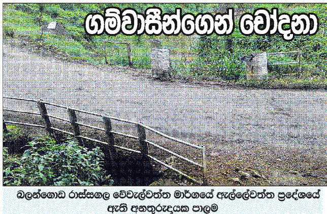
බලංගොඩ රාජසල වෙවැල්වත්ත මාර්ගයේ ඇල්ලවත්ත ප්‍රදේශයේ ඇති අනතුරුදහස පාලම

රාජසල, වෙවැල්වත්ත, රත්නපුර, උඩකන්ද, සීතල, ඉරිබැවිලාගම, උවැල්ල, චින්නන්කුඹුර, වතුකාරකන්ද, කොවුල්කැටිය දක්වා ධාවනය වන මගී ප්‍රවාහන බස් රථ සියයකට වැඩි ගණනක් එම අවදානම් පාලම මගින් ධාවනය කෙරෙන අතර, වෙනත් වාහන දහස් ගණනක් ද දෛනික ධාවනය කෙරෙන බව රියදුරෝ කියති.