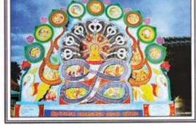
වටිනාකමක් ඉදිකළ මුල්ම තොරණයක් කතා වස්තූන් තමයි "මහා හඳුකල කතා වස්තූන්". එක ලංකාවේ මුල්වරට ඉදිකළ දැවැන්තම තොරණය නිදහස දස දහස් ගණනක විරිසක් මෙක නාමින්න ඇත් කියනවා. අපේ රටේ මිලටු ලොකුකරියකු වූ එස්. එම්. අර්. ඩී. බණ්ඩාරනායක මහත්තයා අතින් තමයි එදා තොරණ නිර්මාතෘ වෙලා කියන්නේ. අවස්ථාව වඩාත් අලංකාර කිරීම පිණිස ගුණිත් මල් පවා ඉහළ කියනවා. ඒ වගේම කියමන දින ගණනට වඩා වැඩි ල ගණනක් තොරණ ප්‍රදේශය කරන්නත් සිදු. වෙලා කියනවා.

එකට ගෙනුන තමයි ගෙට විවිධ ප්‍රදේශවලින් දිවෙනා විශාල සෙසකක් පැමිණිම. එකතුකරි තවත් අයුරු සිදුකරන සිදු වෙලා කියනවා. එකක් මේ වෙලාවේදී මකක් කරන්න මින ..." තොටළඟ තොරණ පිළිබඳව අතින් තතු පැවසීම පිණිස දිවයින කාර්යාලය වෙත පැමිණි අනුර පෙරේරා සතුට පැවසී ලිපි ගොනුවක් ද විය. එහි සිසු ලිපි දේශන අතර තොටළඟ තොරණ පිළිබඳ අතින් විස්තර අඩංගු ලිපි ලේඛන ද කලායා විසින් දුර්වර්ණ කරන ලද ඡායාරූප එකතුවක් ද විය. එම ලිපි ලේඛන රැසක එක ලද්දේ මහු විසින් පවසා සිටින ලෙස තොටළුම පිණිස විය යුතුය. වරින් වර එම ඡායාරූප සහ ලිපි ලේඛන පොත්මින් මුහු පවසා සිටින අතින් සහ සිරිම කුළු වුව ද පාල වන්නේ ආල ලාංකියයන් සතු හැකියාවන් පිළිබඳ විවිධය දැනවන පුර බවකි. "...මම අනුරු සිදුකරන ගත කිරුවෙන්. ඒ ගැන වැඩිදුරටත් විස්තර කරනවා නම් තොටළඟ ඉදිකරන ලද "මහා හඳුකල කතා වස්තූන්" ඇතුළත් තොරණ කරන්න පස් වැනිකම පස්ක සහහානි වෙලා කියනවා. ඒ අය මේ තොරණය