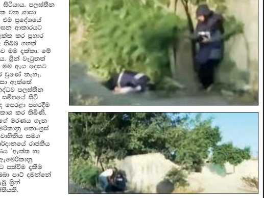
එවක රජය අවස්ථාව

යනුවෙන් හමුදා නිල් පැහැති ජැකට්ටුවක් ඇඳ සිටියාය. පලස්තීන වෙබ් අඩවියකට පුවත් සහයක මාධ්‍යවේදිනියා වන ශානා හුසේන් පවසන්නේ මේ සිද්ධිය වූ අවස්ථාවේ එම ප්‍රදේශයේ කිසිදු ගුවන්යන් පැරකීමක් නැති බවයි. ඔහු පවසන ආකාරයට ඊශ්‍රායල හමුදාව සිනා මනාම මාධ්‍යවේදිනිය ඉලක්ක කර ප්‍රකාර එල්ල කර තිබේ. මේ වෙබ් සියලුකොට අසල බිහි වූයේ අසහන සිනාය. ග්‍රීන් ක්‍රිස් ක්‍රෙවෙල් හමුදාව වෙබ් සිනා වන නැවැත්තුවේ නැත. මේ ඇය සේවය අත දිනකට කලාපයක. එක් වෙබ් නැතිව කතා වූයේ නැත. ඇත්ත වශයෙන් නම් ඊශ්‍රායල හමුදා ප්‍රධානීන් වර්තමාන ඇමෙල් මාධ්‍යවේදිනිය දෙදෙනෙක් 'කැමරා වලින් සන්තකයට පලස්තීනා ක්‍රමයන්ගේ සම්පූර්ණව පිටි බවයි. මාධ්‍යවේදිනිය සම්පූර්ණව පිටි ක්‍රමයන්ගේ හමුදාවට වෙබ් කැමු ක්‍රියා කළේද ජෙරේදා පානාදී මිදු වූ බව කතාවේ හමුදා වෙබ්සයට සහන ප්‍රකාශ කර තිබේ. ග්‍රීන් ඇමෙරිකානු ප්‍රධානියෙක් නිසා ඇයගේ මරණය ගැන විශේෂ උරුමයන් සඳහා වූයේ යුද බව ඇමෙරිකානු නොහොඳ සාමාජිකයන් වන රජයට වලිබි ඇල්ජිඩ්ගේ ඉදිරිපත්වීම් පාලන පැවැති සාකච්ඡාවකදී ප්‍රකාශ කර තිබේ. ජෝර්ජ් ජෝර්ජ් රාජකීය කුමරිය නිවැරදිවන කර ඇත්තේ ග්‍රීන්ගේ මරණය 'ඇත්ත හා සුක්ෂිමය' එල්ල වූ බරපතල ප්‍රකාශයක් බවයි. ඇමෙරිකානු මාධ්‍යවේදිනියක් ඊශ්‍රායල ප්‍රකාශයක් මඟුලට පත්වීම දැනීම ඇතැවන්ට සිද්ධය. නමුත් ඊශ්‍රායල හමුදාව බොහෝ වාරයන් නැත. පලස්තීන ක්‍රිස්තියානි පවුලක උපත ලැබූ ග්‍රීන් ඇමෙරිකාව නිව වර්ජිනියා කළ නැතැයි කියයි.