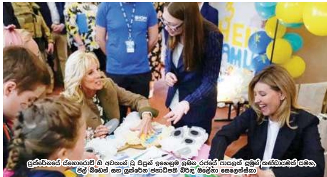
යුක්ලේනයේ ස්කොප්ලෝ හි අවිනැන් වූ සිසුන් ඉමෙහි ලබන රජයේ සාකච්ඡා මුලින් කැණීගැනීමේ සමයක, පිල් බිමකින් සහ යුක්ලේනයේ පැනවීමේ බිරිඳ බිලිගෙන සෙලෙන්නියා

රුසියාව හා චීනය සමග සාදු ගුවන්යන් සඳහා එක්සත් ජනපදය වසර ගණනාවක් තිස්සේ සැලසුම් කළේය. 2001, මුලෝකයක ලෝකයටම සඳහන් වන කරුණ පිළිබඳ කිසිදු සඳහනක් මාධ්‍යයේ කතානාදායකව නොසාදන නොහැක. රුසියාව වෙත යුක්ලේනය ආක්‍රමණ සඳහා, ලිබියාවේ ඇතැම් සිටින බටහිර මාධ්‍ය සහ විවාදයන් එක්සත් ජනපදයේ මෙහි ප්‍රවේශය සිය කියැවීම සඳහා ඇදහූ එක් නොහැකිමට ප්‍රවේශය වීම අවිනැන් ප්‍රකාශයක් සිදු කළේය. එය, සමත් බිලිගැනී හා වීනා කළ හැකි කුඩා ප්‍රමාණයක් නැන්වීම අවි නිර්මාණය කිරීම ද ඇදහූ විය. 2018 දී, එක්සත් ජනපදය අතරමැදි වර්ග නැන්වීම බලකා (INF) බිලිගැනීමේ ඉවත් වූ අතර නැගෙනහිර යුද්ධයේ රටවලට, ප්‍රධාන රුසියානු නගරවලට පැරදී හැකි මිසයිල සංවර්ධනය කිරීම සඳහා අන්තරාධාන බැරීම් ආරම්භ කළේය.