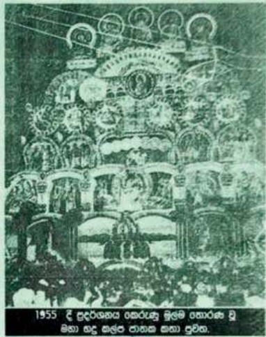
1955 දී පුද්ගලයන් ගෞරවය ඉමේ තොරණ වූ මහා සුදු කළුර එකතු කළා පුළු.