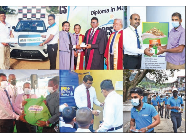
Brand Finance වර්ගීකරණයට අනුව HNB FINANCE PLC හි සන්නාම වටිනාකම රුපියල් මිලියන 1264 ක් වන අතර ශ්‍රී ලංකාවේ වටිනාම වෙළෙඳ නාම 100 අතර එක් වෙමින් එහි පළමු සන්නාම 57 අතරට එක්වීමට සමත් විය. එමෙන්ම Brand Finance ශ්‍රේණිගත කරණයට අනුව HNB FINANCE සමාගම 'සන්නාම වර්ගීකරණ කීරීම හිමිකර ගෙන ඇත.

ශ්‍රී ලංකාවේ ප්‍රමුඛතම මූල්‍ය සමාගමක් වන HNB FINANCE PLC අඛණ්ඩව දෙවැනි වරට ශ්‍රී ලංකාවේ වටිනාම පාරිභෝගික සන්නාමයක් එළිදැක්වුණු බ්‍රැන්ඩ් Finance ලැයිස්තුවක කීරීමට ඇතුළත් වීමට සමත් විය. LMD සඟරාව විසින් වාර්ෂිකව වෙනම පාරිභෝගික ප්‍රසාදය දිනූ වටිනාම සන්නාමයක් 100 නිවේදනය කරනු ලබන අතර මූල්‍ය ස්ථාවරත්වය, සේවා විශිෂ්ටත්වය සහ පාරිභෝගික විශ්වාසය ඇතුළත් නිර්ණායකයන් රැසක් මේ සඳහා සලකා බලනු ලැබේ.