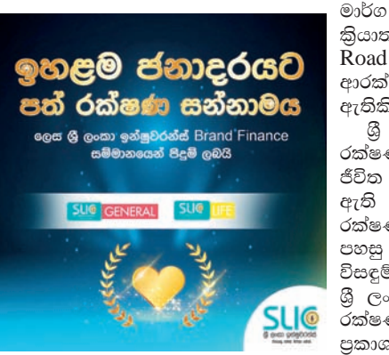
ඉහළම ජනාදරයට පත් රක්ෂණ සන්නාමය

දේශයේ රක්ෂකයා ශ්‍රී ලංකා ඉන්ෂුරන්ස්, සිය විශිෂ්ටත්වය නැවතත් තහවුරු කරමින් වසරේ ඉහළම ජනාදරයට පත් ජීවිත රක්ෂණ සන්නාමය, ඉහළම ජනාදරයට පත් සාමාන්‍ය රක්ෂණ සන්නාමය සහ වසරේ වඩාත් අගනා සාමාන්‍ය රක්ෂණ සන්නාමය ලෙසද අඛණ්ඩව පස් වන වසරේදී බ්‍රැන්ඩ් ජයග්‍රහණය වෙමින් ඇගයීමට ලක්ව තිබේ.