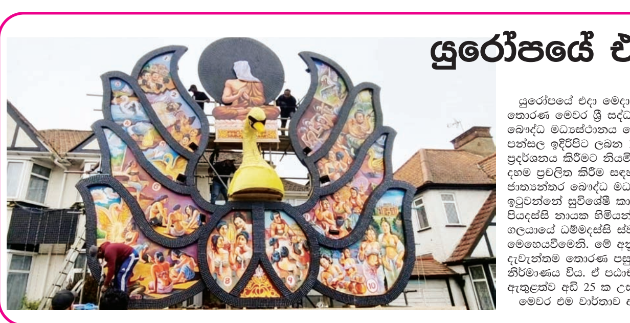
ලෝකරැයි මණ්ඩලයේ ලෝකරැයි පත් අතුරින් පසුගිය වකවානුවේ බිහිවූ සුපිරි ත්‍යාගලාභීන් සඳහා ජයග්‍රාහී වෙකපත් ප්‍රදානය ජාතික ලෝකරැයි මණ්ඩලයේ සභාපති නීතිඥ ලලිත විසුම් පෙරේරා මහතාගේ ප්‍රධානත්වයෙන් එම මුලස්ථානයේදී පසුගියදා සිදු කෙරිණි.

Devices) හිමි පාරිභෝගිකයන්ට මෙය අත්විඳීමට අවස්ථාව ලැබේ. මීට අමතරව මානවයන් කොළඹ පුර්වදේශයේ නව 5G යටිතල පහසුකම් ස්ථාපිත කිරීමටද SLT-MOBITEL කටයුතු කළේ ය. https://5g.sltmobitel.lk වෙත පිවිසීම මගින් පාරිභෝගිකයන්ට තම උපාංග (අධිසජු) වල 5G තාක්ෂණ පහසුකම් තිබේද යන්න පරීක්ෂා කළ හැකි වේ. 5G තාක්ෂණය භාවිතා කළ නොහැකි උපාංග (Device) හිමි පාරිභෝගිකයන්ට, තෝරාගත් SLT-MOBITEL මධ්‍යස්ථාන වෙත පැමිණීමෙන් 5G තාක්ෂණයේ මගීම්‍ය අත්විඳීමට අවස්ථාව ලැබෙනු ඇත.