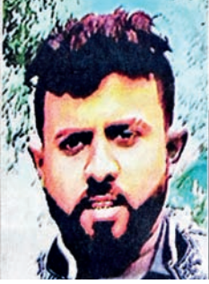
පිටකොටුවේ වැරදීමකින් වෙඩි වැදී මිය ගිය තරුණයා