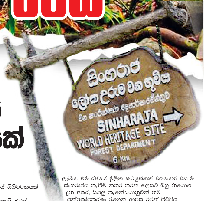
ලැබිය. එම රජයේ මූලික කටයුත්තක් වශයෙන් වහාම සිංහරාජය කැපීම නතර කරන ලෙසට ඔහු නියෝග දුන් අතර, සියලු කැනේඩියානුවන් නම් යන්ත්‍රෝපකරණ රැගෙන ආපසු රටින් පිටවිය.

සිංහරාජය බේරා ගනු ලැබිය. මෙම වටිනා නොගුදුළු වනාන්තරය මතුපිට ඇතිවිය හැකි බාධා මැඩපැවැත්වීමට වන සංරක්ෂණ දෙපාර්තමේන්තුවට පසුව (ඉතා ප්‍රමාදව) තේරුම් ගිය අතර, එහි ඇති ජෛව විවිධත්වය සොයා බැලීමට, විද්‍යාත්මක පර්යේෂණ කිරීමට 1978 දී විද්‍යාඥයන්ට අවසර දෙනු ලැබීය. ඒ අනුව එම වර්ෂයේ දීම ජෛවදේශීය විශ්ලේෂණයේ ආචාර්ය සාවිත්‍රි ගුණතිලක හා එල්. ඒ. ඒ. ගුණතිලක විසින් මූලික පර්යේෂණ වැඩසටහනක් සිංහරාජයේ දියත් කරන ලදී.