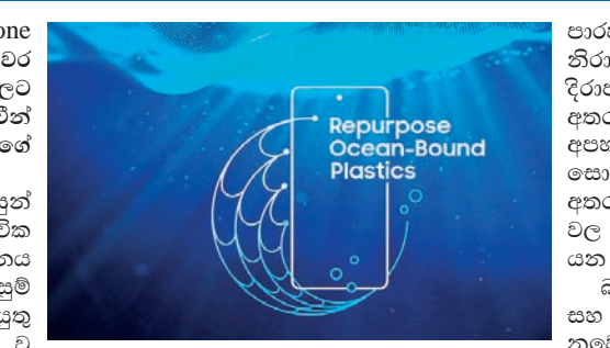
සමුද්‍රය දැකිය යුතුව සැමසුන් ඉලෙක්ට්‍රොනික්ස් විසින් ස්වභාවික සම්පත් කෙරෙහි අවධානය යොමුකරමින් තම නිෂ්පාදන සැලසුම් කිරීමට සහ සංවර්ධනය කිරීමට කටයුතු කළේය. සැම්සූන් හි ඒ වෙනුවෙන් වූ නවතම පියවර වූයේ මානව Galaxy තාක්ෂණය සහිත නව අමුද්‍රව්‍යයන් නිර්මාණය කිරීමයි. සාගර ආශ්‍රිතව ඇති ඉබ්න දැමු සීර් මාලා දැල් නැවත වෙන්කර ඉවුණක් සඳහා භාවිත කිරීමේ අරමුණින් (repurposed) මෙම නව අමුද්‍රව්‍ය නිපදවනු ලබයි.

ශ්‍රී ලංකාවේ අංක 1 smartphone සන්නාමය වන සැම්සූන්ග් ඉබ්න දැමු සීර් මාලා දැල් මවුන්ටේන් smartphones වලට එක්කරන ප්‍රයත්නය සමගින් සමුද්‍ර ජීවීන් ආරක්ෂා කිරීම උදෙසා ඇති මවුන්ටේන් කැපවීම යළි අවධාරණය කරනු ලැබේ.