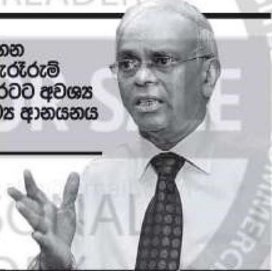
ශ්‍රී ලංකා මහ බැංකුවේ සිටුවාගත් අධ්‍යක්ෂ ජනරාල් ඩබ්ලිව්. ඒ. විජේවර්ධන

ශ්‍රී ලංකාවට ජාත්‍යන්තර මූල්‍ය අරමුදලේ සහන පැහැරීමට හේතු වන හැකි හොඳම හේතු, බැරැරැම් ප්‍රතිඵලවලට මුහුණ දෙන්නට රටට සිදුවේ. රටට අවශ්‍ය ආහාර, ඖෂධ, ඉන්ධන හා අනවශ්‍ය අමුද්‍රව්‍ය ආනයනය කිරීමේ සියලු ඉඩකඩ ඒ නිසා ඇතිවී යයි.