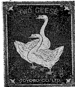
(1) මෙම ලකුණ අංක 30,818 ලකුණ ලියාපදිංචියෙන් පසු සංශෝජිත කෙරේ.