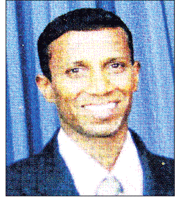
අනතුර මරණ පරීක්ෂණ සඳහා සිරුර දැමුණ මූලික රෝහලේ තැන්පත් කර ඇති අතර සිද්ධිය සම්බන්ධයෙන් දැමුණ පොලීසිය වැඩිදුර පරීක්ෂණ පවත්වයි.

ක්‍රියාත්මක කරන අවස්ථාවේ දී එම යන්ත්‍රය ආසන්නයේ ක්‍රියාත්මකවී තිබූ නොටය යකඩ බාර දෙනකට හද විමෙන් කුටාල ලැබූ මෙම සේවකයා දැමුණ මූලික රෝහලට ඇතුළත් කරන විටත් මිය ගොස් සිටි බව පොලීසිය කියයි. මියගිය කාර්මිකයා වසර 15 කට අධික කාලයක් මෙම පොදුගිණුමක කමිහලේ සේවය කරන අයකු බව නිවැසියෝ පවසති. දැමුණ මූලික රෝහල සිද්ධිය සම්බන්ධයෙන් වැඩිදුර පරීක්ෂණ පවත්වනු ලබන අතර මෙහි වැඩ පාලකවරයාගෙන් සිද්ධිය සම්බන්ධයෙන් විමසීමේ දී කියා සිටියේ තමන් ඇතුළු කණ්ඩායම යන්ත්‍රයක අලුත්වැඩියා කරමින් සිටියදී මෙම අනතුර සිදුවූ බවයි.