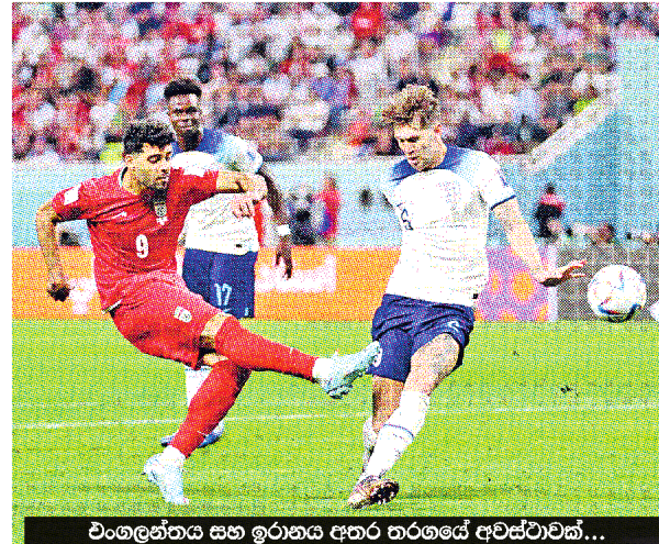
එංගලන්තය සහ ඉරානය අතර තරගයේ අවස්ථාවක්...

මෙම සමාරම්භක තරගය නරඹීම සඳහා 673227 දෙනෙක් 'අල්