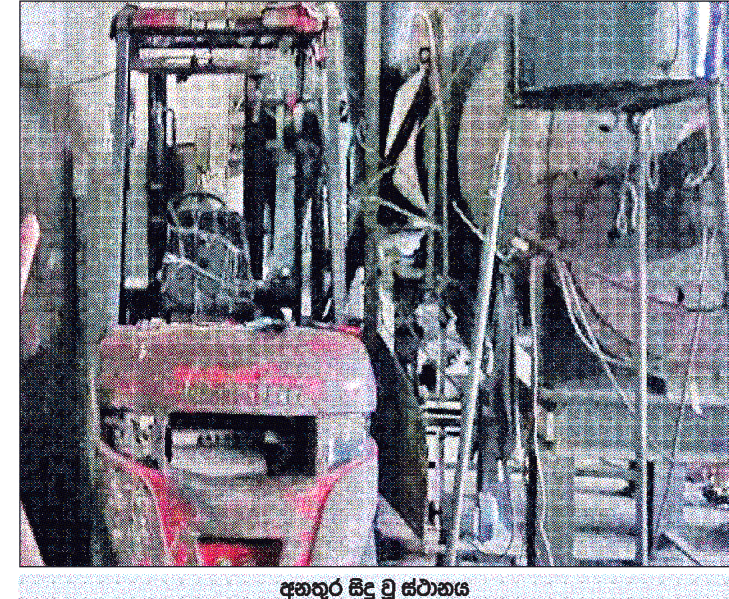
අනතුර සිදු වූ ස්ථානය