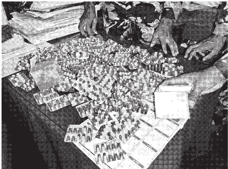
අත්අඩංගුවට ගෙන ඇත. වැඩිදුර පරීක්ෂණ සඳහා සැකකරු කළුතර දකුණ පොලිස් ස්ථානයට බාර දුන් බවද පොලිස් විශේෂ කාර්ය බලකාය පවසයි.

පොලිස් විශේෂ කාර්ය බලකායේ අභ්‍යන්තර නිලධාරී නියෝජ්‍ය පොලිස්පති නීතිඥ වරුණ ජයසුන්දර මහතාගේ උපදෙස් මත ජ්‍යෙෂ්ඨ පොලිස් අධිකාරී අතුල රත්නායක මහතාගේ මෙහෙයවීම යටතේ විශේෂ කාර්ය බලකායේ කටුකරුන්ද පුහුණු පාසලේ ප්‍රධාන පොලිස් පරීක්ෂක වමිල මාර්පත මහතා ප්‍රධාන පොලිස් කණ්ඩායමක් මෙම වැටලීම සිදුකර මත් කරල් සමග සැකකරු