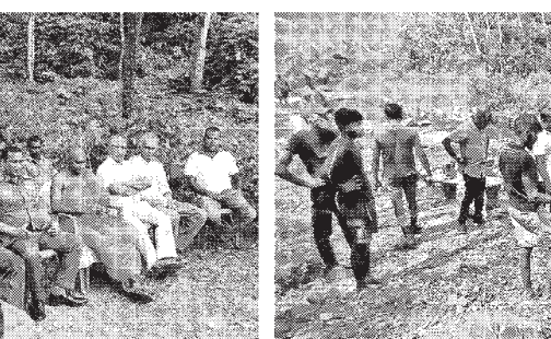
රන්තලල ඇලේ සුරකින්න සඳහා පහසුකම් පැමිණි ආරාධිතයන් හා රන්තලල ඇලේ අවට පිරිසිදුකිරීමට ගම, පන්සල, රාජ්‍ය ආයතන එකවු අයුරු.

■ මතුගම බන්දු හමිට් මතුගම රන්තලල ඇලේ පිට ප්‍රදේශවලින් පැමිණෙන පිරිස් හිසා එම ඇලේ අවට පරිසරය විනාශ ලෙස දුෂණය වී ඇති බවත්, මත් ලෝකීන් සහ ප්‍රදේශවාසීන් අතර හිතර ගැටුම් ඇතිවන බවත් එම හිසා එම සුන්දර ස්ථානය මතුගම ප්‍රාදේශීය සභාවට පවරාගෙන හිසි පාලනයකින් පවත්වාගෙන යන ලෙසින් ප්‍රදේශවාසීන් ඉල්ලා සිටීම පිලිබඳව පසුගිය 18 වැනිදා අලංකාදීප පුවත්පතේ අනාවරණය කළ පුවත්පතිය එල දරා ඇත.