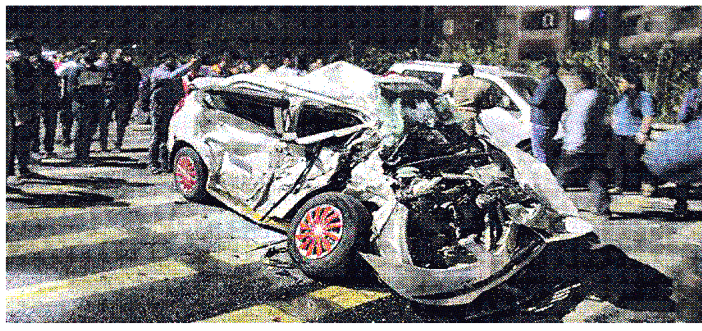
නගර සංවර්ධණ අධිකාරියේ නිලධාරීන්ගේ පොලීසියෙන් සහාය හිමිවිය.

ඉන්දියාවේ පුනේ නගරයේ, හවේල් පාරේදී ඉහළින් දිවෙන පුනේ - බ්‍රොග්ලෝර් අධිවේගී මාර්ගයේ වාහන 48 ක් එකිනෙක ගැටීමෙන් 30 දෙනෙකු තුවාල ලබා රෝහල්ගත කෙරුණි. තුවාල ලැබූ කීප දෙනෙකුගේ තත්ත්වය බරපතල බව රෝහල් ආරංචි මාර්ග පවසයි.