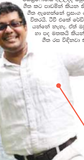
බිරිඳ කියන්නේ ඉඳහිට හරි ශෝචලට යන එක හොඳයි කියලා