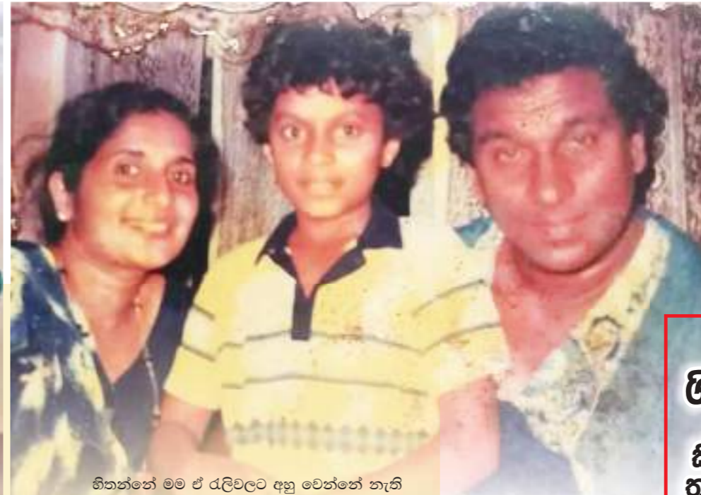
● අලුත් ගීත හදන අතරතුර ඇයි මිශ්‍රයින් විකිණේ පැත්තට නැහැද වෙන්නේ නැත්තේ. ඒක බිබි වෛද්‍ය වෘත්තියට අකැපයි කියලා හිතනවද..?

මට කතා කරන සංගීත ප්‍රසංගවල මාත් එකක ගීත ගයන්න එන අය කවුද කියලා පෙස්ටරවලින් දැකගන්න ලැබෙනවා. නමුත් ඒ ගායකයින් මම දන්නේ නැහැ. ඒකට හේතුව මම රූපවාහිනිය නැරඹෙන්නේ නැතිකම මිසක් ඒ අය ජනප්‍රිය නොවී නෙමෙයි. එයාලා ජනප්‍රියයි. මම මුලින්ම ගීත ගායනා කරන්න මත කිවුමම කියනවා තව ටිකක් ඉඳලා කියන්න මයා සිංදු කියනකල් බලාගෙන ඉන්න අය රඳවා ගන්න මත කියලා. මම