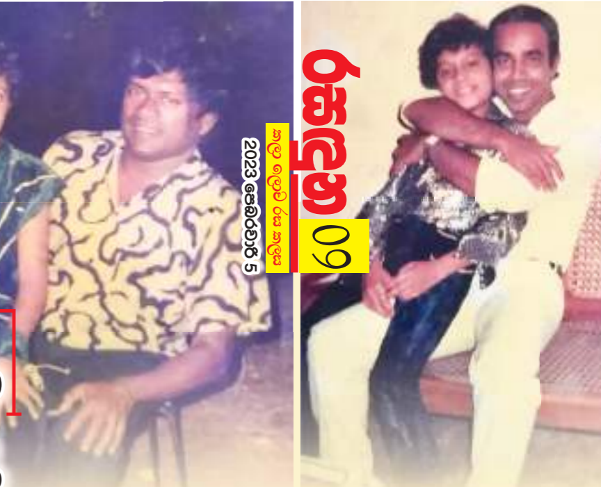
● බිබි කාලයක් මාහසික රෝගීන්ට ප්‍රතිකාර කළ වෛද්‍යවරයෙක්. රෝගීන්ට ප්‍රතිකාර හොද ආයතනික වෙන්නේ මොන හේතුවක් නිසාද කතාව අවසන් කරන්න කලින් ඒ ගැන කියමු..?

මාහසික වෛද්‍යවරයෙක් හැටියට කටයුතු කරන්න පළමු පන්වීම ලැබෙනවා කල්මුණේ රෝහලට. කල්මුණේ කියන්නේ දම්ල හා මුස්ලිම් ජනතාව වැඩි ප්‍රදේශයක්. ඒ නිසා මට දම්ල