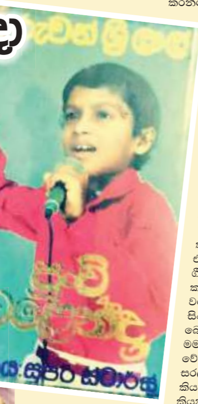
● තවමත් බිබි ගීත හදන්න බිබි දෙමාපියන්ට උදව් කරනවද..?

රැකියාව වෛද්‍යවරයකු කියලා කොයිම මොහොතකටම මම මගේ ගීතවලට රූප රචනා කරන්නේ නැහැ කියලා වාරණ ධූගෙන නැහැ. අකැපත් නැහැ. මම විකිණේ කරලා තියෙනවා සමහර ඒවා විකාශය වෙලක් තියෙනවා. නමුත් කෙනෙක් ජනප්‍රියත්වය හෝ වැඩ බලාපොරොත්තුවෙන් තමයි මය හැමදේම කරන්නේ. ඉතිං මේ කාලේ මට විකිණේ කරලා ප්‍රසිද්ධිය ලබා ගන්නවත් වැඩ හොයන්නවත් අවශ්‍ය වෙලා නැහැ. ඊට හේතුව නොඅඩුව ප්‍රසංග වේදිකාවට මට ඇරැයුම් ලැබෙන නිසා.