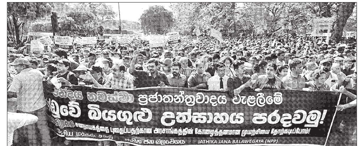
විදුලි බිල යළිත් වරක් වැඩි කිරීමේ විරෝධය ප්‍රජාතන්ත්‍රවාදය වැළඹීමේ බලවේ බියගැලී උත්සාහය පවත්වමින්.

එහෙත් බොහෝ විට සිදුවන්නේ නියෝජිතතන්ත්‍රවාද ප්‍රභූ කල්පිතතන්ත්‍රවාද බවට පත්වීමය. නියෝජනය යට යාමය. ඒ මතුවීමට සිදුවන්නේ හුදු ජනතා කැමැත්ත ලබා ගෙන සිටිය යුතු බව විශ්වාස කිරීම නිසාය. මේ ප්‍රකාරයට ප්‍රජාතන්ත්‍රවාදයේ අර්ථකථනය මේ මොහොතේ වඩාත් දේශපාලනික වේ යන්න මගේ අදහසය.