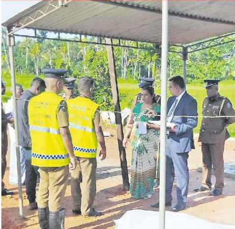
සවන්ත මරණ පරීක්ෂණය සිදු කරමින්...

වැඩිදුර විමර්ශනවලට අනුව භාගනය සිදුකළ බව කියන මැරීසිට්ටර් පැරිච් පුද්ගලයා පොලීසිය විසින් අත්අඩංගුවට ගත් අතර මිත්‍ර මීට මාස දෙකකට ඉහතදී පාබාධිතවීම නිසා සේවයෙන් ඉවත් වූ ඉවත් හමුදා හටය. ඉවත් පොලීසිය සඳහන් කරයි. එසේම සැකකරු සන්නයෙන් නිසි භාගනයට යොදාගත් උල් නිසිසඳ පොලීසිය භාරයට ගෙන ඇත.