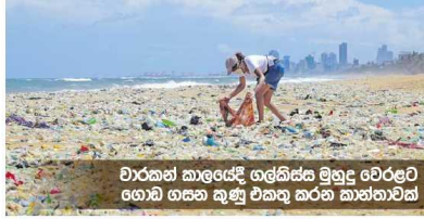
වාරකඩ කාලයේදී ගලකිස්සේ මුහුදු වෙරළට ගොඩ ගසන කුණු එකතු කරන සාක්ෂාවක්.