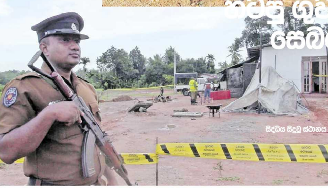
සිද්ධිය සිදුවූ ස්ථානය

අවි අද මෙහි ඉදලා උදේට යමු. පොලීසියට අනුවන්නන් පුළුවන් යැයි ඔහු මිතුරුන්ට පවසා තිබුණි. තමන්ට ඊට අවනත නොවූ මිතුරු තමන්ට යා යුතුම යැයි කියමින් යතුරුපැදියෙන් පසු ගන්වන්නට උත්සාහ කර තිබුණි. එහිදී නිරෝෂණ විසින් මිතුරුගේ බෙල්ලෙන් තදින් අල්ලා 'ගිටිය යකා' යැයි පැවසීමත් සමඟ උරණ වූ මිතුරු නිරෝෂණ හට පහරදී තිබුණි. එහිදී දෙදෙනා අතර ගැටුමක් නටගෙන තිබෙන අතර එම අවස්ථාවේදී මිතුරු තම බෑගයේ තිබූ නිසිසඳක් ගෙන නිරෝෂණට ඇණ තිබුණි.