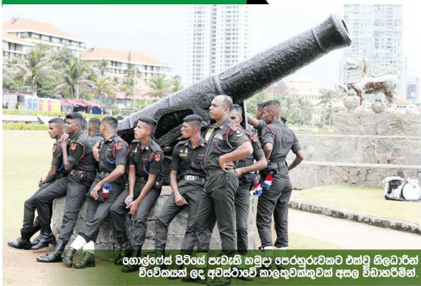
ගොල්ලේස් පිටියේ පැවැති හමුදා පෙරහැරකට එක්ව නිලධාරීන් විවේචනය ලද අවස්ථාවේ කාලතුවක්කුවක් අසල විඩාහරිමින්.