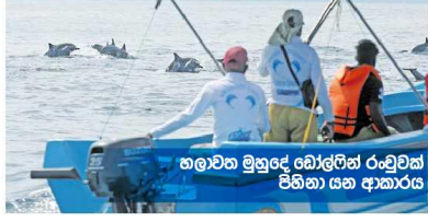
හමුවන මුහුදේ බෝලිඟි රටවුක් පිහිනා යන ආකාරය.