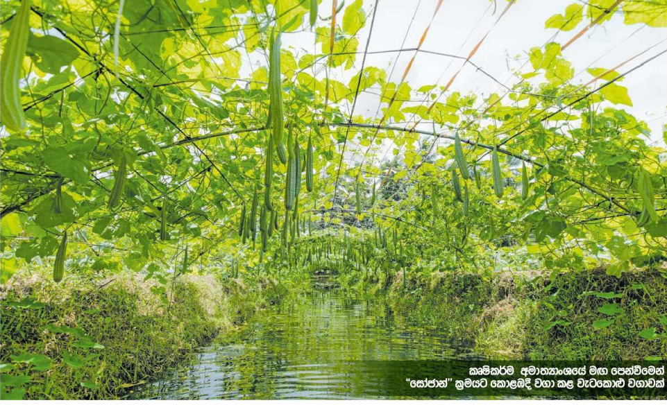
කෘෂිකර්ම අමාත්‍යාංශයේ මහ පෙන්වීමෙන් 'කේජන්' ක්‍රමයට කොළඹදී වගා කළ වැරටකොළ වගාවක්.