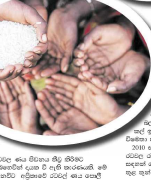
රටවල ණය පීඩනය තිබූ කිරීමට බෙහෙවින් දායක වී ඇති කාරණයකි. මේ වනවිට අප්‍රිකාවේ රටවල් ණය පොලී