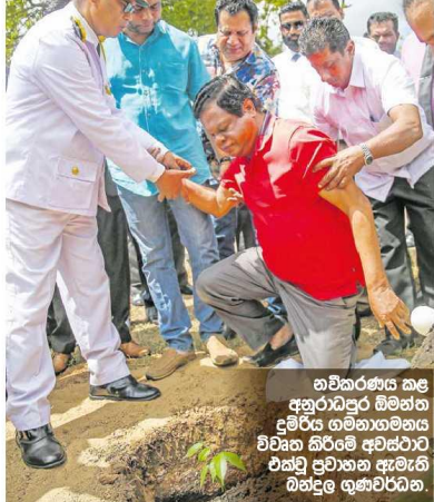
තවකරණය කළ අනුරාධපුර ඕමිනිග පුරාණ භූමිකාමය විවිධ කිරීමේ අවස්ථාවට එක්ව ප්‍රවාහන ඇමැති ධනදුල භූභාවර්ධන.