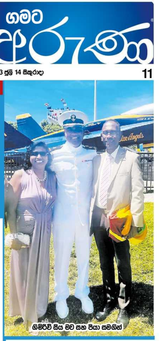
ගිම්මේ සිට මව සහ සහකාරිය

ඉදලාම හරිම දහකාරයි. පුද්දේ කාලේ රූපවාහිනියේ ප්‍රචාරයකිල ඒ නොරතුරු යනකොට එය පුටු මේස යට රිංගලා කෙල්ලම් තුවක්කුවකින් වෙඩි තියනවා. පුද්දේ නොරතුරු ඉවර වුණොම තමයි එයනේ සටන තවත්වන්නේ. ගිම්මේ මෙ එය මනකය එවදී කලාය. ගිම්මේ මුලික අධ්‍යාපන ලැබුවේ නොරණ අලෝක විද්‍යාලයෙනයි. එතැනින් රජයේ කොමන්ඩ් විද්‍යාලයට ගිය ඔහු ඉංග්‍රීසි මාධ්‍යයෙන් සාමාන්‍ය නාවික නිලධාරී පදවියට පත්වෙලා ආවේය. ඉන්පසුව ගිම්මේ මුලික පුහුණුව ලැබුවේ නාවික නිලධාරීන්ගේ පුහුණුවකිනි. ඉන්පසුව ඔහු විද්‍යාලයේ ආචාර්යවරයෙක් ලෙසින් සේවය කළේය. ඔහු විද්‍යාලයේ ආචාර්යවරයෙක් ලෙසින් සේවය කළේය. ඔහු විද්‍යාලයේ ආචාර්යවරයෙක් ලෙසින් සේවය කළේය.