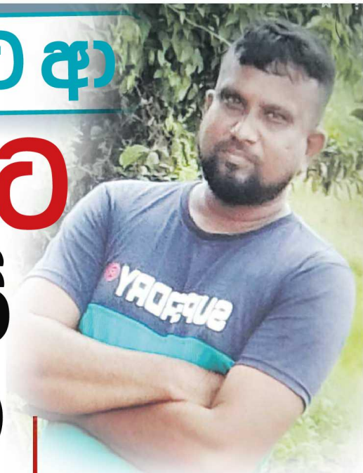
මිය ගිය නිරෝෂණ

මෙරටේ වාර්තා වන අපරාධවලින් වැඩි භරයක්ම සිදු වන්නේ නිරෝෂණව කිණිසි පහර වලිනි. සතුටු කාමිවිගේ යෙදවුමක් එකට මත්පැන් පානය කරන එකම පවුලේ කොහොටුරුව, මෙහිම ගර මිතුරුන්ද මත්පැන් පානය කිරීමෙන් පසු ගෘහ මරාගෙන සතුරන් බවට පත්වෙති. එවන් ගැටුමක් නිසා විසි ඇණුම්වලට ලක්ව පුද්ගලයෙකු මිය ගියේ සිද්ධියක් අපට වාර්තා වූයේ මොරගහනේ ගලගල ප්‍රදේශයෙනි.