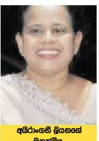
අතීත දේවාලයේ මහනායක