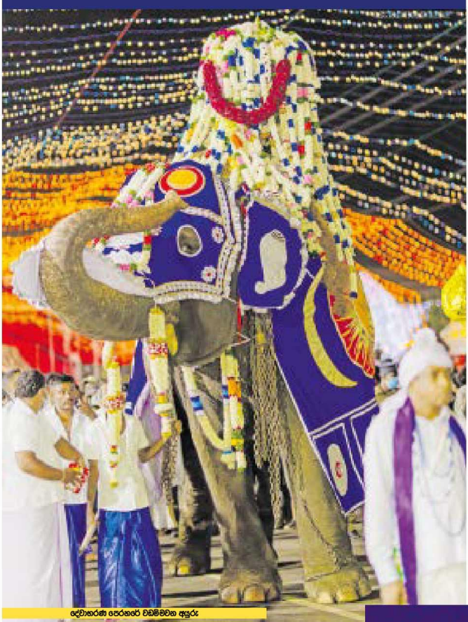
දේවාලයේ පෙරහර වහිමිමහ අයුරු