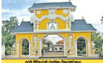
පරම විවිභූමි රාජකීය විහාරස්ථානය

‘දෙවිභූමි’ යන නාමය අනෙකුත් සමම නාමයන් මතකයට එන්නේ වෙනිකාසින උපුල්වත් ශ්‍රී විජේසූරිය මහා දේවාලයයි. පළමුවැනි දැව්පුල රජු විසින් ඉදිකරවන ලද මෙම දේවාලය වටා ගොඩනැගී ඇති වෙනිකාසින කාර්යාලය රැකගනී.