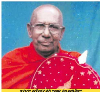
අතීත දෙවිභූමි පිරිසුද්ධ මහ නාමිකයා