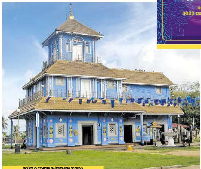
දේවාලයේ උසුල්වත් ශ්‍රී විජේසූරිය මහා දේවාලය