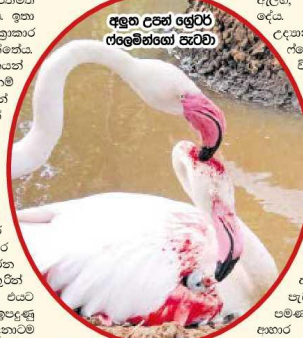
අලුත උසන් ලෙසින් ආලෝකය

සාමන්ත බාලාසුරිය යනු මාලිගම් කාරයෙකි. ඔහුට රතු කිරි පිණිස උද්යෝගයක් ඇත. ඔහුගේ උද්යෝගය වනුයේ රතු කිරි ස්ත්‍රීන්ගේ ප්‍රියතම පානය ලෙස සිටින බැවිණි. ඔහුගේ වගකීම වනුයේ රතු කිරි ස්ත්‍රීන්ගේ ප්‍රියතම පානය ලෙස සිටින බැවිණි.