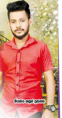
මාගේ කසුන් ප්‍රතිචාරය

ඩිරාම් සොයා ඩුබායි ගිය කසුන් හිස අතින්ම ඇවිත්. ඔහුගේ වගකීම වනුයේ රතු කිරි පිණිසය.