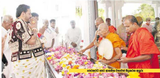
පෙරහර පෙර ආමාන වහිමිමහ අයුරු