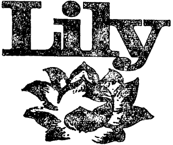
ආර්. එල්. ද සිල්වා, වෙළඳ ලකුණු රෙජිස්ට්‍රාර්.

(1) වෙළඳ ලකුණේ අංකය : 31,696 (2) ලැබුණ දිනය : 1969 ජූලි මස 15 දින. (3) ඉල්ලුම් කරු (වෙළඳ ලකුණ අයිතිකරු) : බර්නර් එල් පන් මිල්විගෙස්ල්ෂාෆ්ට් (සොසයිටේ) ලයිබ්ට්ෂර් බෙස් ඇල්පේස් බර්නොයිසෙන් සහ බර්නර්ස් ඇල්පේස් ෆ්ලේක් කෝ යනුවෙන්ද ව්‍යාපාරික) (ස්විට්සර්ලන්තයේ නිති යටතේ සංවිධානය වූ බද්ට් ව්‍යාපාර වස්තු සමාගමකි) ස්ටෝල්ෆර්, එමෙන් නෝල්, ස්ටිම්සර් ලන්තය; නිෂ්පාදකයෝ. (4) ලියුම් භාර දීම සඳහා මෙරටෙහි වූ ලිපිනයක් ඇත්නම් ඒ ලිපිනය : එෆ්. ජේ. හා ජී. ද සේරම් මහතුන්, නැ. පෙ. 212, කොළඹ. (5) පන්තිය : 42. (6) බඩු : උකුකල කිරි. (7) වෙළඳ ලකුණේ සටහන :