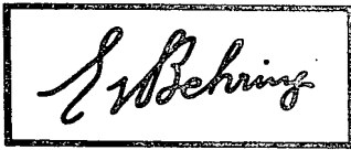
ආර්. එල්. ද සිල්වා, වෙළඳ ලකුණු රෙජිස්ට්‍රාර්.

(1) වෙළඳ ලකුණේ අංකය : 33,579; (2) ලැබුණ දිනය : 1971 මැයි මස 30 දින. (3) ඉල්ලුම් කරු (වෙළඳ ලකුණ අයිතිකරු) : බෙර්-වර්ක් ඇන් විචන් ගෙස්ල්ෂාෆ්ට් (ජර්මනියේ නිති යටතේ සංවිධානය වූ බද්ට් ව්‍යාපාර වස්තු සමාගමකි) මාබර්න්, (ලාන්,) ජර්මනිය; නිෂ්පාදකයෝ. (4) ලියුම් භාර දීම සඳහා මෙරටෙහි වූ ලිපිනයක් ඇත්නම් ඒ ලිපිනය : එෆ්. ජේ. හා ජී. ද සේරම් මහතුන්, නැ. පෙ. 212, කොළඹ. (5) පන්තිය : 1. (6) බඩු : විද්‍යාත්මක ප්‍රයෝජනය සඳහා රසායනික නිෂ්පාදන. (7) වෙළඳ ලකුණේ සටහන :