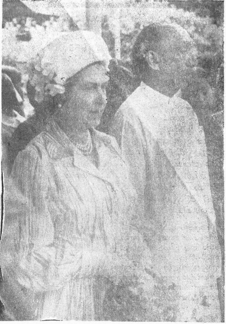
○ බ්‍රිතාන්‍ය රාජකීයන් පිළිබඳ ශ්‍රී ලංකා එකතුව නොබෝද දිවයිනට පැමිණි බ්‍රිතාන්‍යයේ දෙවන එලිසබත් මහ රැජින, ශ්‍රී ලංකා ජනාධිපති ජේ. ආර්. ජයවර්ධන උතුරාණන්, සමග ශ්‍රී ලංකා වාසින් බහාලුවූ අවස්ථාවක ඉහතින් දැක්වෙන්නේ. බ්‍රිතාන්‍ය රාජකීයන් පිළිබඳ ශ්‍රී ලංකාවේ පළමු විවිධ ප්‍රකාශන, සඟරා හා වෙනත් පත්‍රිකා ආදිය පිළිබඳ විශේෂ එකතුවක් දැන් ශ්‍රී ලංකා ජාතික පුස්තකාලයෙහි අරඹා ඇති අතර, පරිත්‍යාගශීලීන්ගේ ආධාරය පුස්තකාල සේවා මණ්ඩලය මෙම කාර්යය සාර්ථක කර ගනු සඳහා අපේක්ෂා කරයි.

සාහිත්‍ය උත්සව ප්‍රදර්ශණයට මණ්ඩලයක් මෙම වසරේ රාජ්‍ය සාහිත්‍ය උත්සවය දෙමසේ කැරගල පද්මාවතී පිරිවෙන් භූමියේ නොවැම්බර් මස 28-29 යන දෙදින තුළ පැවැත්වූන අතර මේ නිමිත්තෙන් ශ්‍රී ලංකා ජාතික පුස්තකාල සේවා මණ්ඩලය, ද ප්‍රදර්ශණයක් පවත්වමින් වාර්ෂික සාහිත්‍ය උළෙලට සහභාගි විය. මෙම ප්‍රදර්ශණය මණ්ඩලයේ කාර්ය හා පුස්තකාල සේවා විද්‍යා දක්වන ජ්‍යෙෂ්ඨ හා පෝස්ට් රි ප්‍රදර්ශණයකින් සමන්විත විය.