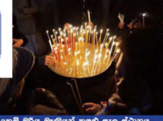
උතුම් මරිය මැණියන් කළුබ සැල ස්ථානය

මා නැවතත් පඩි පෙළ නැග පල්ලිය වෙත නැවත නැරී බලා පවු මාර්ග මතින් විකක් ඉක්මනින් යුදෙව්වන්ගේ ඉද්දි වූ බටහිර ඉදුර වෙත යන්නටය. විනාඩි ගණනාවකින් මට පහළින් ඇති මේ ඉදුර බැමීම කියා කීවොත් ඔබට නිවැරදිව විකුසක් මැවී පෙනෙනු ඇත. මේ බැමීම ඉතාම ඉහිට ගිස් ගොඩක් පමණි. මේ කැනට ඇතුළු වීමට පෙර කුඩා කොප්පියක් ලබා දෙන්නේ යුදෙව් ආගමේ විශ්වාස නිසාය. ගීස මුදුනේ පොඩි කොටසකට පමණක් ආවරණය කරන මෙයට යුදෙව් බසින් "කිපා" යනුවෙන් ආමන්තුණය කරයි.