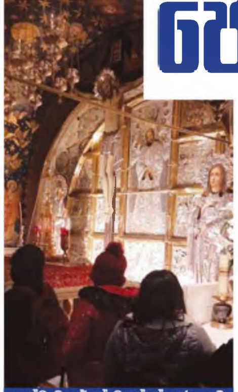
ඉද්දි වූ ජේසුස් වහන්සේ කුරැසට කියා ඇණ ගැසූ ස්ථානය

ගණනකගේ ඇස් ගැටුණු, මෙයට ආසන්නයෙන් දිවියන මාර්ගය අතීතයේ සිරියාවේ දමස්කස් තුළට දක්වා තිබී ඇති අතර අදටත් ලෝකයේ ඒ සුන්දර සාමය ධුලිතමා නිමක් කොතරම් ලස්සන වෙයිද. වකුරුගුටට ඉදුරා ඇත්තේ එකිනෙකට වෙනස් ක්‍රි.වර්ෂ දෙවන සියවසේ මතකයන් කවමක් ආරක්ෂා කර ගෙන ඇති බව පෙනේ. මා පසු කරන පාරමිටරික කඩවලට ඉහළින් ඇති ආරුක්කු අතීතයේ තිබුණු ශ්‍රී විභූතිය සුරැකිනනට අඩ අඳුර උදව් කරන බව මට නැගේ. මා මේ ඇවිදගෙන යන මේ මාර්ගයේ ඉද්දි වූ ජේසුස් වහන්සේ කපාල කන්දේ සිට කල්වාරි කන්ද දක්වා කර මතින් විශාල කුරුසය ධුලිත යන විට මහන්සියට බිම හිඳ ගත් ස්ථාන