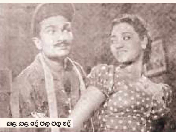
කළ කළ දේ පල පල දේ

“ලොක්කා ඇතුළේ බයස්කෝප් බලනවා! වුවමනාවක්දැයි” මම විමසිමි. ශාන්ති මට කාරණය නොවළඟා විස්තර කරමින් ඔහු කිහිලි ගන්නාගෙන ආ චිත්‍රපටි කතාව මට පෙන්වූයේය. එම කතාව ටිකක් දුර කියවාගෙන යන විට පැරැක් මහතා සිනමා හලෙන් කන්තෝරුවට ආවේය. ශාන්ති තමාට වී තිබෙන අකරතැඹිබිය පැරැක් මහතාට විස්තර කළ පසු අපි ඔහුගේ චිත්‍රපටි කතාව ගැන සාකච්ඡා කෙළෙමු. පසුදින ඔහු ශාන්ති කුමාර්ව සිලෝන් තියට්ස් සමාගමේ ප්‍රධාන අධ්‍යක්ෂ සර් විත්තම්පලම් ඒ.ගාඩිනර් මහතා වෙත කැඳව ගැනීමට පොරොන්දු විය. ශාන්ති කුමාර් මට පසුව විස්තර කළ අන්දමට ඒ සම්භාවනීය සිනමා ප්‍රදර්ශකයාගේ සහායෙන් පීටර් සිරිවර්ධන, ශ්‍රීමති කරුණාදේවී හඳුන්වා දුන් ශාන්ති සිංහල සිනමා භිතාවලියේ ප්‍රථම ස්වතන්ත්‍ර තනු නිර්මාණය කිරීමට ඉන්දියාවේ බැංගලෝරයේ