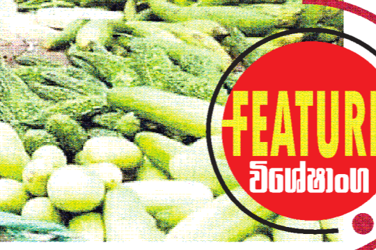
මහලු මිල නියම කිරීමේදී සලකා බැලිය යුතු කරුණු වන බවයි.

මහලු මිල නියම කිරීමේදී සලකා බැලිය යුතු කරුණු වන බවයි. මෙහිදී මහලු මිල නියම කිරීමේදී සලකා බැලිය යුතු කරුණු වන බවයි. මෙහිදී මහලු මිල නියම කිරීමේදී සලකා බැලිය යුතු කරුණු වන බවයි.