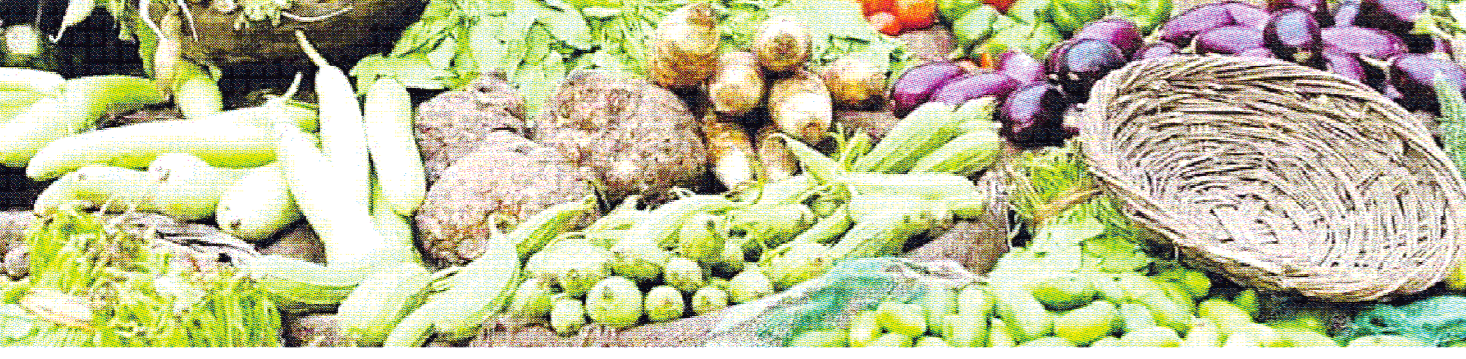
මහලු මිල නියම කිරීමේදී සලකා බැලිය යුතු කරුණු වන බවයි.

මෙහිදී මහලු මිල නියම කිරීමේදී සලකා බැලිය යුතු කරුණු වන බවයි. මෙහිදී මහලු මිල නියම කිරීමේදී සලකා බැලිය යුතු කරුණු වන බවයි. මෙහිදී මහලු මිල නියම කිරීමේදී සලකා බැලිය යුතු කරුණු වන බවයි.