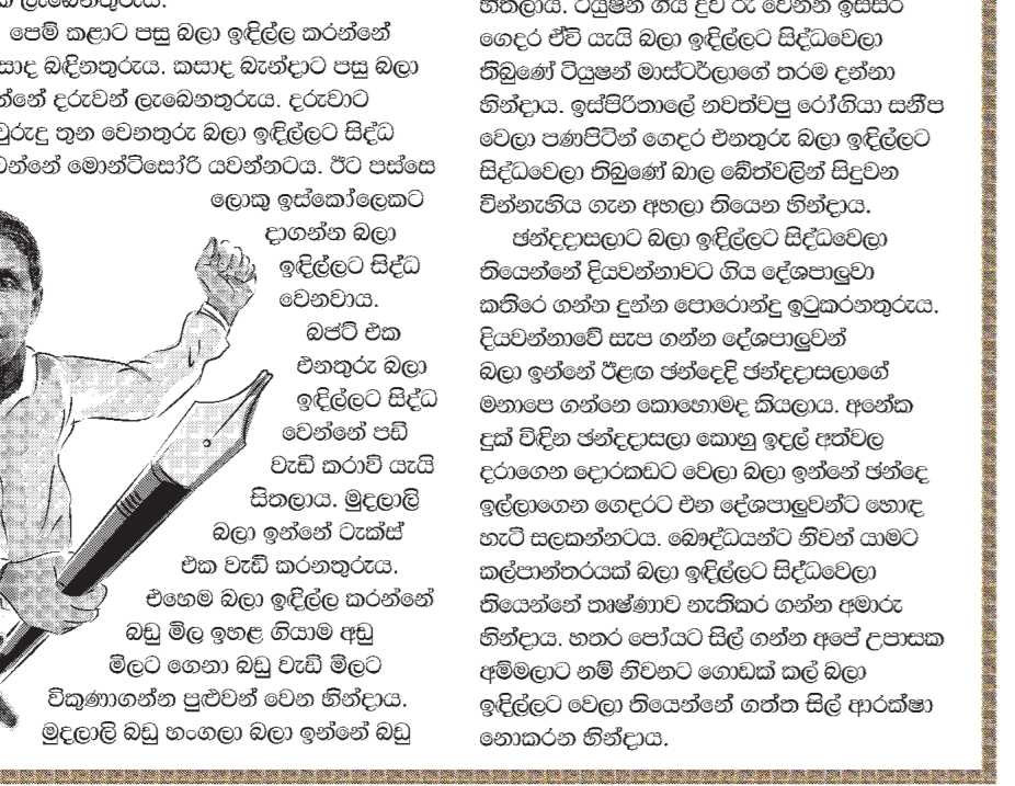
මහලු මිල නියම කිරීමේදී සලකා බැලිය යුතු කරුණු වන බවයි.

අපේ මොහොත් අලංකා පුරුදු වෙලා ඉන්නේ රටේ සමහර බලා ඉදිලේටයි. එහෙම බලා ඉදිලේටයි පුරුදු වෙලා නිම කරන්න මො ගමනේ ගන්න පුළුවන.