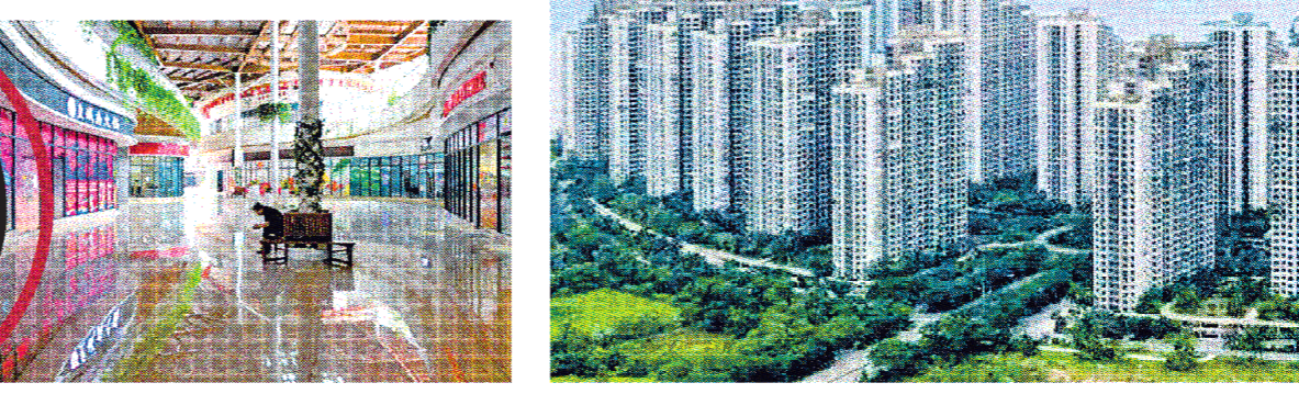
මහලු මිල නියම කිරීමේදී සලකා බැලිය යුතු කරුණු වන බවයි.

මහලු මිල නියම කිරීමේදී සලකා බැලිය යුතු කරුණු වන බවයි. මෙහිදී මහලු මිල නියම කිරීමේදී සලකා බැලිය යුතු කරුණු වන බවයි. මෙහිදී මහලු මිල නියම කිරීමේදී සලකා බැලිය යුතු කරුණු වන බවයි.