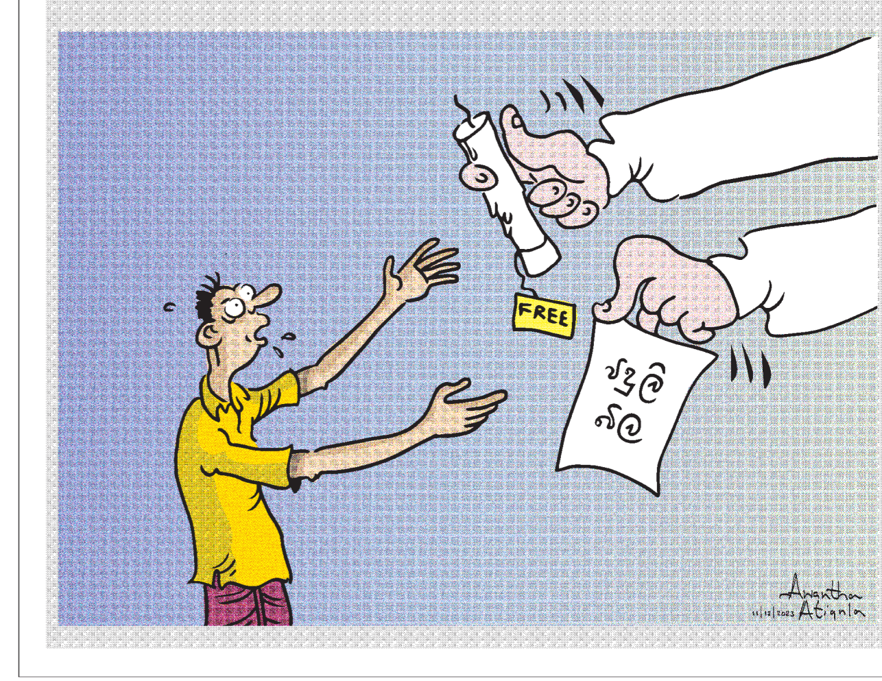
මහලු මිල නියම කිරීමේදී සලකා බැලිය යුතු කරුණු වන බවයි.