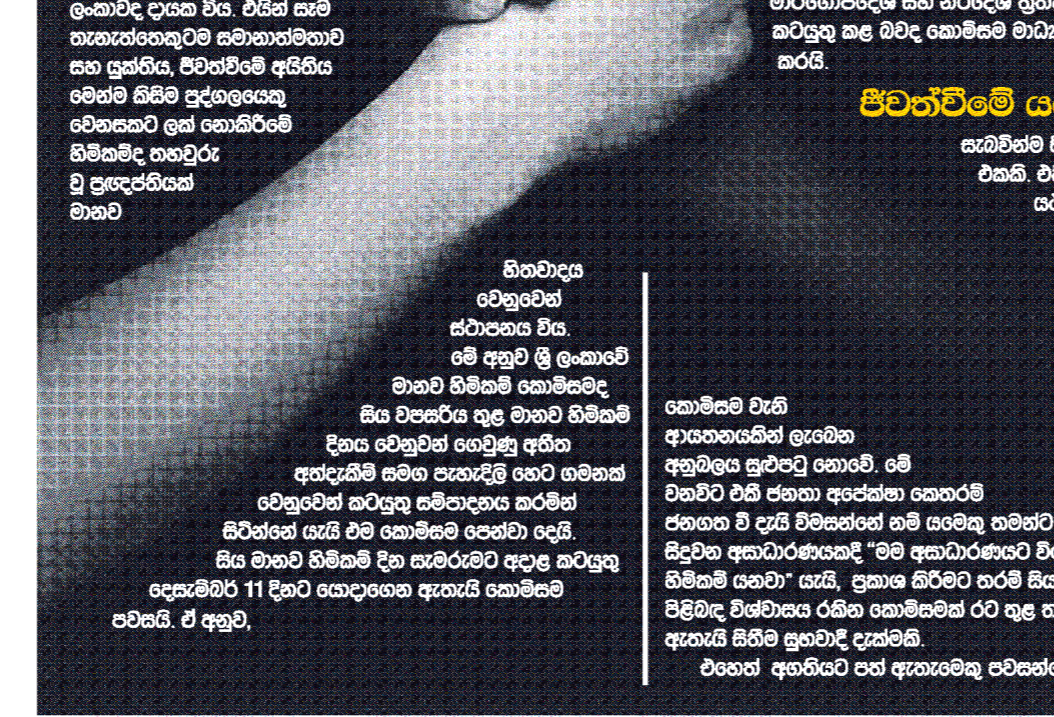
මහලු මිල නියම කිරීමේදී සලකා බැලිය යුතු කරුණු වන බවයි.

මානව හිමිකම් දිනයේදී 10වන දින තවත් සාකච්ඡා කරන බවයි. මෙහිදී මහලු මිල නියම කිරීමේදී සලකා බැලිය යුතු කරුණු වන බවයි.