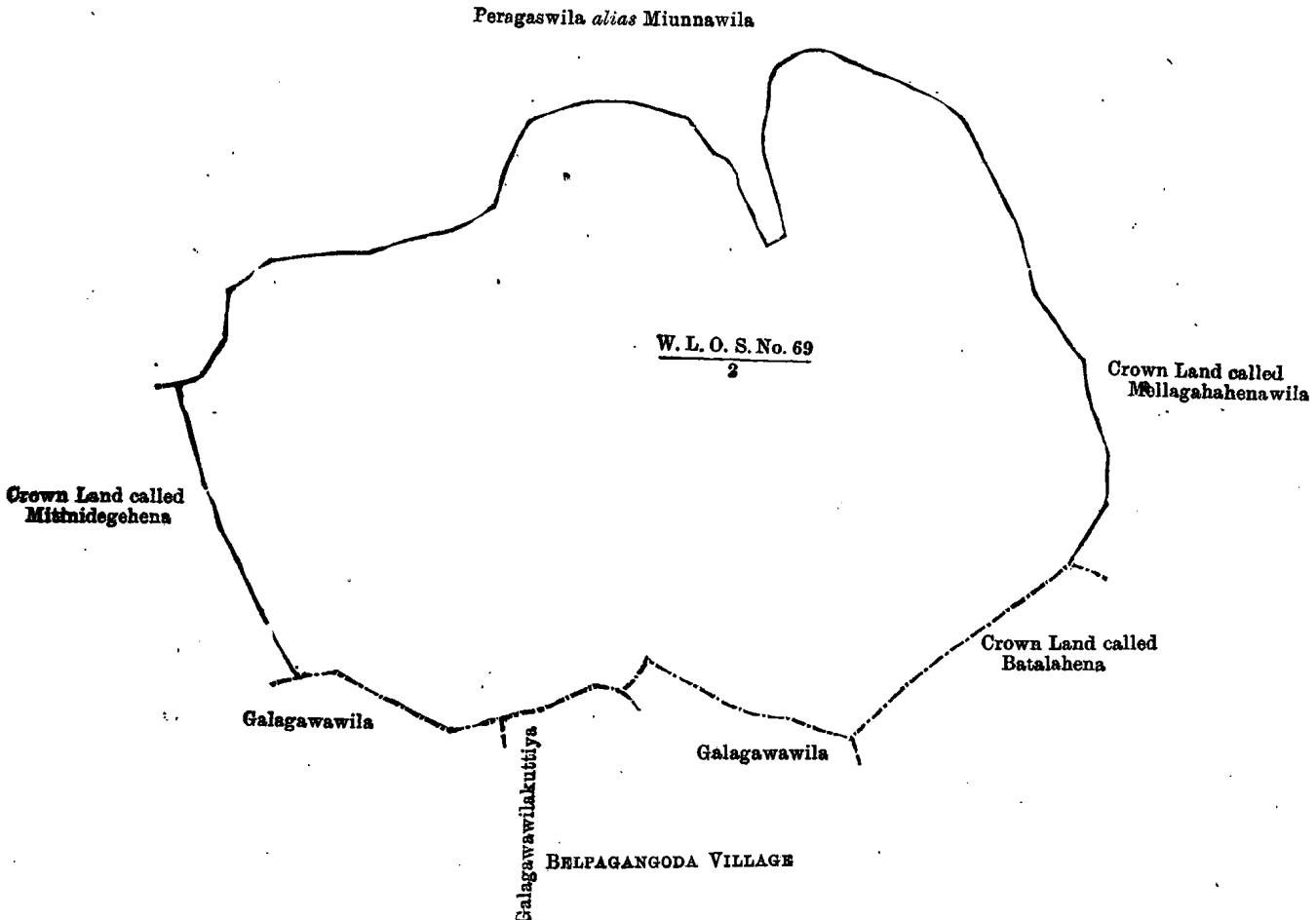
Lot No. 2, called Mellagahahena alias Mitinidegehena, in extent 19A. 3R. 35P., situated in Howpe village in the Gangaboda pattu.

Surveyor-General's Office, Colombo, February 14, 1900.