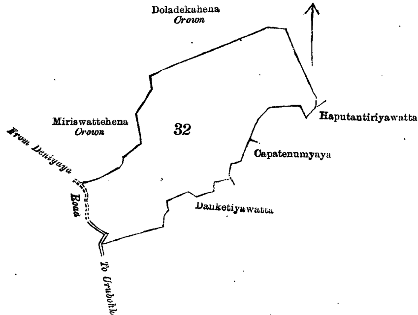
Lot 32 called Lenawarahena, in extent 15A. 1R. 35P., situated in Beralapanatara village in Udugaha pattu of Morowak korale.

தன் மாகாணத்தின் மாத்தூறை டிஸ்த்ரிக்டில் மொறவக்கோழிநகையச்சேர்ந்த பெறளபனாகுற என்னும் கிராமத்திலுள்ள றொம்பர் O \frac{10}{52, 60} ம் அளவுக்கடதாசியில் காணப்படும் பங்கு 32 ம் பிரிவுபடி வேறாவாகேயென்று பொதுவாய்ச் சொல்லப்படுகிற அல்லது அறியப்படுகிற இத்தோடணத்தற்குக்கும் குறிக்கப்பட்ட உறுதிப்படுத்திய டாப்பில் வ்வரிக்கப்பட்டதும் 15 ஏக்கர் 1 ரூட் 35 பர்சஸ் விஸ்தாரமுள்ளது :— எலிஸ், வடக்கு-அரசாட்சிக்குள்ள தொளதெககேன் ; கிழக்கு-அத்ததஸ்ஸி உன்னுன்சேயும் சிலபேர்களுக்கருமடைய கப்புதன் திரியாவத்த, மேற்சொல்லியவர்களுடைய கபர்தெனும்யாய; தெற்கு-தொன் லுவிஸ் ராஜபக்சவுக்கும் சிலபேர்களுக்கருமடைய தன்கெட்டையேவத்த ; மேற்கு-ஊறுபொக்கிலிருந்து சொட்டபொலவுக்கு போகும் சின்னரோட்டும், பெறளபனாகுறிலிருந்து தெனியாயவுக்குபோகும் கம்ஸபாவ ரோட்டும், அரசாட்சிக்குள்ள பிரிஸ்வத்தேகேன்.