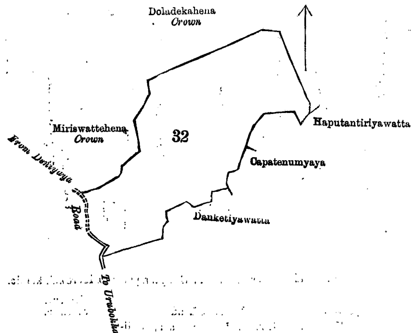
Lot 32 called Lenawarahena, in extent 15A. 1R. 85P., situated in Beralapanatara village in Udugaha pattu of Morowak korale.

தன் மாகாணத்தின் மாத்தூரை டிஸ்த்ரிக்டில் மொறவக்கோறனைப்பச்சேரிந்த பெறளபனாகர என்னும் கிராமத்திலுள்ள நொம்பர் O \frac{10}{52, 60} ம் அளவுக்கடதாசியில் காணப்படும் பங்கு 32 ம் பிரிவுபடி லேகுவரகேன யென்று பெர்துவாய்ச் சொல்லப்படுகிற அல்லது அறியப்படுகிற இத்தோட்டணத்திற்குக்கும் குறிக்கப்பட்ட உறுதிப் படுத்திய டாப்பில் விவரிக்கப்பட்டதம் 15 ஏக்கர் 1 ரூட் 35 பர்சன் விஸ்தாரமுள்ளது :— எல்லை, வடக்கு-அரசாட்சிக்குள்ள தொளதெககேன ; கிழக்கு-அத்ததன்ஸி உண்ணச்சேயும் சிலபேர்களுக் குமுடைய கப்புதன் திரியாவத்த, மேற்சொல்லியவர்களுடைய கபாதெனும்யாய; தெற்கு-தொன லுவிஸ் ராஜபக் சவுக்கும் சிலபேர்களுக்குமுடைய தன்கெட்டியேவத்த ; மேற்கு-ஊறுபொக்கிஸ்திருந்த கொட்டபொலவுக்கு போ கும் சின்னரோட்டும், பெறளபனாதரிஸ்திருந்து தெனியாயவுக்குபோகும் கம்ஸபாவ ரோட்டும், அரசாட்சிக்குள்ள மிரிஸ்வத்தேகேன.