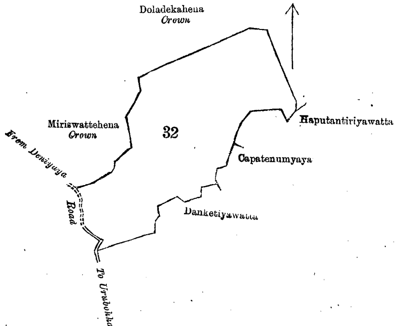
Lot 32 called Lenawarahena, in extent 15A. 1R. 35P., situated in Beralapanatara village in Udugaha pattu of Morowak korale.

தென் மாகாணத்தின் மாத்துறை டிஸ்த்ரிக்டில் மொறவக்கோறளையச்சேர்ந்த பெறளபனாகற என்னும் கிராமத்திலுள்ள நொம்பர் O \frac{10}{52, 60} ம் அளவுக்கடதாசியில் காணப்படும் பங்கு 32 ம் பிரிவுபடி லேனாவரகேன யென்று பொதுவாய்ச் சொல்லப்படுகிற அல்லது அறியப்படுகிற இத்தொடணத்திருக்கும் சூறிக்கப்பட்ட உறுதிப் படுத்திய டாப்பில் விவரிக்கப்பட்டதும் 15 ஏக்கர் 1 ரூட் 35 பர்சஸ் விஸ்தாரமுள்ளது :— எலை, வடக்கு-அரசாட்சிக்குள்ள தொளதெக்கேன ; கிழக்கு-அகத்தளனி உளனஞ்சேயும் சிலபேர்களுக்க குமுடைய கப்புதன் திரியாவத்த, மேற்சொல்லியவர்களுடைய கபாதெனும்யாய; தெற்கு-தொள லுவிஸ் ராஜபக் சவுக்கும் சிலபேர்களுக்குமு டைய தன்கெட்டியேவத்த ; மேற்கு-ஊறுபொக்கிஸ்ருந்து மொட்டபொலவுக்கு போ கும் சின்னரேட்டும், பெறளபனாதரிஸ்ருந்து தெனியாயவுக்குபோகும் கம்ஸபாவ ரேட்டும், அரசாட்சிக்குள்ள மிரிஸ்வத்தேகேன.