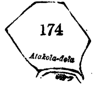
Scale of 8 Chains to an Inch. Preliminary plan 10

Lot 174 called Kanankadeniyahenagodella, in extent 2A. 3R. 17P., situated in Welive village in Palle pattu of Morowak korale.