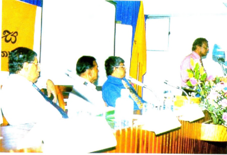
119 වැනි ජාතික පුස්තකාල දේශනය 119 ஆவது தேசிய நூலகப் பேருரை 119 th National Library lecture 25.04.2000

ශ්‍රී ලංකා මහ බැංකු පුස්තකාලයට පොත් පරිච්ඡායයක්