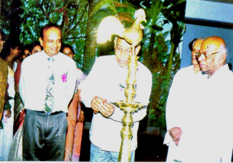
சோன் பூதீரணய விவக கிரீம நூற் கண்காட்சியைத் திறந்து வைத்தல் Inauguration of the book exhibition, NLDSB 24. 04.2000