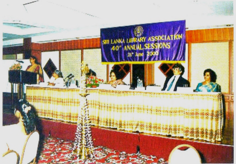
ශ්‍රී ලංකා පුස්තකාල සංගමයේ 40 වැනි මහා සභා රැස්වීම இலங்கை நூலக சங்கத்தின் 40 ஆவது ஆண்டுப் பொதுக் கூட்டம் 40th Annual General Meeting of Sri Lanka Library Association 28.06.2000