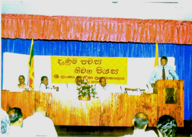
ජාතික පුස්තකාල දසවස් සමරු දේශන මාලාව தேசிய நூலகத்தின் தசாப்த பூர்த்தி விழாப் பேருரைத் தொடர் Lecture series on 10 anniversary of NLDC 24.04.2000