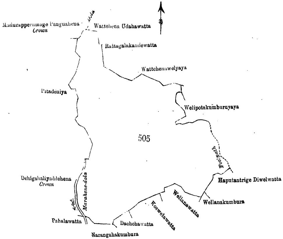
Scale of 8 Chains to an Inch.

எல்ல, வடக்கு-அரசாட்சிக்குள்ள மதுறப்பெறும்க பன்ருவகேள, ஒடை, வெலிபொத்தகே உக்குகாமியும் சிலபேர்களுக்குமுடைய வத்தேகேளேடகவத்த, நத்தாகலக்க ஸபேகாமியும் சிலபேர்களுக்குமுடைய நத்தாகலகந்தேவத்த, கமக்க முதலிகாமியும் சிலபேர்களுக்குமுடைய வத்தேகேளேவெல்யாய; கிழக்கு-வெலிபொத்தகே உக்குகாமியும் சிலபேர்களுக்குமுடைய வெலிபொத்தகேளும்புறுயாய, அடிபாதை, ஹப்புதந்திரிகே புஞ்சி அப்புலும் சிலபேர்களுக்குமுடைய ஹப்புதந்திரிகே திவெல்வத்த, வெலிபொத்தகே உக்குகாமியும் சிலபேர்களுக்குமுடைய வெள்ளாளேகும்புர; தெற்கு-வெலிபொத்தகே உக்குகாமியும் சிலபேர்களுக்குமுடைய வெள்ளாளேவத்த, கண்காணிகே முதலிகாமியும் சிலபேர்களுக்குமுடைய கொஸபெலவத்த, ஏகனாயக்ககே கிரிகாமியும் சிலபேர்களுக்குமுடைய தாச்சுவத்த, ஏகனாயக்ககே தஸனும் சிலபேர்களுக்குமுடைய நான்காகும்புர; மேற்கு-மாறகேளேதொல, அரசாட்சிக்குள்ள தெகிகாளியத்தேகேள, மதுறப்பெறும்கே உரதல்காமியும் சிலபேர்க்கும் உரித்துபேசும் பிட்டதெனிய.